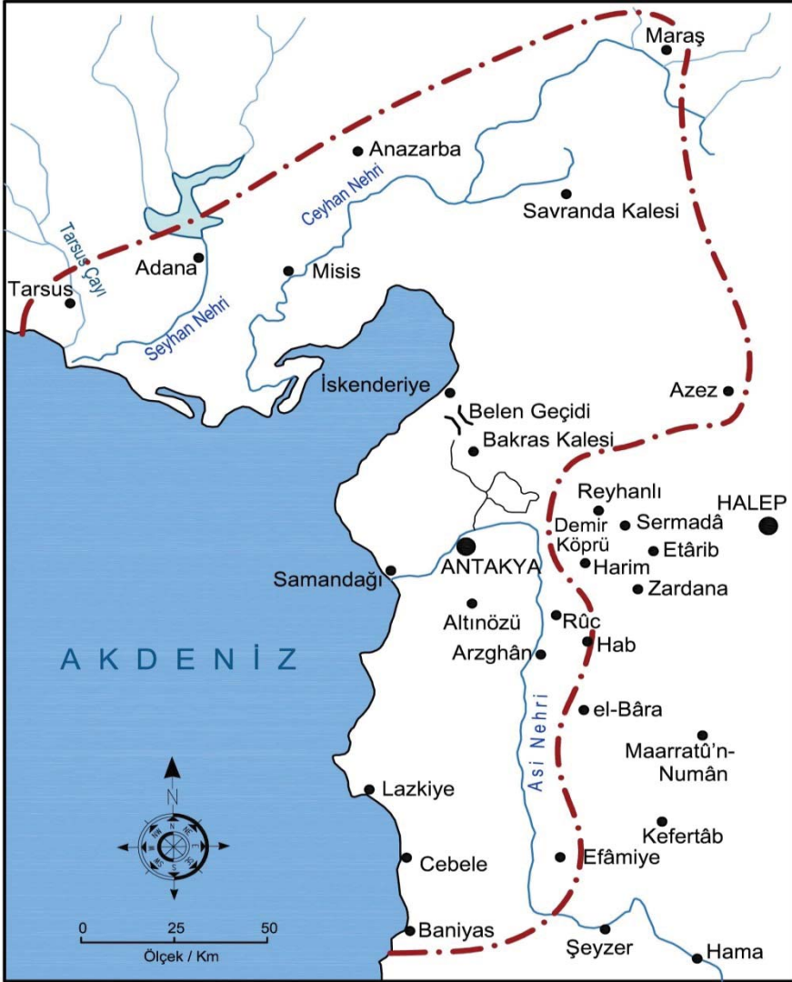
Harita 3. Afrin Savaşından sonra Antakya Haçlı Prinkepliğinin sınırları (1, 2 ve 3 numaralı haritalar T. Asbridge tarafından yayınlanan haritalara dayanarak hazırlanmıştır. T. Asbridge, “The Significance and Causes of the Battle of the Field of Blood”, Journal of Medieval History , (23:4/1997), s. 304, 310.