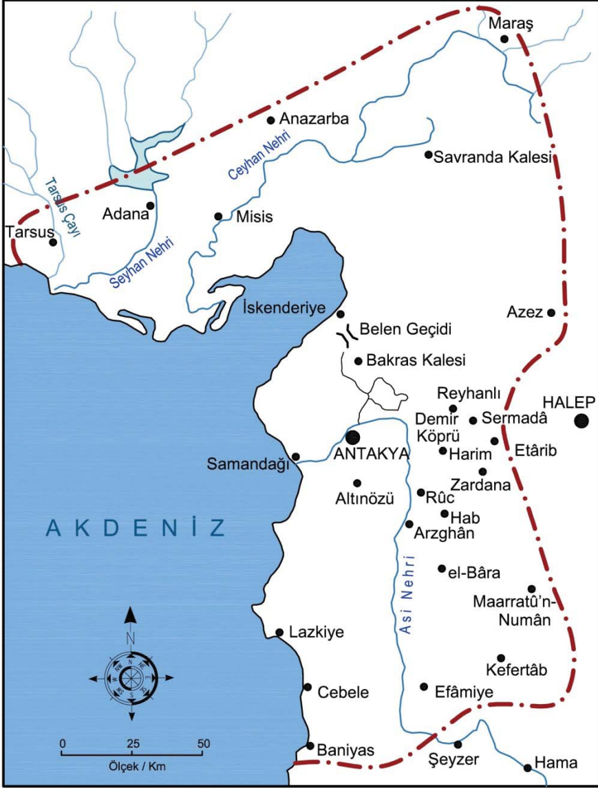
Harita 2. Afrin Savaşından önce Antakya Haçlı Prinkepliğinin sınırları.