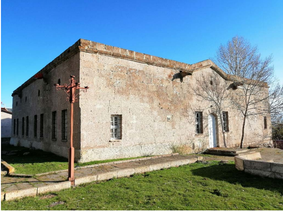
Kaynak: Kişisel Arşivimden.