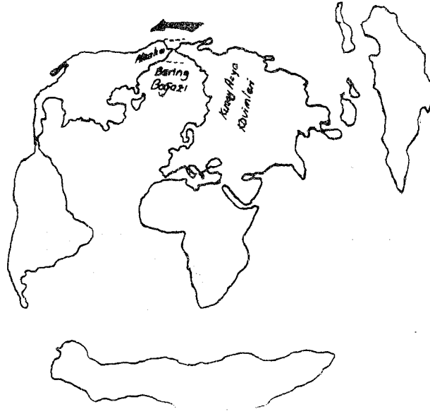
Şekil 1.a:İ.Ö. 9000-10.000 yılları arasında İnka Uygarlığının ilk temelleri atılmış.