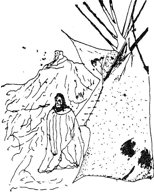
Şekil 2.a: Bir Navajo yerlisi çadırı