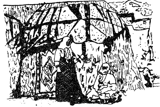
Şekil 2.b: Anadolu insanının çadırından bir görüntü