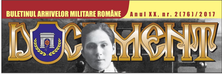
Görsel 3. Romanya Ordusu Arşivi Bülteni Document 'ın 2017, 2 (76) sayısından detay.