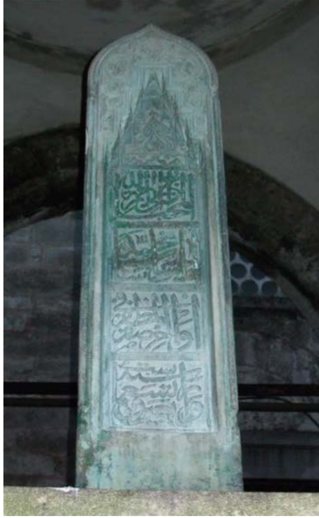
Resim 3. Ayas Paşa'nın Mezar Taşı (Evâbir-i Safer'ül-Muzaffer Sitte ve Erba'in ve Tis'amie/ 946)

Kısacası, Ayas Paşa'nın yerine Vezir-i Azam olarak atanan Lütü Paşa'nın tavsiyesiyle Sinan'ın haseliklikten mimarbaşılığa getirilişi 1539 tarihinde, muhtemelen de Temmuz ayı sonlarında olmuştur. Bu konuda Gülru Necipoğlu, Semavi Eyice, Oktay Aslanapa ve Afet İnan da, Hassa Mimarbaşı Acem Ali'nin yerine Sinan'ın tayin tarihi olarak 1539'u vermektedir (Aslanapa, 1992, s.5), (Afetinan, 1968, s.27), (Necipoğlu, Crane & Akın, 2006, s.6), (Necipoğlu, 2013, s.180), (Eyice, 1991, s.204) 16 . Sinan'ın Hassa mimarbaşı ünvanıyla yaptığı ilk işlerinden biri olarak da geçen (Eyice, 1991, s. 204) Ayas Paşa için yapılması gereken türbe nedeniyle Sâi Mustafa Çelebi'nin belirttiğine göre, Eyüp'teki türbesinin yapım işi, Lütü Paşa'nın tavsiyesiyle artık hassa mimarbaşı olan Mimar Sinan'a verilmiştir (Sâi Mustafa Çelebi, 1315, s.26) 17 . Buraya kadar açık bir şekilde ortaya çıkan sonuca göre; Sinan'dan önce Hassa mimarbaşı olan Acem Ali ve Ayas paşa Temmuz 1539 tarihlerinde vefat etmişlerdir 18 . Mimar Sinan, Lütü Paşa'nın önerisiyle hem Mimar Acem Ali'nin hem de Ayas Paşa'nın ölümünden sonra 1539 yılı Temmuz sonlarında Hassa mimarbaşı olarak atanmış ve ilk olarak Ayas Paşa'nın Türbesinin yapımı için görevlendirilmiştir.