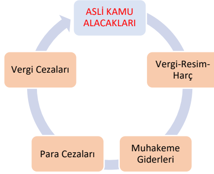
Şekil 1: Asli Kamu Alacakları

ve aynı idarelerin akitten, haksız fiil ve haksız iktisaptan doğanlar dışında kalan ve amme hizmetleri tatbikatından olan diğer alacakları ile bunların takip masrafları kamu alacağı sayılmıştır. Ayrıca maddede 5237 sayılı Türk Ceza Kanunu'nun para cezalarının tahsil şekli ve hapse tahvili hakkındaki hükümlerinin saklı tutulacağı belirtilmiştir.