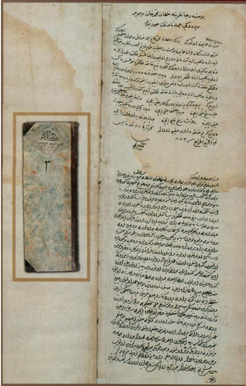
Resim 4. Fatih Bosnalı Fransisken Rahiplerine verdiği fermanın Osmanlı Arşivindeki kopyası Başbakanlık Osmanlı Arşivi, Düvel-i Ecnebiyye Defteri 14/2_1.

Cevat Ekici (ed.), Gökkuşbuğ Altında Birlikte Yaşamak, Belgelerin Diliyle Osmanlı Hoşgörüsü Ankara: Başbakanlık Devlet Arşivleri Genel Müdürlüğü, Osmanlı Arşivleri Daire Başkanlığı Yayın Nu:77, 2006, s.2'den alınmıştır.