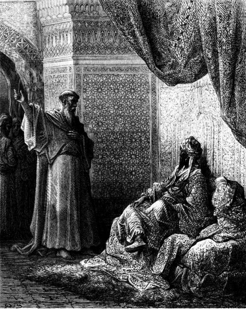
Resim 1. Gustave Doré'nin "François devant le Sultan" (Fransis Sultan'ın önünde) isimli tablosu.

Joseph-François Michaud, Histoire des croisades, illustrée de 100 grandes compositions par Gustave Doré (Paris, 1826), gravure 50, i. 402'den aktaran John Tolan, Saint Francis and the Sultan , s.2.