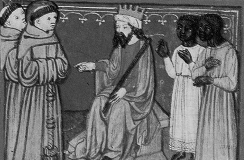
Resim 3. MS 1266 tarihli bir resim "Roma, Museo dei Cappuccini"