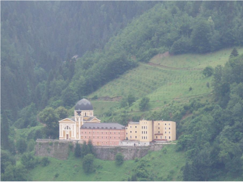
Resim 6. Fojnica Manastırı