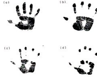
Şekil 2: Avuç İçi Baskısı; dominant elin siyah mürekkebin fırça ile boyanarak beyaz bir sayfaya bastırılması ile elde edilir. Grade 0; Avuç içi ve tüm falanklar belirgin, Grade 1; 4-5 interfalangeal alanlarda ve avuç içinde görünüm kaybı, Grade 2; 2-5 interfalangeal alanlarda görünüm kaybı ve Grade 3; avuç içinde görünüm kaybı daha fazla ve sadece parmak uçları izlenir.

Diabetes mellitus hastalarında da zor laringoskopi ve entübasyon sıklığı %27-31 olarak belirtilmiştir (4,8). Bu hastalarda eklem rijiditesi ve gergin deri ile karakterize sert eklem sendromu ve boyun omurları tutulumu ile kısıtlı atlanto-oksipital eklem oluşabilir. Tüm bunlara kronik hipergliseminin neden olduğu doku proteollerinin glikozilasyonunun anormal kollajenle karşıt bağlantısının yol açtığı düşünülmektedir (9). Romatoid artrit; birden fazla sistemi tutan otoimmün bir hastalıktır. Bu hastalarda el bileğinde ve parmaklarda deformiteler gözlenmektedir. Ayrıca temporo-mandibular eklem veya aritenoid eklem hareketsizliği hava yolu emniyetini sınırlamaktadır (10).