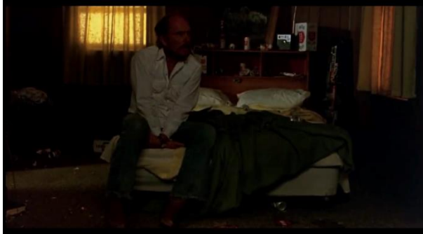
Görsel 1: Filmin açılış sahnesinde Mac

Filmde Mac'i ilk olarak motel odasında karanlık bir ortamda görürüz. Oda dağınık ve içki kutuları etrafa dağılmış durumdadır (Görsel 1). Filmde, Mac'in karakter eğrisi, yaşamın anlamsızlığı ya da amaçsızlığının kötü yönde etkilemesinden, anlamlı ve yaşamaya değer bir hayata doğru gelişir. Filmin kapanış sahnesinde ise Mac'i dışarıda güneşli güzel bir günde üvey oğlu Soony ile oynarken görürüz (Görsel 2).