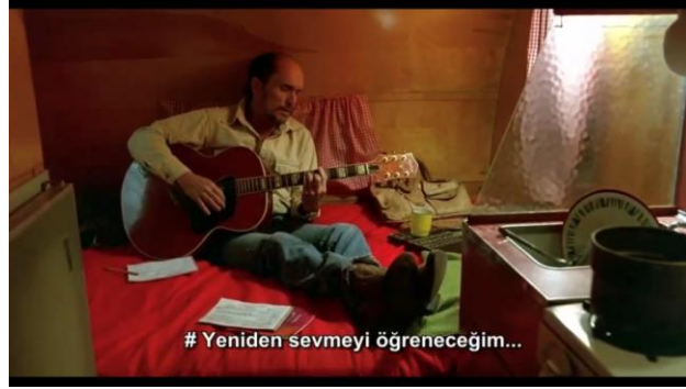
Görsel 5: Mac'in şarkılarındaki düşlemleri bilinçdışını yansıtır

Jung'a göre, bu değerlerin yer aldığı bilinçdışı, potansiyel bir gerçekliktir. Gelecekteki düşüncemiz, yapacağımız iş ve yazgımız bugünümüzün bilinçdışında yatar. Bilinçdışı görüngüler kendilerini bireyin davranışlarında belli ederler. Dikkatli bir gözlemci onları kolayca görebilir (2006b: 184, 187). Mac'in gitarıyla söylediği şarkı sözleri, onun bilinçdışının yansımalarıdır. Şarkı sözlerinde özellikle 'sevgi' teması dikkatimizi çeker. (Görsel 5).