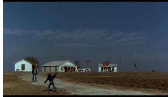
Görsel 2: Filmin kapanış sahnesinde Mac

Bu iki sahne arasındaki zıtlık, Mac'in yaşadığı bireyleşme ya da dönüşüm hikayesinin sinematografik olarak vurgulanması olarak okuyabiliriz. Bu bağlamda, Tender Mercies , filmin bütünselliği de dikkate alındığında, karanlığın gücünü yenen değerlerle gerçekleştirilen simgesel bir 'yeniden doğuş' hikayesini konu edinir.