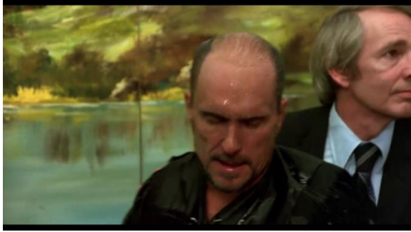
Görsel 8: Mac'in vaftizi

doğması için eski ego benliğinin ölmesini vurgular. Mac'in sudan çıkışı, bireyleşme sürecinin ancak eski benliğinden arındıktan sonra başlayabileceğine işaret eder.