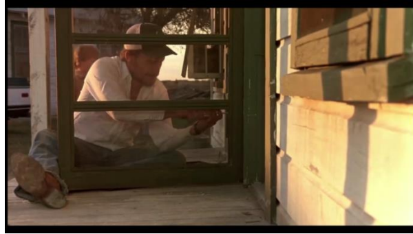
Görsel 6: Mac tamirat işlerini doğallıkla yapar

Maske anlamındaki persona'yı, dış kişilik tutumu olarak adlandıran Jung'a göre, dünya, insanları belirli bir davranışa zorlar ve insanlar bu beklentileri yerine getirmek için çaba harcarlar. Bireyleşmenin daha ilk basamağında tehlikeli olan, kişinin 'persona'sıyla özdeşleşmesidir. Bu durumda en basit iş bile doğallıkla yapılamaz (2015a: 55). Filmde persona arketipi, bireyleşme sürecindeki olumlu ve olumsuz yönleriyle, Mac ve eski karısı Dixie üzerinden ele alınmaya uygundur. Borcuna karşılık olarak motelde çalışmaya başlayan Mac, tamirat işlerini (Görsel 6) ve etraftaki çöp toplama işlerini doğallıkla yapar. Mac, yeni 'persona' rolünün bilincinde ve bu rolünü benimsemiş durumdadır.