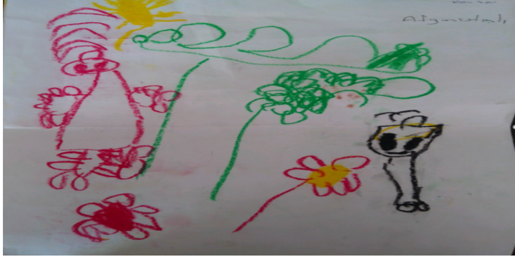
Şekil 9. Kızgınlık ile ilgili çizim

Bu resim daha önce yorumlanmış olmasına karşın yalnızca çocuklara dikkat çekilmiştir. Resimde kırmızı renkte çizilen çocuk, resmi çizen çocuğun kendisidir. Siyah renkte çizilmiş olan çocuk ise arkadaşıdır. Fakat iki arkadaş arasında bulunan çiçekler ve özellikle büyük bir şekilde çizilmiş ağaç figürü arkadaşlar arasında sorunların olduğunu ve araya bazı olayların girdiğini göstermektedir. Daha önce yapılan yorum ile ilişkilendirilince çocuğun arkadaşı tarafından baskılandığı diğer çocuğu baskıcı olarak algıladığı, yaşanan sorunun çocuklar arasında bir gerilime sebep olup öğrencileri birbirinden uzaklaştırdığı yorumlanabilir. Buna karşın baskılanan çocuk diğer arkadaşıyla birlikte olma arzusu içinde olduğu fakat yaşanan durumun kızgınlığa sebep olduğu sonucu çıkarılabilir.