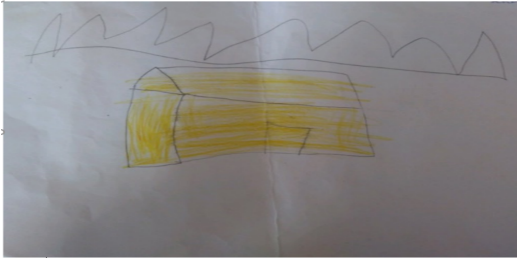
Şekil 7. İçe kapanıklığa yönelik bir çizim

Daha önce bu resme yönelik yorum farklı bir boyutta değerlendirilmiştir. Okul binası penceresiz bir şekilde çizilirken, Resimde çocuğun kendisini, arkadaşlarını ve öğretmenini çizmemiş olması sadece okulun binasını çizmesi, çocuğun çevreyle ilişkisinde içine kapanık olduğunu göstermektedir. Yani çocuğun dış çevreyle iletişim kurmakta sıkıntı çektiğini göstermektedir.