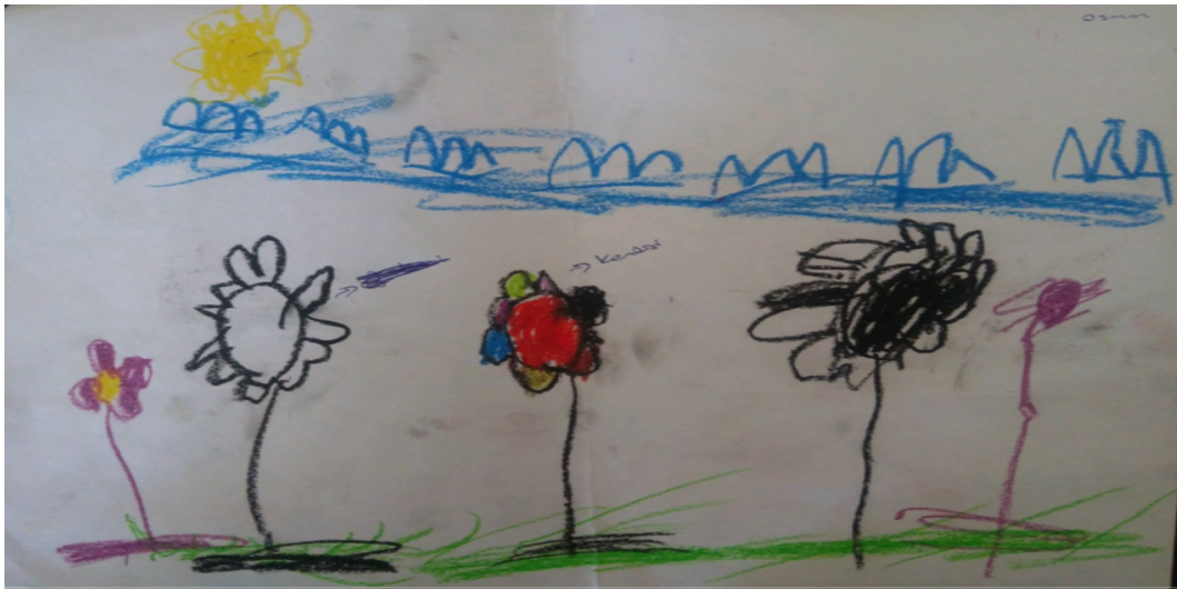
Şekil 5. Baskınlığa yönelik bir resim

Bu resimde iki tane çocuk vardır, çocuk kendisini kırmızı renkte ve arkadaşını da siyah renkte çizmiştir. Kırmızı renkte çizilen çocuğun el ve ayak parmakları varken, siyah renkte olan çocuğun ellerinin olmayışı, el ve ayak parmaklarının da çizilmeyişi kendisini kırmızı renkte çizen çocuğun dominantlığı yani liderlik, üstünlük pozunun kendisinde olduğunu göstermektedir. Bu durum çocuğun çevresinde birileri tarafından bastırıldığı ya da etki altında bırakıldığına göstergesi olarak düşünülmektedir.