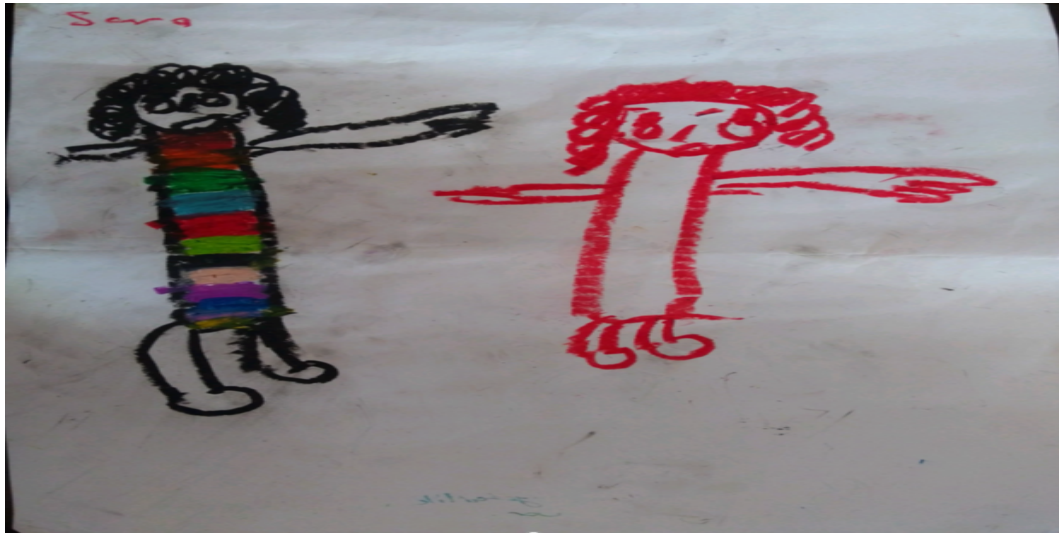
Şekil 6. Mükemmeliyetçiliğe yönelik bir çizim

Resimde iki çocuk gözükmemektedir. Soldaki çocuk renkli bir elbiseye sahiptir. Solda bulunan çocuk ise tek renk olacak şekilde çizilmiştir. Ayrıca sol tarafta bulunan çocuk sağdaki çocuktan daha büyüktür. Resimde en başta çizilen siyah saçlı çocuk, resmi çizen çocuğun kendisi olduğunu söylemiştir. Çocuk; kendi elbisesini belli bir düzen halinde, belli bir sırada, farklı renklere boyamış olması mükemmeliyetçiliğini göstermektedir.