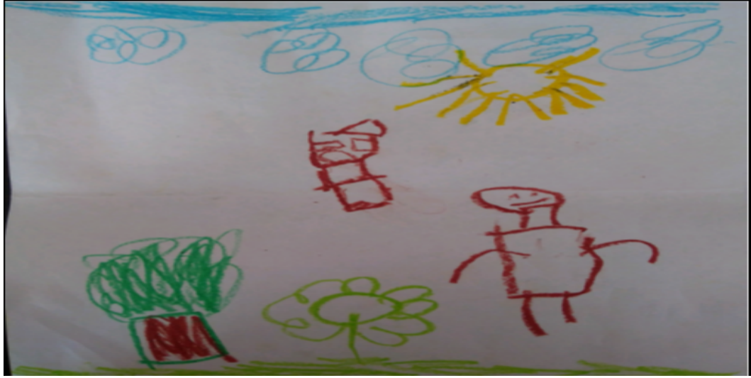
Şekil 11. Mutluluk ile ilgili bir çizim

eksik etmemesi, resimde de kendisini güler yüzlü çizmesi her şekilde mutlu olduğunun göstergesidir. Buna karşın yaşanan deprem çocuğa verilen yönergenin dışına çıkıp hayatında kalıcı iz bırakan depremi çizmesine neden olmuştur. Bu resimde ayrıca karamsarlık ve korku temsil eden renk olan siyah baskın olarak kullanılmıştır.