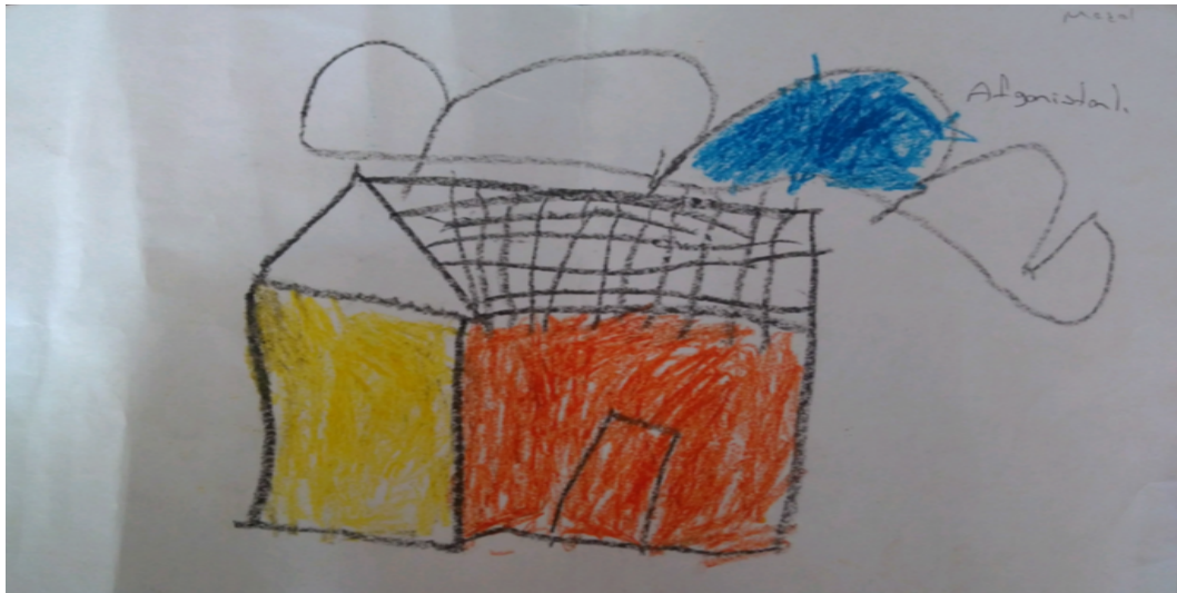
Şekil 8. İçe kapanıklığa yönelik bir çizim

Daha önce bu resme yönelik yorum farklı bir boyutta değerlendirilmiştir. Okul binası penceresiz bir şekilde çizilirken, Resimde çocuğun kendisini, arkadaşlarını ve öğretmenini çizmemiş olması sadece okulun binasını çizmesi, çocuğun çevreyle ilişkisinde içine kapanık olduğunu göstermektedir. Yani çocuğun dış çevreyle iletişim kurmakta sıkıntı çektiğini göstermektedir.