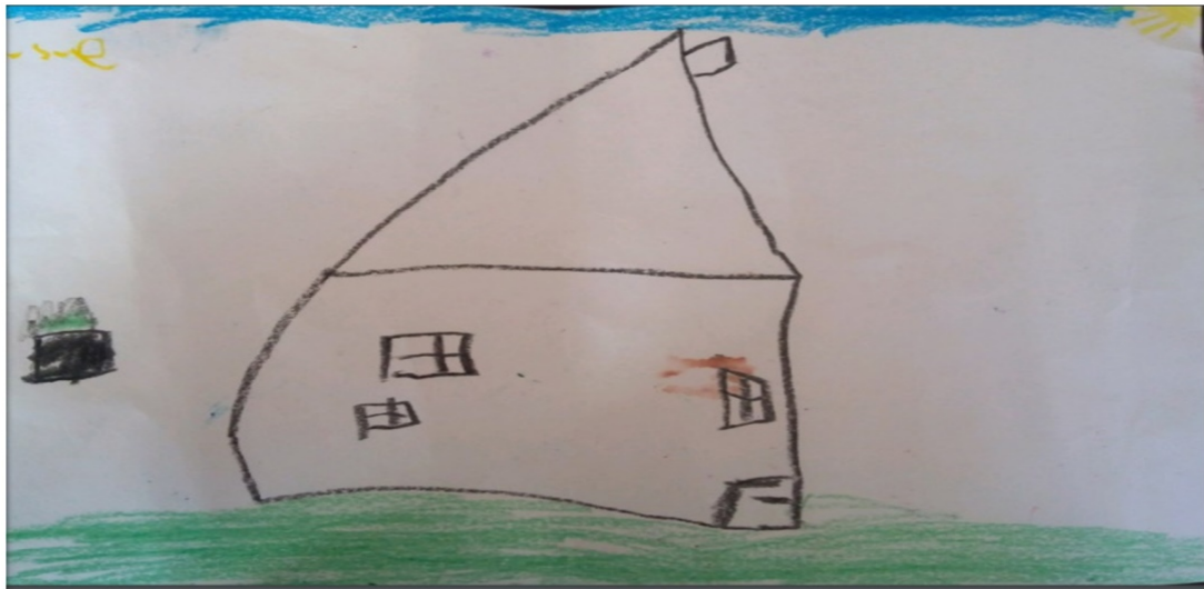
Şekil 3. Güvensizliğin farklı bir göstergesi

Şema öncesi dönemde çocuklar kendilerini bir bitki veya hayvan şeklinde çizebilirler. Ortada gördüğümüz rengarenk çizilen çiçek çocuğun kendisidir. Çocuğun diğer çizmiş olduğu çiçeklerde sınıftan arkadaşlarıdır. Kendisiyle beraber 3 çiçek zemine oturtulmuş; fakat sadece aralarından tamamen siyah renge boyanmış olan çiçek zemine oturtulmamıştır ve bu çocuğun arkadaşıyla yaşamış olduğu sorunu ve ona karşı bir güvensizliği olduğunu göstermektedir.