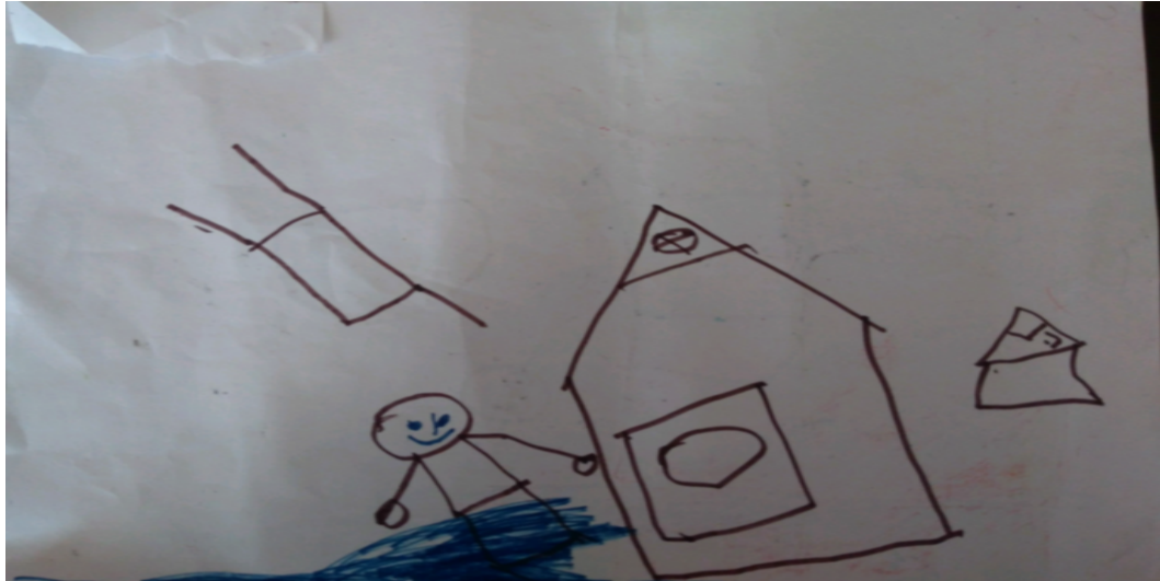
Şekil 10. Mutluluğa yönelik bir çizim

Yapılan çizimlerde çocukların mutluluklarını ifade ederken bazı sorunlar ile belirttiği görülmüştür. Bu yaşanan sorunlar deprem ve göç gibi kritik durumlar olsa da çocuklar mutlu olduklarını ifade etmektedir. Aşağıda bu duruma yönelik iki örnek sunulmuştur.