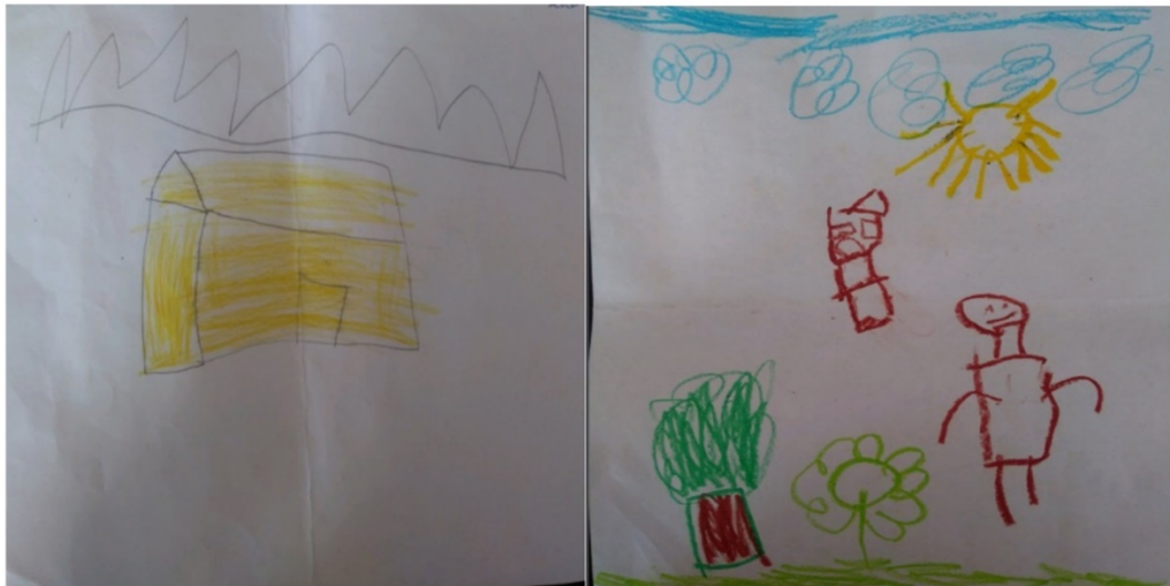
Şekil 1. Güven problemi ile ilgili resimler