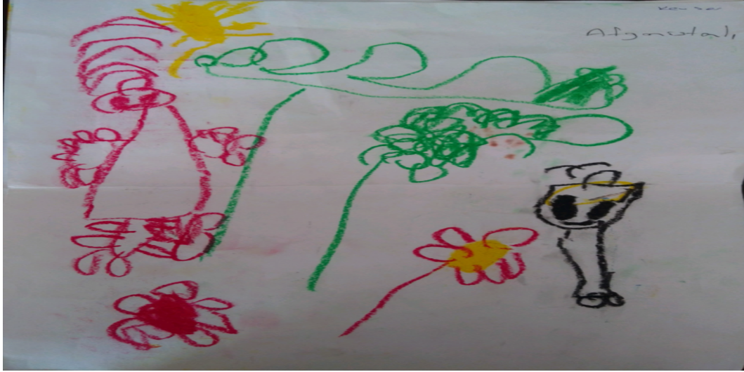
Şekil 4. Baskı altında olmaya yönelik bir resim

Aşağıda öğrencilerin çizimleri ve bu çizimlerde yer alan baskınlık imgeleri detaylandırılarak aktarılmaya çalışılmıştır.