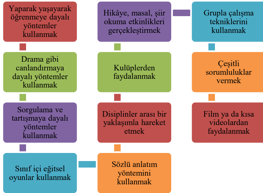
Şekil 2: Öğretmenlerin yaşam becerileri kazandırmaya yönelik gerçekleştirdiği uygulamalar

Kendilerinde ve meslektaşlarında yaşam becerisi kazandırma yeterliği olduğunu düşünen öğretmenlere “Öğrencilerin bu becerileri kazanmasına yönelik ne gibi uygulamalar/etkinlikler gerçekleştiriyorsunuz?” sorusu sorulmuştur. Öğretmenler, yaparak yaşayarak öğrenme, drama, tartışma, oyun, düz anlatım, grupta çalışma, film izletme gibi yöntem ve tekniklerden bahsetmiştir. Bazı öğretmenler disiplinler arası bir yaklaşımla hareket ettiğini, bazıları şiir, hikâyeye, masal gibi edebi türlerden faydalandığını ya da öğrencilere bol bol sorumluluk verdiğini, bazıları ise kulüp çalışmalarını işe koştüğünü anlatmıştır.