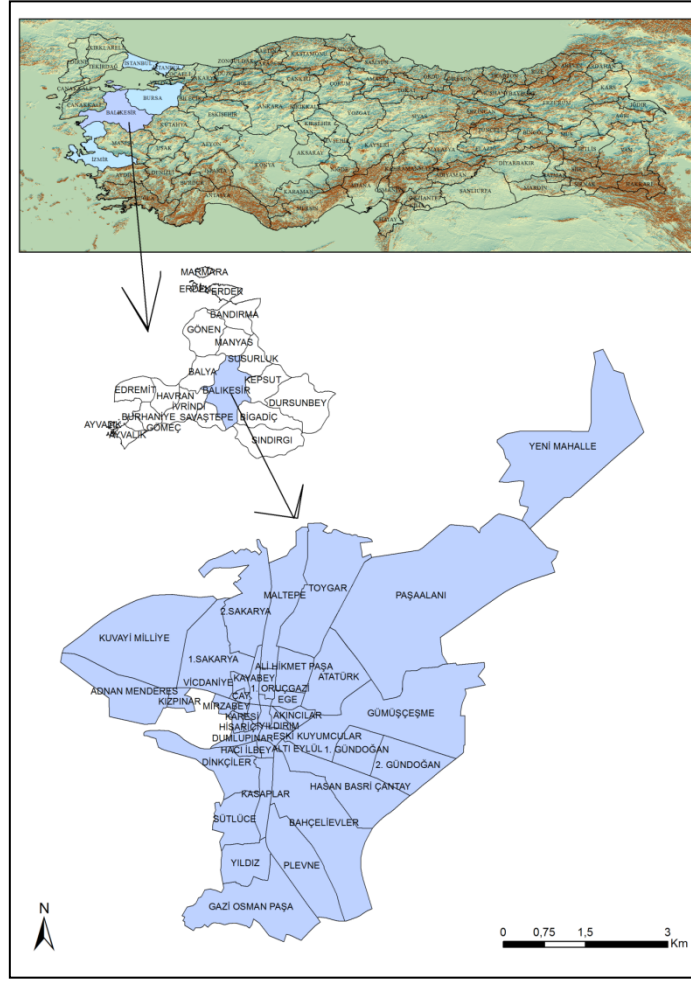
Şekil 1: Çalışma alanı lokasyon haritası