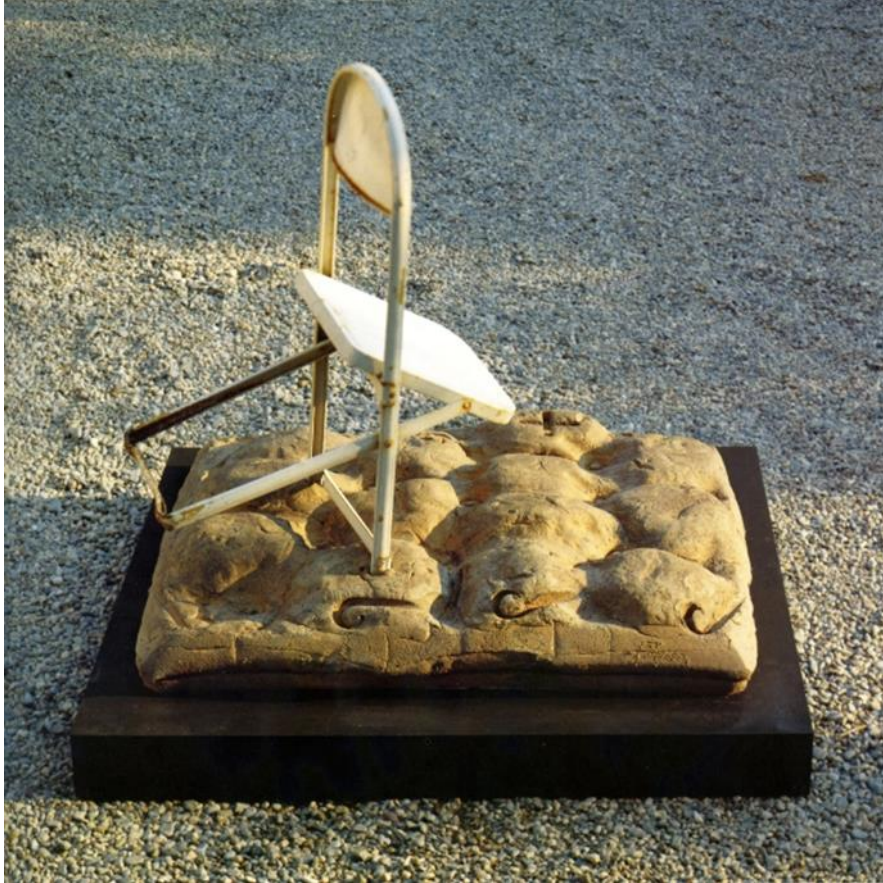
Görsel 4. Antoni Tàpies, Yatak ve Sandalye, 1991, Şamot ve metal sandalye, 94 x 104 x 90 cm

Her bir sanat eseri deyim yerindeyse sanatçının kendi kendisiyle karşılaşmasını, yani sanatçının malzemesi aracılığıyla duygularını yeniden yaşayıp, yeniden düzenlediği analitik bir seansı temsil eder. Her ne kadar sonuçta ortaya çıkacak şey sanat kılıfı altında kendini ifade etmekten, kendine ayna tutmaktan (yoksa kendi kendini taklit etmekten mi?) ibaret kalabilecek de olsa, atölye sanatçının kendi kendini tedavi etmeye çalıştığı bir kliniğe dönüşür (Kuspit, 2006:31).