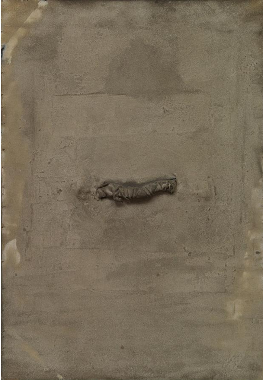
Görsel 5. Antoni Tàpies, Bez ve İp, 1967, Tuval üzerine monte edilmiş karton üzerine yağ ve kum, 106,7 x 74,9 cm (42 x 29 1/2 inç) (Visual 5. Antoni Tàpies, Rag and String, 1967, Oil and sand on cardboard mounted on canvas, 106.7 x 74.9 cm (42 x 29 1/2 inches))

Anselmo, doğanın ve doğa elemanlarının yalın görünülerinden yararlanıyor. Doğaya her ortam ve koşul içinde, yaklaşmasını ve uzaklaşmasını biliyor. Böylece, eylemleri sonucunda ortaya çıkan doğa detaylarıyla düzenlemelerini oluşturuyor (Eroğlu, 2001:10).