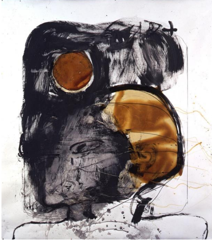
Görsel 3. Antoni Tàpies, Ay ve Kafa, 1994, Yapıştırılmış kağıt üzerinde boya ve vernik ,171.5 x 153 cm

Frotaj (Frottage) gerçeküstücü akım sanatçıları tarafından kullanılan bir teknik. Hafif girintili-çukurluklu, pürüzlü bir yüzey üzerine yerleştirilen bir kağıda kömür kalem sürterek kopya etmek anlamına gelir. Bu işlem sonucu nesnenin doku oluşumu kağıt üzerine geçirilir (Sözen & Tanyeli, 2001:87).