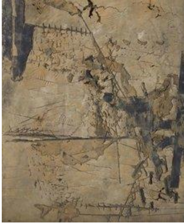
Görsel 7. Antoni Tàpies, 1961, karışık bir medya ve 260 x 195 cm.

(Visual 7. Antoni Tàpies, 1961, mixed media and 260 x 195 cm.)