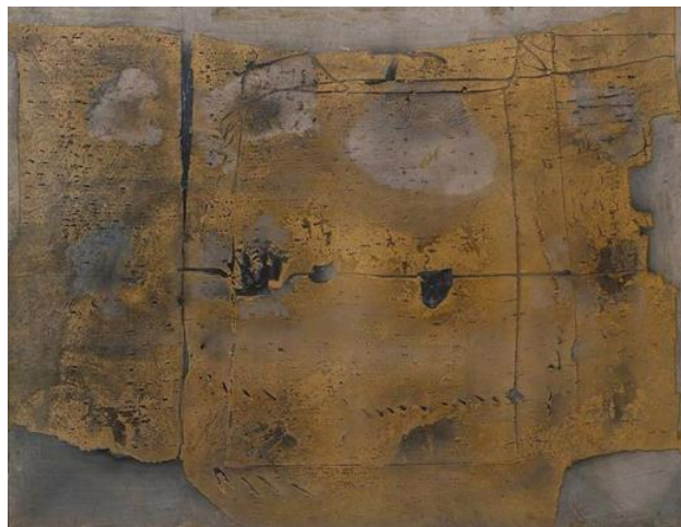
Görsel 1. Antoni Tàpies, Büyük Resim, 1958, Tuval üzerine mermer tozu ve kum ile yağ, 79 x 103 1/2 inç (200,7 x 262,9 cm)

Bazen bir müzisyen gibi çalışıyorum. Varyasyonlar yapıyorum, sadece bir formun yerinden oynamasıyla birbirinden ayırdedilebilen bir dizi tablo. Hemen hemen gözden kaçan bir değişikliğin, pek hafif bir renk farkının, nasıl tamamen ayrı duygusal durumlar ifade edebildiğini görmek insanı şaşırtıyor. Son derece zengin bir yapılabılır varyasyonlar, belli bir anda içgüdüsel olarak seçip tuvale yerleştirdiğimiz formlar dağarcığı var elimizde ve biz bunları, çalışmalarımız yürüdükçe, hemen her zaman farkında olmadan icra ediyoruz. Bu sonsuz zenginlik sanatın ne kadar analiz ve planlamaya gelmez olduğunu da kanıtlıyor. Sanatçının hiçbir kurala ihtiyacı yok; malzemenin üstüne adeta psişik bir madde püskürtüyor ki, esas olan da işte bu projeksiyon (Tàpies, 2014:46-47).