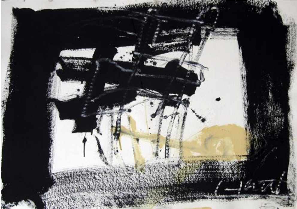
Görsel 2. Antoni Tàpies, Siyah Kare, 2000, Kağıt üzerine boya ve vernik, 73.5 x 103 cm

İmgelerin en temel malzemeleri, sesler, renkler, çizgiler, harfler, basit devinimler ya da eylemlerdir. İmge, bu parçaların kullanımı yoluyla yaratılan tasarım, kavram veya düşünce ile doğal nesnelere, görüngüler, şeyler arasındaki ilişkiyi, bağlantıyı zorunlu kılar. Ancak modernlikle birlikte bu denge, kavram ve şey arasında şekillenen imgeyi kuran nesnellüğün, yaratıldığı malzemenin, duyum verilerinin ifadesi lehine bozulur. Özellikle modern sanat işlerinde sözler seslere, yazılar harflere, resimler çizgi ve renklere, karmaşık edimler basit devinimlere dönüşmeye açık olurlar (Taburoğlu, 2013:19).