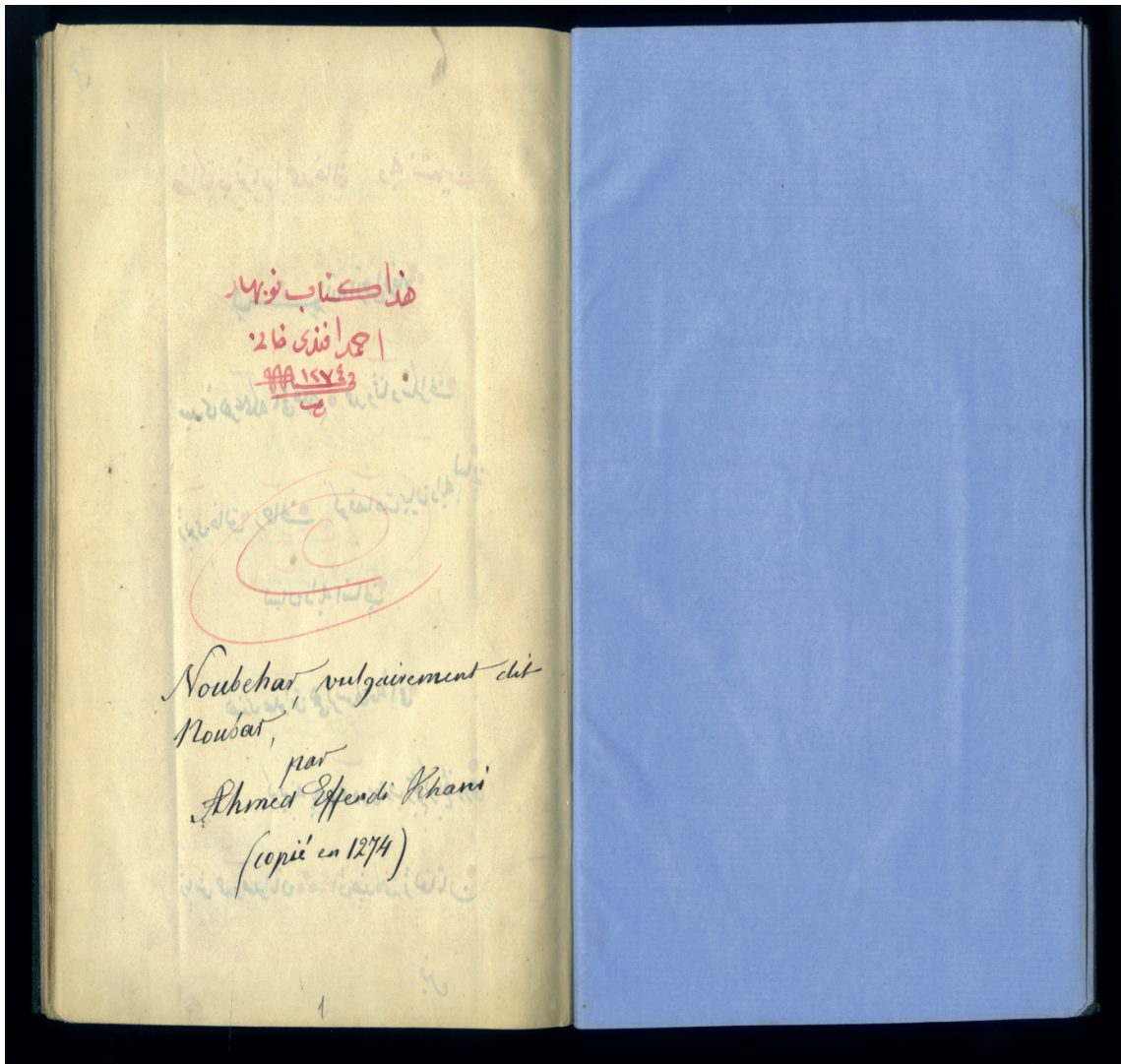
Pêvek 2: Ji destnivîsa Kurd 22 , wereqa (1b) ku bergê hundur e û navên berhemê bi Erebî û Fransî hatiye nivîsîn.