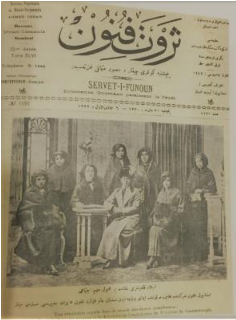
Şekil-3. "İslam Kadınları âleminde bir mühim içtimaî değişim" alt başlığıyla yayınlanan Servet-i Fünun kapağı. (sy. 1191, 9 Cemaziye'l-evvel 1332)

yılları arasında Yıldız'da sonradan inşa ettirdiği sarayından pek nadir çıkmış fakat görevlendirdiği saray fotoğrafçıları ile 35 bine yakın fotoğraf çektirerek, Osmanlı imparatorluk topraklarının tarihi, kültürel, ekonomik ve sanatsal yönü yüksek zenginliklerini kayıt altına aldırılmıştır. Fotoğraf sanatının bütün imkânlarından faydalanarak hazırladığı fotoğraf koleksiyonlarını British Museum ile Amerikan Kongre Kütüphanesi'ne göndermiştir. Ayrıca mahkûmların da fotoğraflarını çektirerek kayıt altına aldırması ile kurumların farklı amaçlar gütsede bir anlamda modernleşmesine katkıda bulunmuştur. Sultan II. Abdülhamid dönemi görsel temsiliyet alanlarında vurgulanmak istenen, gerek tabiiyeti altındaki Osmanlı halklarına gerekse de Avrupalı devletlere karşı meşruiyet bunalımının aşılması, yenilenmiş modern bir Osmanlı İmparatorluğu imgesini vurgulamak ve de zayıflayan Osmanlı imgesini güçlendirmektir.