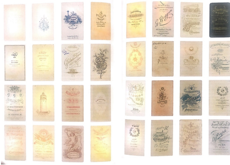
Şekil 1: On dokuzuncu yüzyıl İstanbul fotoğrafhanelerinden seçme stüdyo kartları. (Kaynak: Camera Ottomana, s.102-103.)

Fotoğrafın gerçekliği yeniden kurma amacına yönelik bir şekilde tekrar sunumu, o dönem içerisinde II. Abdülhamid'in armağan albümlerinden oluşan ciltlerde görülmektedir. Titizlikle seçilen fotoğrafların binlercesini bir araya getirerek hediye ettiği Amerikan Kongre Kütüphanesi ile British Library'e göndermesinin altında yatan ana gaye de bu fotoğrafların propaganda aracı olarak kullanılmasıdır. Fotoğrafın en etkin kullanıldığı yer ise hiç şüphesiz basın-yayın hareketleridir. Yukarıda tartışılan bu bağlam ile düşünerek, II. Abdülhamid ve yönetiminin meşruiyetine yöneltilen soru işaretlerini bertaraf edebilmek için gerek basında ve gerekse de sosyal hayat üzerinde nasıl bir yöntem izlenmiştir, sorusunun cevabı aranmaktadır. Çalışmanın temel sorusu olarak da, 'II. Abdülhamid dönemi meşruiyet probleminin basın-yayın yoluyla çözümüne yönelik bürokrasi ile birlikte yapılan karşı propagandanın bileşenleri nelerdir?' olarak belirlenmiştir.