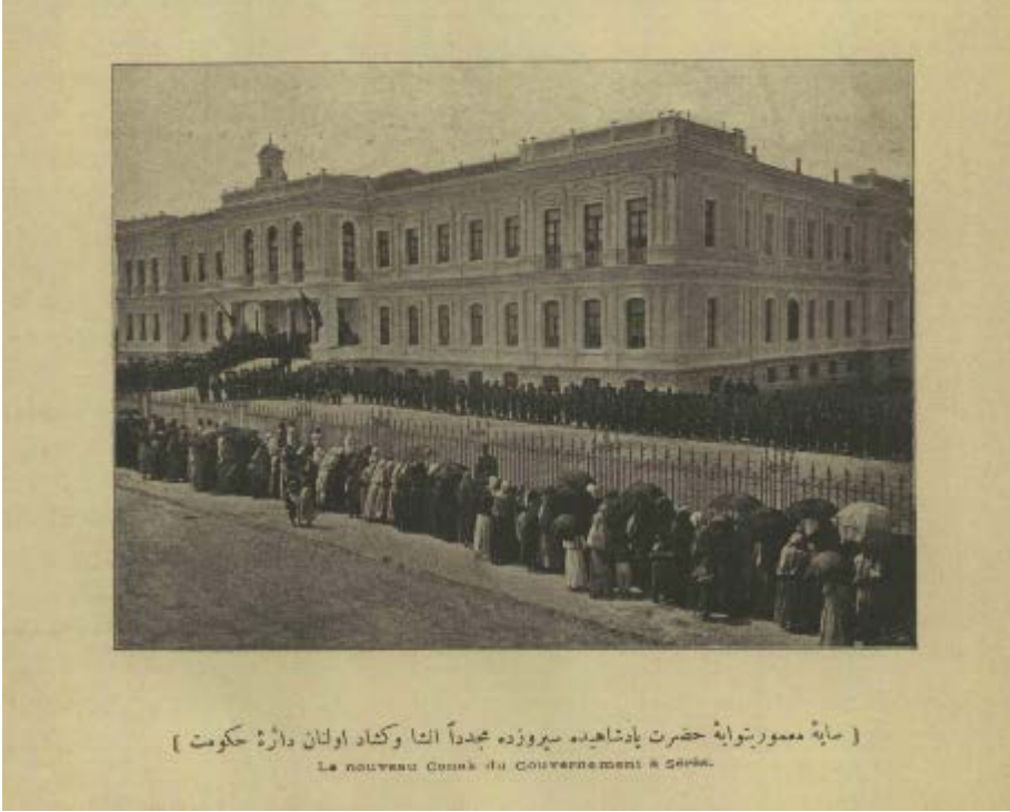
Şekil 5: Sâye-i ma'mûriyet-i Hazret-i Sultanîde Siroz'da (Serez) müceddeden inşa ve küşad olunan daire-i hükümet (Servet-i Fünûn, s. 401, 1314-11-05)