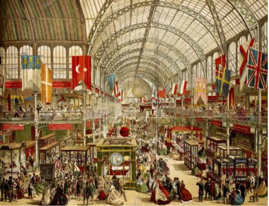
Şekil-7. Bağımsızlığını ilan eden Yunanistan'ın hemen yanına konumlandırılan Türk pavyonu. (British Library 1851)

çeken husus, serginin orta kısımlarına konumlandırılarak yanlarına serpiştirilen heykel/büstle tarihi simge değeri yüksek olanlardır. Fuarın tasarımında bağımsız ülkelerin sergi alanlarına yer verilmemiş olup ulusal mimari temsili ön plana çıkmamaktadır. İki kat olarak planlanan serginin tamamı camdan olmasıyla her iki katın tümünde ışığın yardımıyla görünürlüğün arttığını görüyoruz. 19. yüzyılın ortasında önemli bir katılımcı sayısına, 6 milyona ulaşan sergide aynı zamanda ciddi bir gelir de elde edilmiştir.