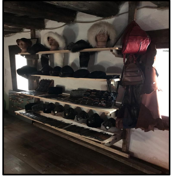
4: Safranbolu derici ustası İsmail SARITUNÇ ve deri işçiliğinden yapılan ürünler