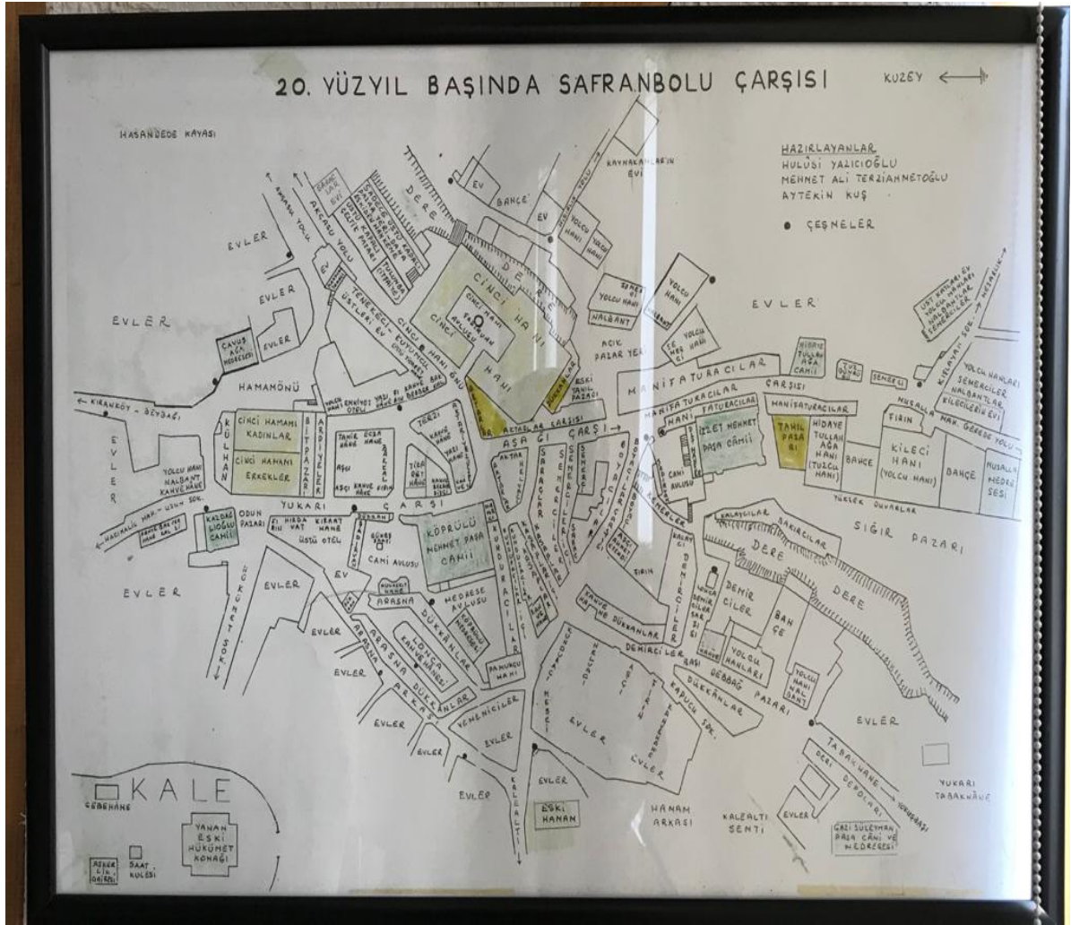
Görsel 1. 20. Yüzyıl başında Safranbolu Çarşısı

20. Yüzyıl başı, Safranbolu’da meslek dallarının çoğaldığı devirdir. O dönemde kayıt altına alınmış meslekler şunlardır; Yemencilik, Kavaflık, Deri Ticareti, Börekçilik, Pastırmacılık, Hallaçlık, Boyacılık, Sobacılık, Mücellitlik ( cilt yapan kişi ), Şekercilik, Manifaturacılık, Mühür Kazıcılığı, Debbağlık ( dericilik ), Kemercilik, Nalbantlık, Kebapçılık, Fırıncılık, Dokumacılık, Urgancılık, Kalaycılık, Bezirhane ( bezir, zeyrek, keten yağı üretimi ), Yapıcılık, Kerestecilik, Keten ve tahin imalatçılığı, Kunduracılık, Saraçlık, Kasaplık, Aşçılık, Katırcılık, Keçecilik, Demircilik, Hattatlık, Helvacılık, Çekicilik ( ağaç işleri, torna işi yapan kişi ) (Tunçözgür, 2012:43).