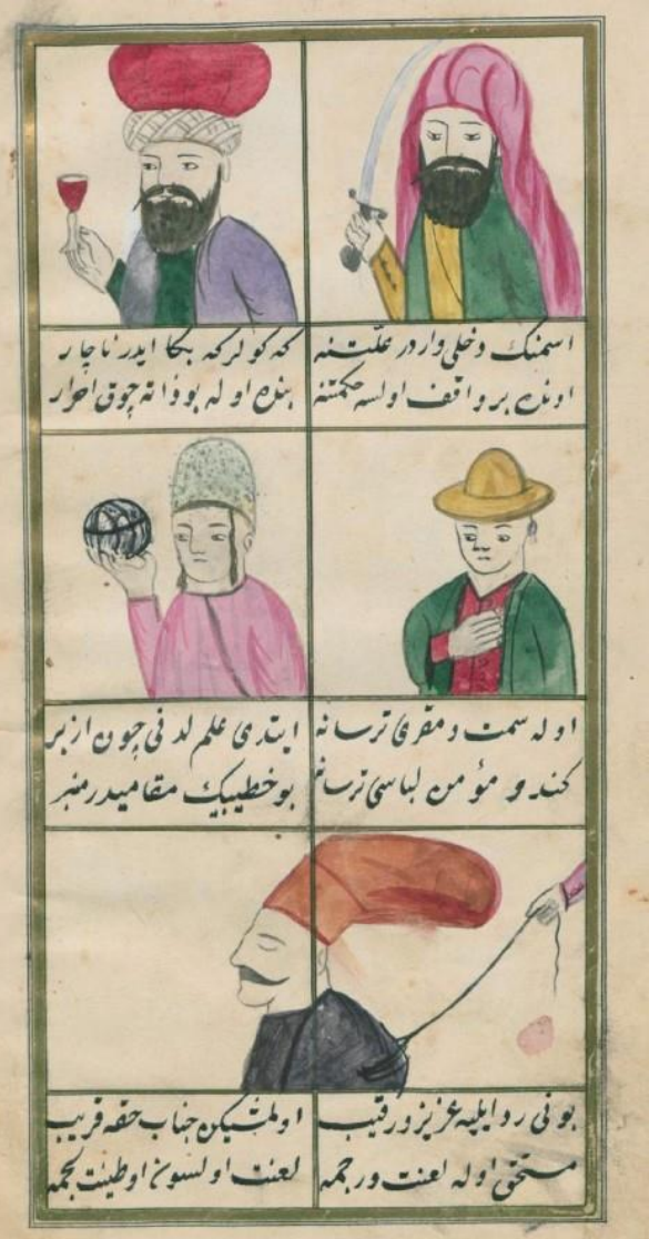
Ek-4 (Sıdkî, yz.: 14b)