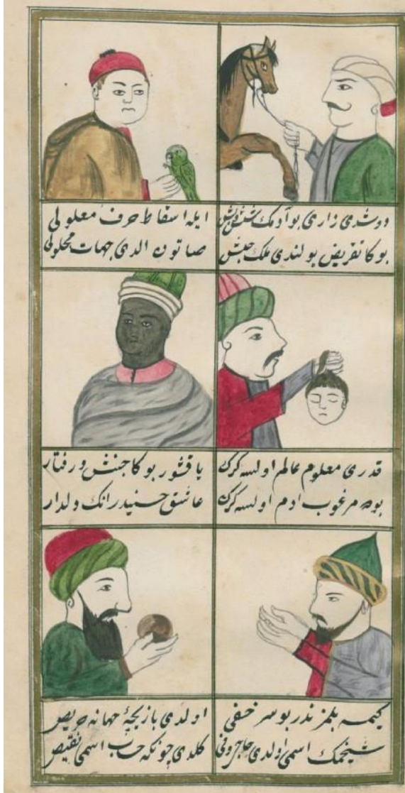
Ek-3 (Sıdkî, yz.: 14a)