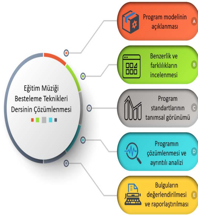
Şekil 1. Veri çözümlene sürecine ait analiz şeması