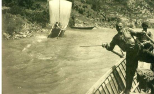
Ek 8. Çoruh Nehrinde Bir Kayıkçılar