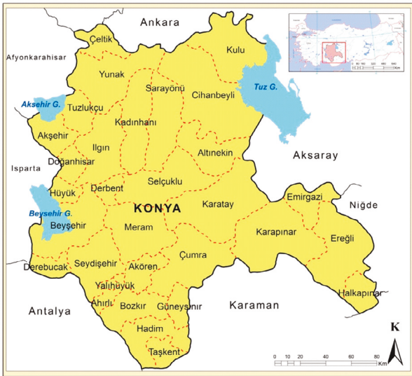
Şekil 2. Konya İli Lokasyon Haritası

Konya, yaklaşık 40 838 km 2 yüzölçümü ile Türkiye'nin en geniş ve 2 205 609 nüfusuyla en kalabalık yedinci ilidir. Ortalama yükseltisi 1016 m'dir. İdari olarak, kuzeyden Ankara, güneyden Mersin ve Karaman, doğudan Aksaray ve Niğde, batıdan da Eskişehir, Afyonkarahisar, Isparta ve Antalya illeri ile çevrelenmektedir (Şekil 2).