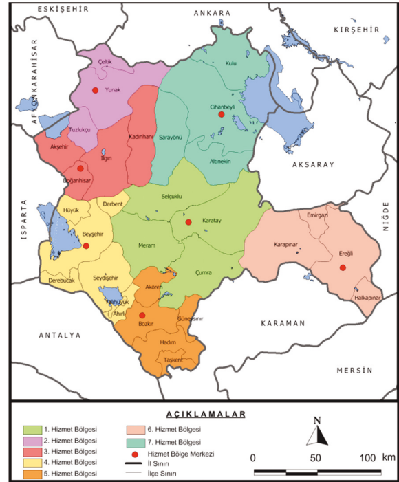
Şekil 5. Konya Büyükşehir Belediyesi Kırsal Hizmet Bölgeleri Haritası Figure 5. Map of Konya Metropolitan Municipality Rural Service Areas

Ayrıca Konya Büyükşehir Belediyesi Bilgi İşlem Dairesi Başkanlığı tarafından hizmete sunulan MUBİS (Muhtar Bilgi Sistemi) ile merkez ve kırsal mahallelerde 1188 mahalle muhtarlığına internet ve bilişim-donanım hizmeti sağlanmıştır. MUBİS sayesinde hiç bir prosedüre, dilekçeye ve yüz yüze görüşmeye gerek olmaksızın kırsal yerleşim birimlerinde yaşanan herhangi bir sıkıntı muhtarlar tarafından sisteme girilerek sorun belirtildiğinde en yakın bölge şefliği aracılığıyla en hızlı şekilde hizmet verilmektedir.