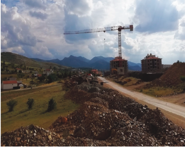
Şekil 6. 6360 Sayılı yasayla tarım arazilerinin imara açılması sonucu yapımına başlanan Sarayönü Kurşunlu mahallesi 79 konutluk TOKİ inşaat alanı Figure 6. Sarayönü Kurşunlu neighborhood, whose construction started as a result of the zoning of agricultural lands with the Law No. 6360, has a TOKİ construction area of 79 houses.