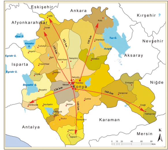
Şekil 3. Konya il merkezine göre en uzak ilçeleri örneklemi

İlçe merkezlerinin bile çok uzak mesafelerde olduğu il genelinde bir de bu ilçelere bağlı kırsal mahallelere ulaşmak ilk yıllar Konya Büyükşehir Belediyesi tarafından büyük bir problem olarak görülmüştür. Özellikle ilin güneyinde Akdeniz Bölgesi'nde yer alan Taşkent (1620 m.), Hadım (1530 m.), Çarşamba çayının iki yamacına kurulmuş Torosların yüksek kesimlerinin bulunduğu Bozkır (1125 m.) ve Batı Torosların Gembos Polyesi Havzası'nda bulunan Derebucak (1240 m.) ilçelerinin engebeli topoğrafik yapısından dolayı buraların kırsal mahallelerine hizmet götürme noktasında büyükşehir belediyesinin ciddi anlamda çözümler üretmesini gerektirmiştir.