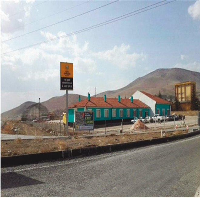
Şekil 4. Konya Büyükşehir Belediyesi Kırsal Hizmetler ve Koordinasyon Başkanlığı 2.Bölge Şefliği (Yunak) Figure 4. 2nd Region Chief of Konya Metropolitan Municipality Directorate of Rural Services and Coordination (Yunak)

Konya Büyükşehir Belediyesi İmar ve Şehircilik Dairesi Başkanlığı İmar ve Kent Estetiği Şube Müdürlüğü tarafından "6360 sayılı kanunla köyden mahalleye dönüşen ve imar planı bulunmayan" yerleşim sahiplerini bilgilendirmek için aşağıdaki soruların cevaplarından oluşan bir "Köyüm Mahalle Oldu" afişi hazırlanmıştır. Bu afişte, özellikle daha önce köy olup 6360 Sayılı Kanunun yürürlüğe girmesi ile birlikte mahalleye dönüşen yerlerde yaşayan vatandaşların söz konusu değişim karşısında sorun yaşamaları muhtemel konularda sorular sorarak onların olası sorunlarına çözüm üretmek amaçlanmıştır. Vatandaşların bu sorulara verilecek cevaplar ile yeni kanunun getirdiği değişikliklere uyumlarını sağlamak ve bu yolla memnuniyet düzeylerini arttırmak amaçlanmıştır (Usta vd., 2018). Hazırlanan afişte sorulan sorular şunlardır: