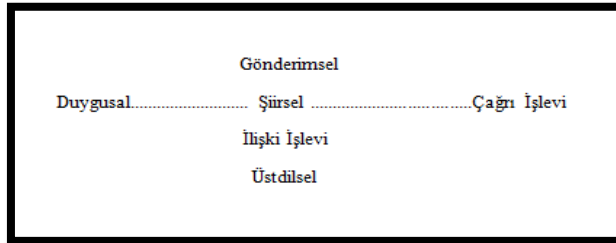
Şekil 2. Jakobson'na Göre Sözlü İletişimin Altı İşlevi