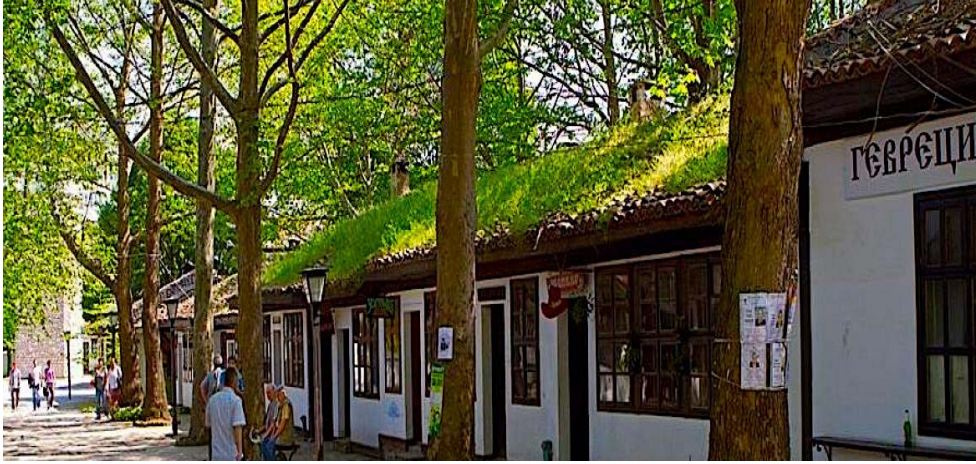
Dobriç'in "Stariya Grad" Adı Verilen "Eski Şehir" Merkezinden...

yaşayacaktır. Ünlü Osmanlı Şeyhülislamı, şair Ârif Hikmet Bey'in 1840'ta İstanbul'a gönderdiği ayrıntılı bir rapor, Pazarcık'ın içler acısı vahim durumunu gözler önüne sermektedir. Bu rapora göre kasabada sekiz cami, beş medrese, bir mescit ve bir hamam kalmıştır. Şehirde yenilik adına yapılan bir faaliyet olarak 1865 yılında Hacıoğlu Pazarcık Rüşdiyesi'nin açıldığını söylemek mümkündür.