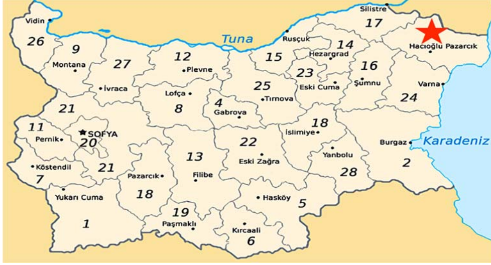
Dobriç'in Bulgaristan Haritasındaki Konumu

1411 yılında Osmanlı hâkimiyetine giren bölge, önce Silistre eyaletine, ardından da Niş ve Vidin eyaletlerinin birleştirilmesi ile 1864'te kurulan Yeni Tuna Vilayeti'ne dâhil edilir. XVI. yüzyıldan itibaren Dobruca bölgesinin iç kesimlerinde bir Osmanlı kasabası olarak gelişmeye başlayan Dobriç, bir zaman sonra cami ve mescitleri, tekke ve medreseleri ile bölgenin önemli Türk-İslam merkezlerinden biri hâline gelir. Hacıoğlupazarcığı, aynı zamanda meşhur Osmanlı hükümdarı Sultan III. Ahmet'in doğduğu şehirdir. Tarihte "Lale Devri" olarak bilinen dönemin sultanı, 23. Osmanlı Padişahı ve 102. İslam halifesi Sultan III. Ahmet, 30 Aralık 1673 tarihinde, IV. Mehmet'in Lehistan Seferi sırasında kışladığı bu şehirde dünyaya gelmiştir. Ve rivayetlere göre o gün Padişah çadırının kurulmuş olduğu yer daha sonra "Saray Mahallesi" olarak adlandırılmıştır. Babası Sultan IV. Mehmet, annesi Emetullah Râbia Gülnûş Sultan'dır. 1703 yılında Edirne'de tahta geçen ve 27 yıl Osmanlı tahtında kalan, iyi bir hattat olan, Necip mahlasıyla şiirler de yazan Sultan III. Ahmet, 1736 yılında İstanbul'da vefat etmiştir.