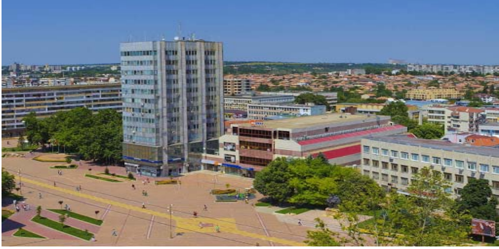
Dobriç'ten Bir Görünüm

Aynı yıllarda Pazarcık'ın, Türkçe ad taşıyan ve tamamı Türklerden oluşan toplam 14.000 nüfusa sahip 2876 haneden oluşan yetmiş altı köyü vardır. XVII. yüzyıla kadar şehirde Hristiyan nüfus görülmez. Hristiyanlar bu bölgeye çok daha sonraları gelip yerleşeceklerdir.