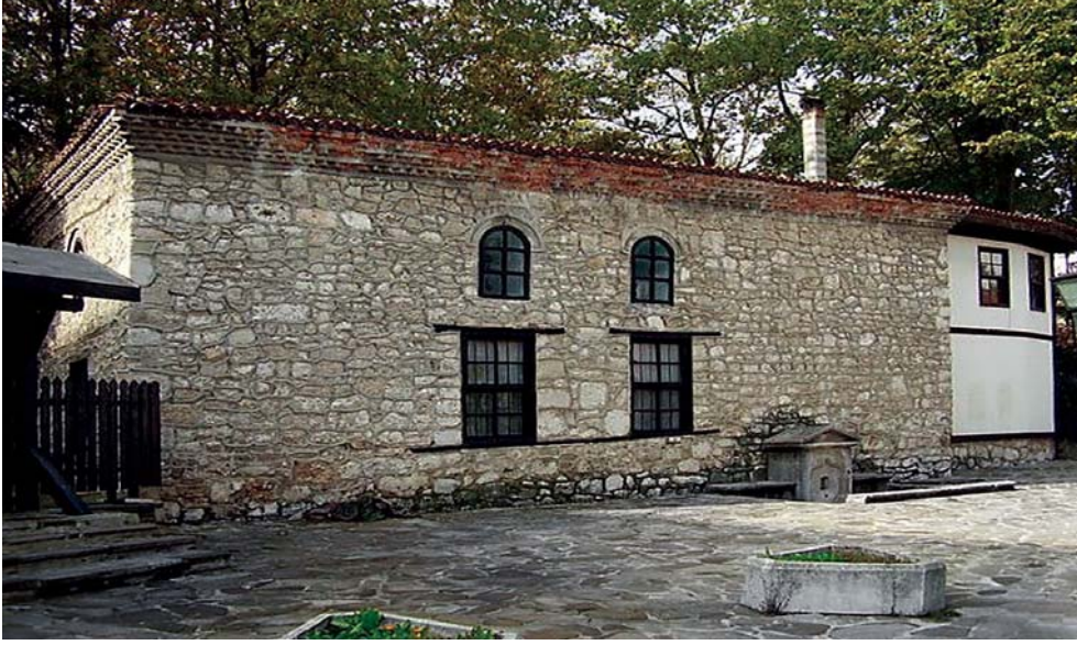
Dobriç'te Tekke Camii ve Çeşmesi

II. Dünya Savaşı'nın başında Rusya ve Almanya, Silistre ve Balçık ile beraber Pazarcık'ın da tekrar Bulgaristan'a verilmesi için Romanya'ya baskı yaparlar. Sonunda yapılan antlaşmalarla Romanya'da yaşayan Bulgarlarla, Pazarcık çevresinde yaşayan Rumenler yer değiştirirler. Pazarcık adı da komünist yönetim tarafından 1949 yılında bir Sovyet generalinin adına nispetle Tolbuhin olarak değiştirilir. Komünist yönetimin ilk işi şehrin ismini değiştirmek; ikinci işi ise şehirdeki Osmanlı mirası eserlerini birer birer ortadan kaldırmak olur! Böylece Pazarcık'ın Osmanlı şehir dokusu "modernleşme" adı altında hızla tahrip edilir ya da bir başka ifadeyle "Osmanlı şehir kimliği"nden uzaklaştırılır. Ve nihayet şehirde 1870'lerde yirmi civarındaki cami sayısı 1970'lerde ikiye düşer.