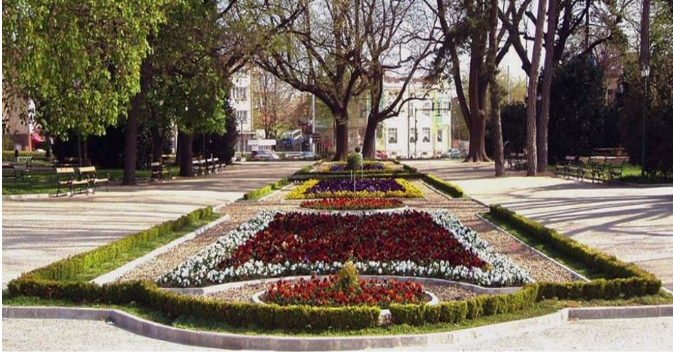
Dobriç Şehir Parkı

Kuzeyi ve güneyi ile Dobruca bölgesinin kültür tarihimiz açısından şüphesiz büyük önemi vardır. Şöyle ki bugün Romanya topraklarında kalan Kuzey Dobruca bölgesi Sarı Saltuk ismiyle hafızalarda yaşarken; genel bir isimlendirmeye Deliorman dediğimiz Güney Dobruca bölgesi de asırlardır meşhur sufi Şeyh Bedreddin'in hatıraları ile yaşatır kültürünü... Bektaşî kültürünün bu coğrafyalardaki etkin hareketliliğinin sebebi öncelikle bu iki büyük Türk dervişi olmalıdır. Ayrıca bu isimlere Silistre yakınlarında büyük bir türbesi bulunan Bektaşî Şeyhi Demir Baba'yı da eklemek lazımdır. Aynı şekilde, eski adı Tekke köyü olan, Varna ile Balçık arasındaki Obroçişte'de ( Obrochishte ) Bektaşî babası Akyazılı Sultan'ı bu isimlerden ayrı düşünmemek gerekir. Eski adı Sarıca olan Rositsa köyünde de 15 veya 16. yüzyıllarda bölgeye İran taraflarından geldiği söylenen bir Türkmen dervişinin, Saraca Şah Veli Baba'nın türbesi bulunmaktadır.