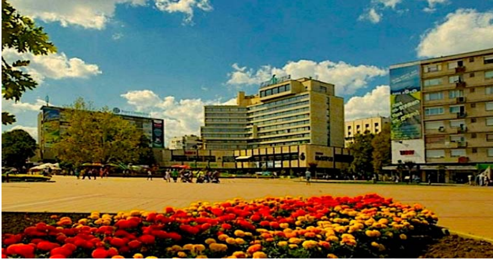
Dobriç Şehir Merkezi

Kaynaklarda Dobriç'in ilk sakinlerinin, fetihten sonra Anadolu'dan gelen yörükler olduğu görülür. Rivayetlere göre " Hacıoğlu Pazarı " adının da, buraya ilk yerleşen, aynı zamanda gezgin bir katran tüccarı olduğu söylenen Hacıoğlu Bakkal isimli bir zattan geldiği kuşaktan kuşağa anlatılır. Yine rivayetlere göre Hacıoğlu buraya geldiğinde kendisi için bir çiftlik ve yörede yaşayan insanlar için de bir cami inşa ettirmiştir. Diğer taraftan Osmanlı kayıt defterleri bir zamanlar bu yerleşim noktasında Varna kazasına bağlı olarak " Hacıoğlu " adını taşıyan küçük bir köyün bulunduğunu, hane reislerinin dokuzunun yerel askerî birliğin yedek askerleri olduğunu ve zamanla da buranın bir pazara dönüştüğünü belirtirler (Kiel, 2016).