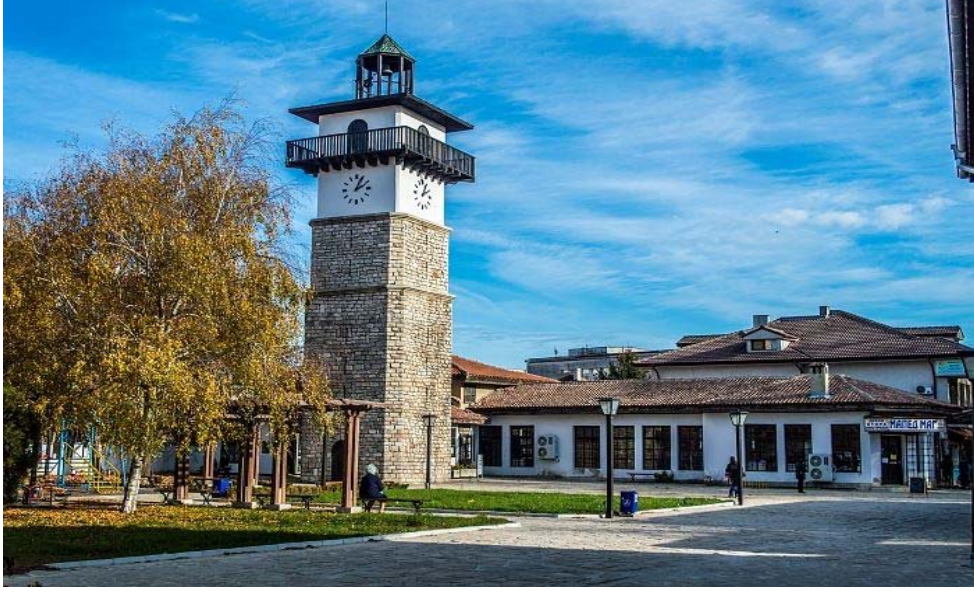
Saat Kulesi – Stariya Grad - Dobriç