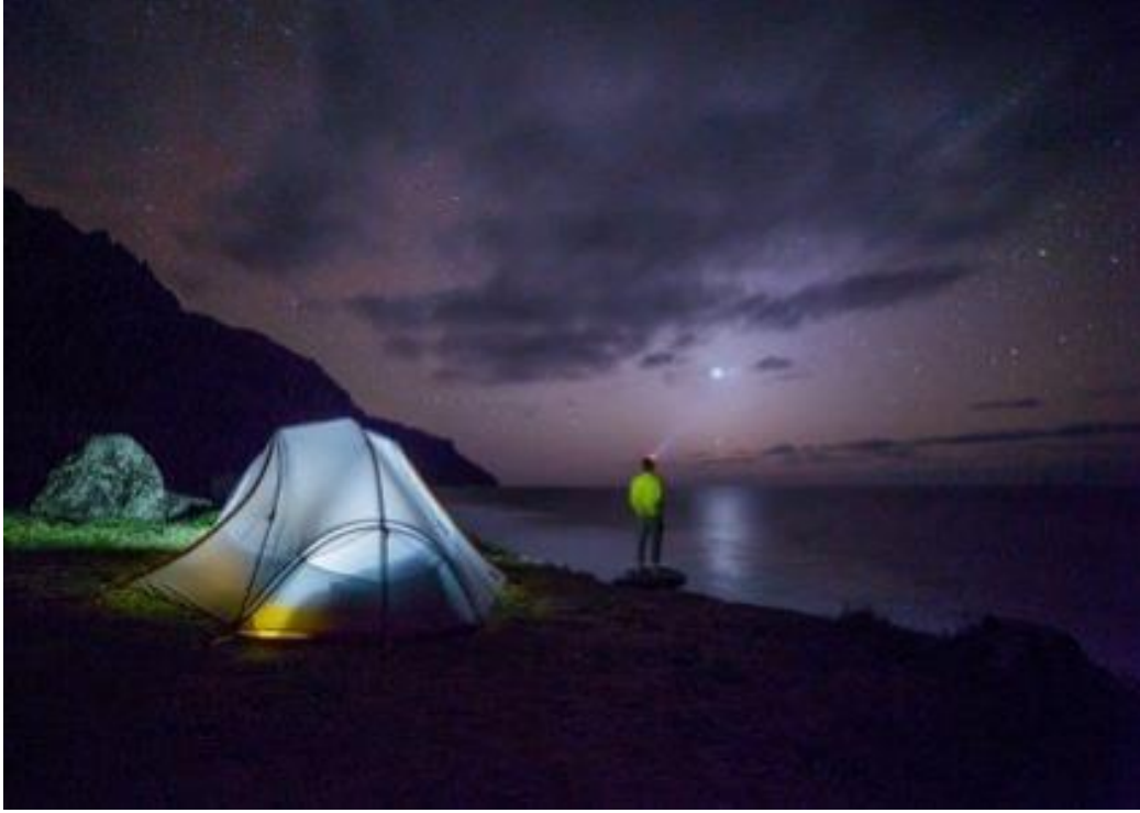
(Anonim 2020 a)