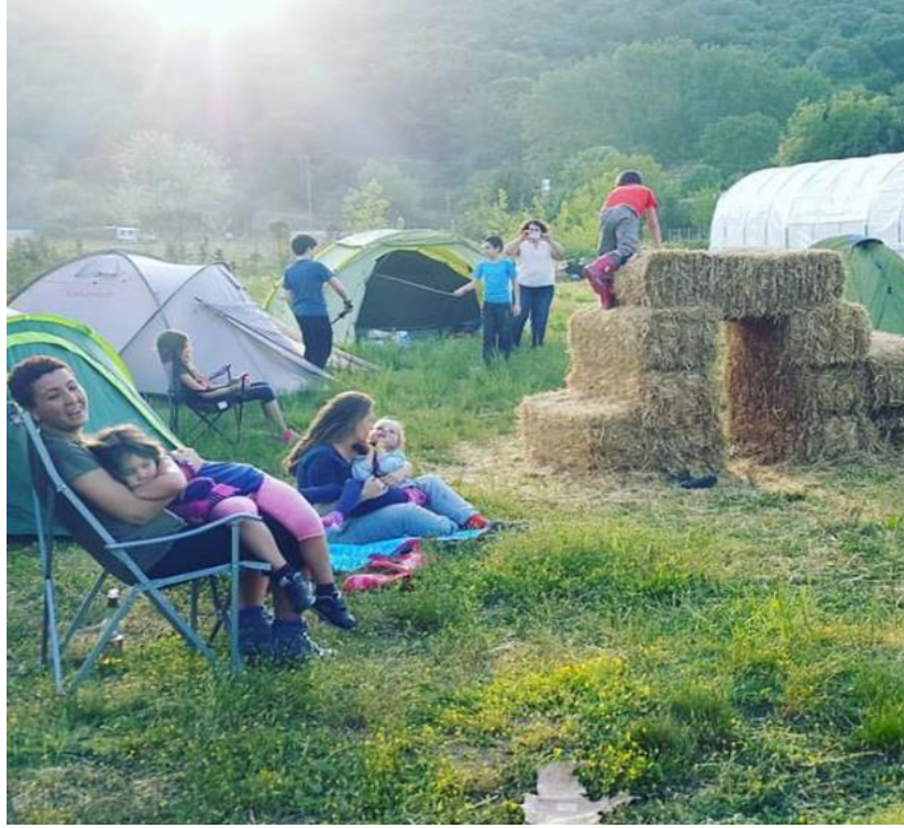
(Anonim 2020 c)

yerleşkede kurulu bu kamp alanları ekolojik aile-çocuk kampları olarak çocuklara ekoloji ve permakültür üzerine eğitim anlamında pek çok katkı sağlamaktadır. Farklı sayıda projelerde temalar oluşturulan kamp programları (permakamp günü, serbest gezen çocuklar, öğretmenimiz doğa, ekolojik çocuk kampları, keçi peyniri kardeşliği, yürüyen evle, Sen’de yap deneyim atölyeleri, gıda birliği, fermentest2020 fermantasyon festivali) doğa yürüyüşleri, permakültür uygulamaları, sebze bahçesi kurmayı öğrenme, hurda dönüştürme, ağaçlarla çocuk oyun alanı oluşturma gibi etkinlikleri kapsamaktadır. (PermaKamp, 2003).