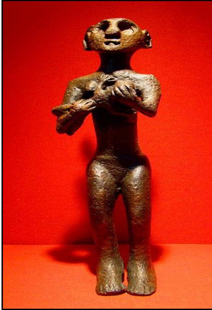
Şekil 3: Horoztepe'deki Kazılarda Bulunan Yaklaşık M.Ö. 3200 Yılına Ait Çocuğunu Emziren Ana Heykeli (Kaynak: Erbaa Belediyesi Arşivi).

ve Sümer, 1968: 2). Ancak bu konuda kanıtlanmış kesin bir bilgi mevcut değildir. Orta Karadeniz Bölümü'nün nüfus miktarı ve yerleşme sayısı açısından özellikle İlk Tunç Çağı (M.Ö. 3000-2000)'nda önemli bir canlılık yaşadığı öne sürülmektedir (Kıymet, 2004: 45). Bu dönemde bu yörenin canlı bir yöre olmasında Kalkolitik Çağ'dan beri özellikle gümüş ve bakır madenlerinin işletilmesi ve gelişmiş bir yöre olması üzerinde etkili olmuş olabilir (Kıymet, 2004: 33).