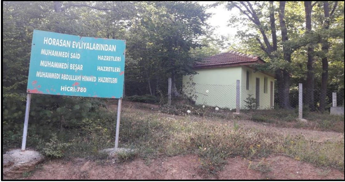
Şekil 6. Yörede Türk Derviş ve Askerlere Ait Koçak Köyü'ndeki Tekke ve Mezarlara Bir Örnek (27.07.2017).