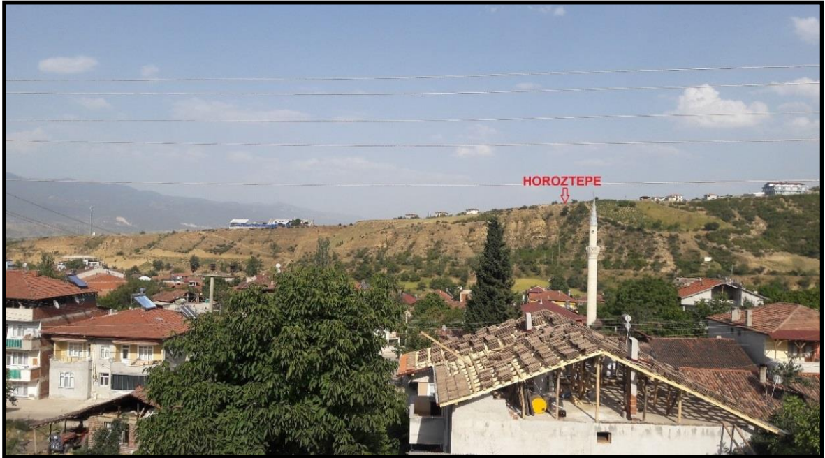
Şekil 2: Yöredeki En Eski Yerleşim Alanı Olan Horoztepe Höyüğü'nün Yeri (05/07/2017).

Yapılan kazılar sonucu elde edilen buluntular özellikle İlk Tunç Çağı'ndan izler taşımaktadır. Horoztepe, Erbaa şehrinin kuş uçuşu yaklaşık 1 km güneyinde, İmbat Deresi'nin yakınında bulunan bir höyüktür (Kökten, vd.,'den aktaran Uyanık, 2014) 4 , (Şekil 2). Höyüğün yaklaşık 400 m güneydoğusunda ise Horoztepe Mezarlığı bulunmaktadır (Uyanık, 2014: 102). Yörede ilk çalışmaları başlatan İ. KÖKTEN (1944) olup (Uyanık, 2014: 102), daha sonra 1957 yılında T. ÖZGÜÇ ve M. AKOK kısa süreli bir kazı yapmışlardır (Uyanık, 2014: 103). Yapılan kazılarda özellikle İlk Tunç Çağı (M.Ö. 3000-2000) ile M.Ö. II. bin yılına ait seramikler bulunmuştur (Uyanık, 2014: 102). Bugün bu buluntular Ankara Anadolu Medeniyetleri Müzesi'nde sergilenmektedir (Uyanık, 2014: 102), (Şekil 3).