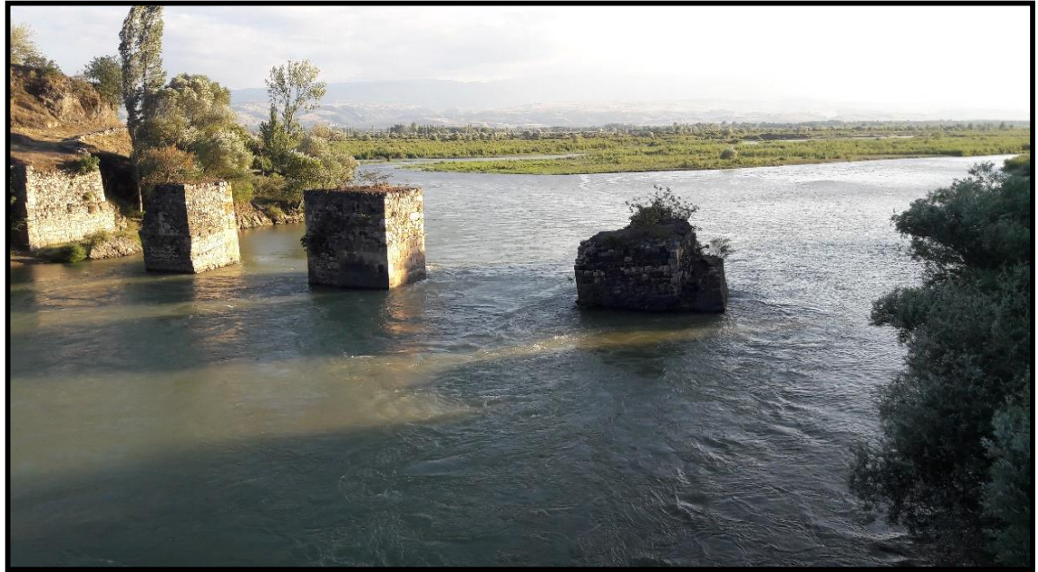
Şekil 5: Eskiçağ'dan Cumhuriyet Dönemi'ne Kadar Yöredeki En Önemli Ulaşım Hattı. Olan Sonisa-Taşova-Erek Arasındaki Uluyol Üzerindeki Roma-Selçuklu Yapımı Tarihi Köprü Kalıntısı (28/06/2016).

Daha sonra Erbaa, önce Roma (M.Ö. 2. yy.-M.S. 4. yy.), sonra ise Bizans (4-11. yy. arası) egemenliğine girmiştir. Romalılarla Pontoslular arasındaki savaşlar neticesinde M.Ö. 66'da Pontos Krallığı yıkılmıştır (Yurt Ans. X "Tokat Maddesi", 1982-1983-1984, s.7093).