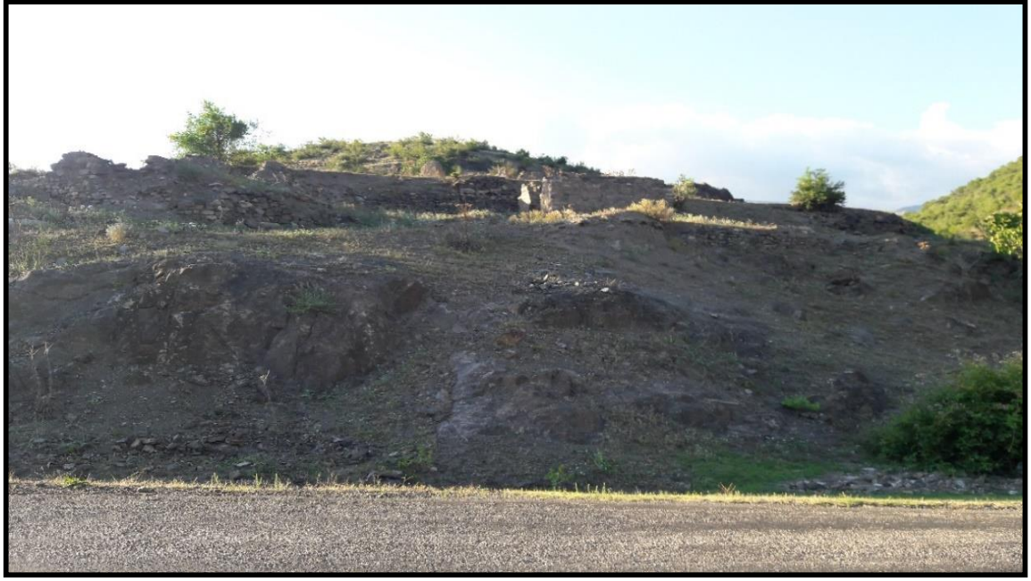
Şekil 4: Eupatoria Denilen Bölgede Kral Mitridates Tarafından Yapıtırıldığı Tahmin Edilen Tarihi Kale Kalıntısı (28/07/2016).