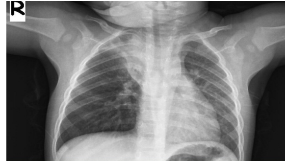
Resim 1. Sağ akciğerde üst lob atelektazisi ve alt loblarda havalanma artışı, mediastende sola itilme izlenmekte.

soygeçmişinde özellik yoktu. Fizik muayenesinde genel durumu iyi, biliç açık, etrafla ilgili, aksiller ateşi 36,6 C, tansiyonu 100/65 mmHg, nabız 110/dk, solunum hızı 30/dk idi. Tam kan sayımı ve kan biyokimyasında patolojik özellik yoktu. Sağ akciğerde solunum seslerinde azalma ve ronküs dışında bulgu saptanmadı. Yabancı cisim aspirasyonu ön tanısıyla çekilen akciğer grafisinde sağ akciğerde üst lob atelektazisi, havalanma artışı ve mediastende sola itilme görüldü (Resim 1).