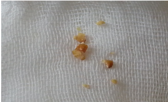
Resim 2: Bronkoskopide çıkarılan leblebi parçaları

Yabancı cisim aspire eden çocuklar, erken dönemde bir sağlık kurumuna hemen gidebildikleri gibi, yakınmaların hafif ya da hiç olmaması durumunda geç dönemde ortaya çıkan komplikasyonlarla da başvurabilirler. Tanıda gecikme mortalite ve morbidite oranlarındaki artışa neden olur. İçeride kalan yabancı cisim, pulmoner rezeksiyon gerektiren kronik akciğer hasarına yol açabilir (8). Aspire edilen yabancı cismin yapısına göre klinik bulgular farklılık gösterir. Sıklıkla organik kaynaklı olmakla beraber çok değişik maddelerde aspire edilmektedir (7, 8).