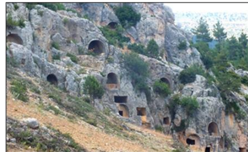
Şekil 12. Philadephia Ören Yeri

bir faktör için güçlü yönler, zayıf yönler, fırsatlar ve tehditler belirlenmiştir. Fırsatlara ve güçlü yönlerin etkili olabilmesi için en önemli faktör olarak eksiklikleri giderecek ve tehditleri en aza indirecek stratejilerin geliştirilmesine vurgu yapması bu modelin en olumlu yönüdür.