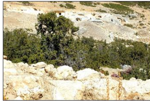
Şekil 11. Sbide Antik Kenti