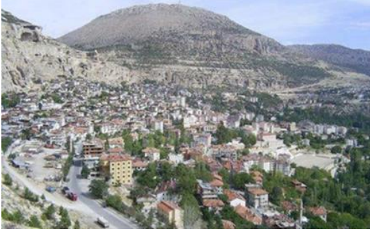
Şekil 2. Ermenek Turkuaz Gölü öncesi genel görünümü (URL-3)