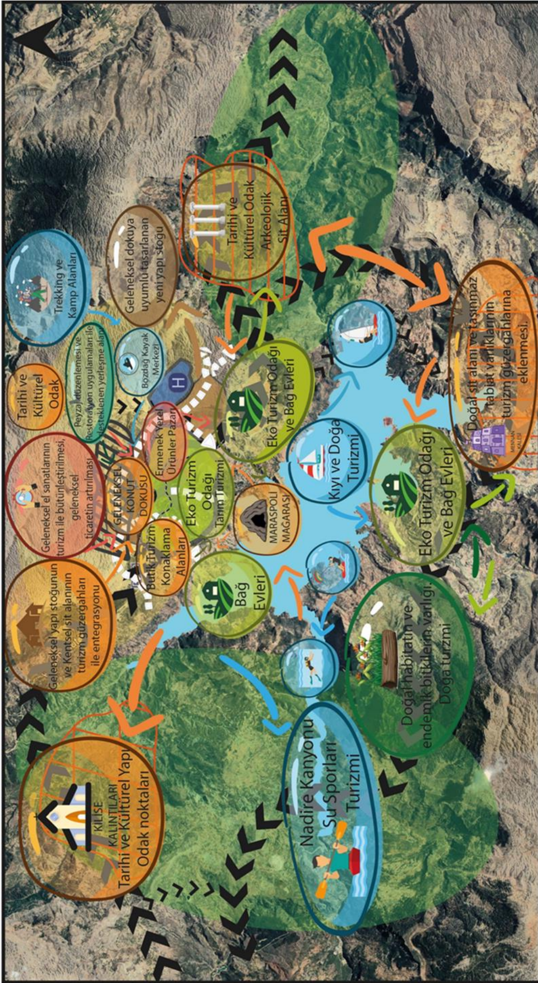
Şekil 14. Ermenek kırsal turizm strateji şeması