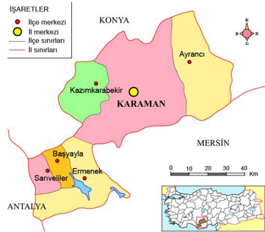
Şekil 1. Ermenek'in konumu (URL-1)

Ermenek ilçesi Toros Dağları arasındaki vadilere sıkışmış yeşilliklerle bütünleşmiş, eğimli arazi ile bütünlük gösteren ilginç sürprizler sunan geleneksel bir kent dokusuna sahiptir (Şekil 1,2,3).