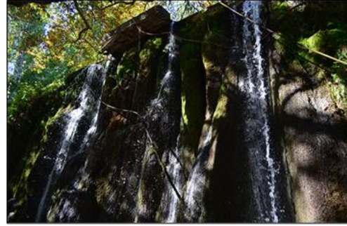
Şekil 10. Zeyve Ören Yeri