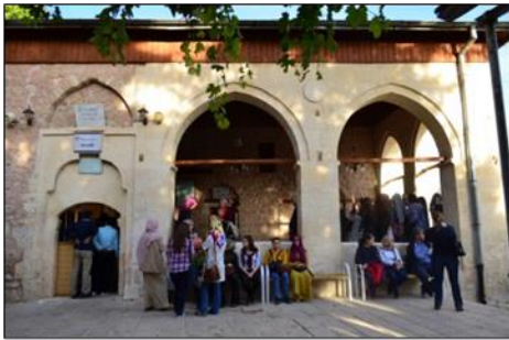
Şekil 8. Ulu Cami