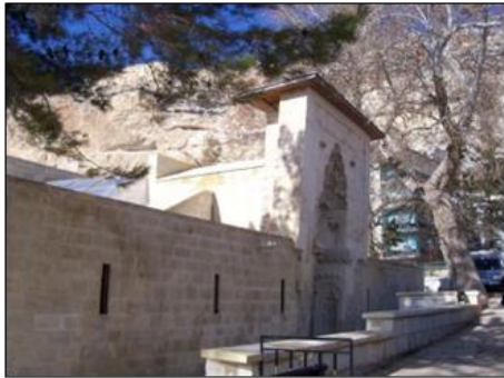
Şekil 7. Tol Medrese (Yazarlara ait, 2019)

Geçmişin izlerini taşıyan kırsal kültürün mimarlıkla buluşması anlamına gelen Ermenek Bağ evleri, yörenin kültürünü, sosyal ilişkilerini, alışkanlıklarını, beğenilerini, inançları ve yaşam standartlarını yansıtmaları bakımından kendi özgün kimlikleri ile önemli birer belge niteliği taşımaktadır (Yaldız, 2017). Ermenek geleneksel konut dokusu ve özellikle bağ evleri, günümüzde doğal çevreleri, mimari kimlikleri ve özgün yapıları ile dikkat çekmekte; kentten uzaklaşmak, dinlenmek, gezmek ve görmek için tercih edilmektedir.