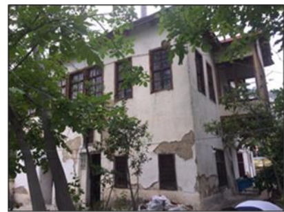
Şekil 6. Ermenek'ten bağ evi örnekleri (Yazarlara ait,2019)

Yörede, yerli halkın kullanımında olan ve yerleşimin kendine özgü kırsal mimarisi ile biçimlenmiş geleneksel konutlar ve bağ evlerinin (Şekil 6) dışında, Tol Medrese (Şekil 7), Ulucami (Şekil 8), Meydan Cami, yakın çevrede yer alan antik yerleşimler ve ören yerleri (İkizini, Kilise Önü, kaya mezarları, Maraspoli Mağarası (Şekil 9), Zeyve (Şekil 10), Turkuaz