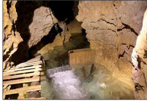
Şekil 9. Maraspoli Mağarası (URL-4)

Ermenek'in turizm potansiyelinin belirlenebilmesi için; doğal-fiziki, ekonomik ve sosyo-kültürel faktörlere ilişkin SWOT matrisi Tablo 1 de yer almaktadır. SWOT matrisinde her