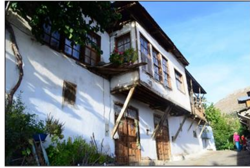
Şekil 5. Geleneksel konut örneği

Turizm, doğru kullanıldığında kültürel çeşitliliğin ve özgünlüğün korunması için bir araçtır. Çünkü yerel kimliğe ve özgünlüğe dayalı olup, yerel kalkınmayı ve yerel halkın yaşam kalitesini artırmaktadır (Kaya, 2016). Bu bağlamda ele alındığında Ermenek'in özgün