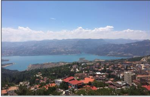
Şekil 3. Ermenek Turkuaz Gölü sonrası genel görünümü