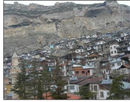
Şekil 4. Ermenek geleneksel konut dokusu