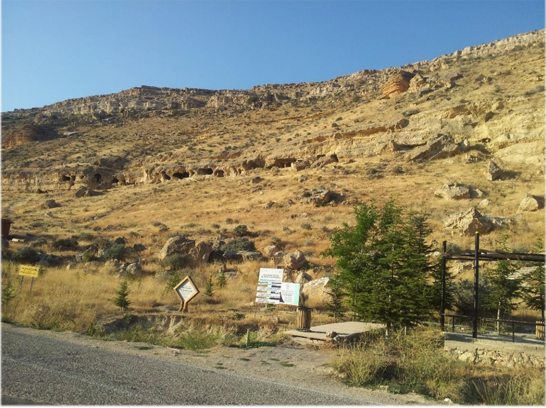
Ek 4 - Ek 5. İ kısım oyuklar (Bu fotoęraflar: Dr. Öęt. Üy. Hatice Gül KÜÜKBEZCİ)