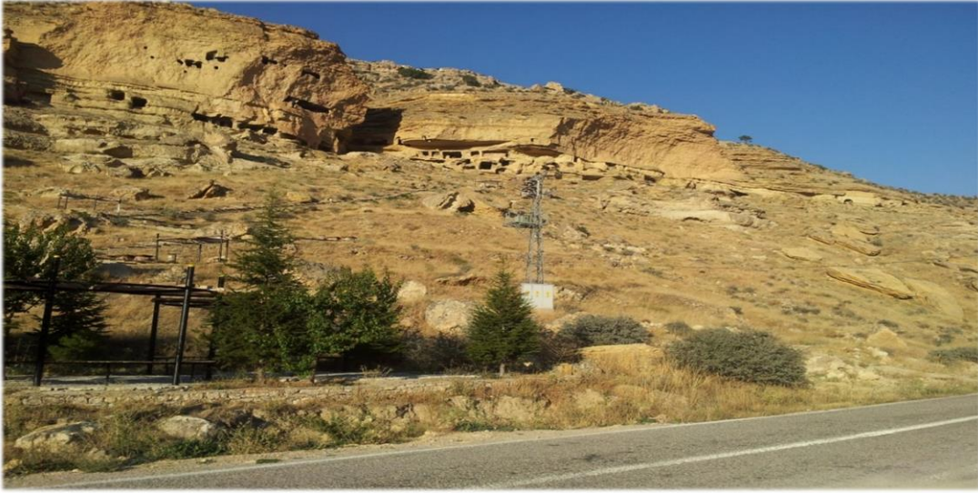
Ek 2. Manazan'ın karşı vadisi