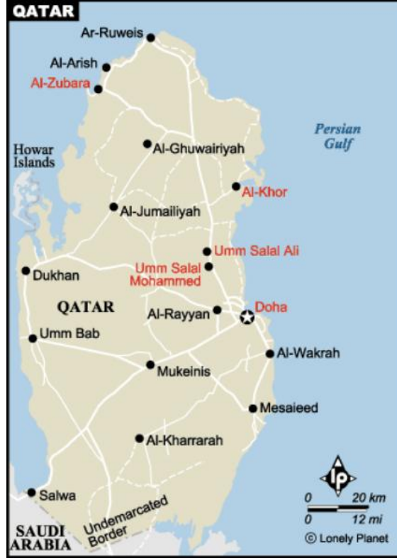
Harita 2. Katar Emirliği