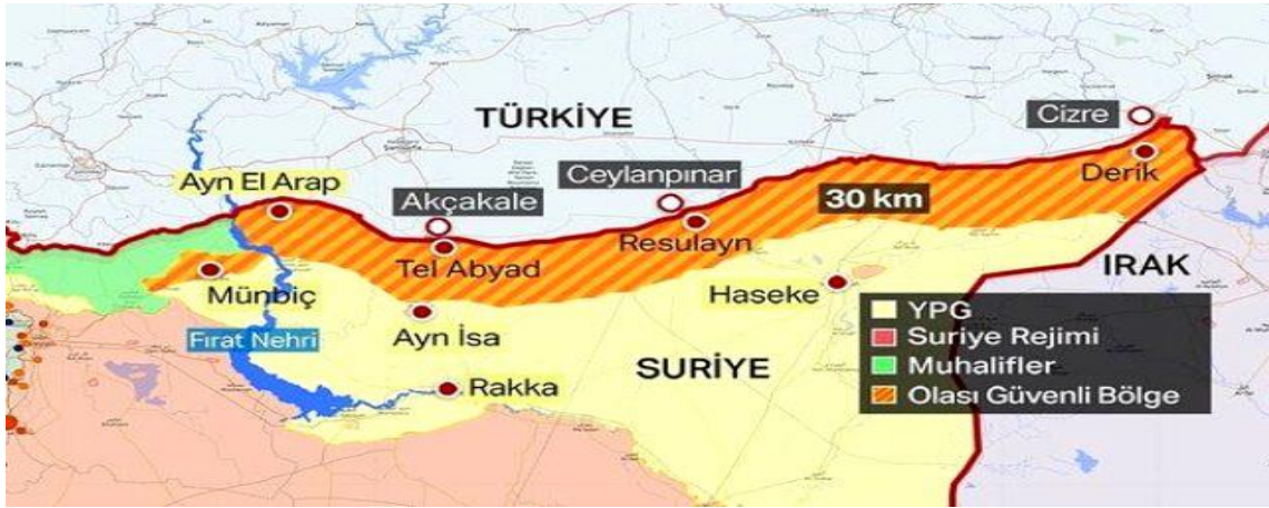
Şekil 4: Barış Pınarı Harekâtı İle Hedeflenen Olası Güvenli Bölge (Haberler, 2019).

Türkiye BPH ile Fırat'ın doğusunda kalan bölgede sınır hattından itibaren yaklaşık 30-32 km derinliğe sahip güvenli bir alan oluşturmak istemiştir. PYD/YPG-PKK terör örgütünün hüküm sürdüğü sınır bölgesinin bu alan teröristlerden temizlenerek güvenli hale getirilmek, terör devleti projesine bir darbe daha vurmak ve Türkiye'deki Suriyeli mültecileri bu güvenli alana yerleştirmek amaçlanan hedefler arasındadır.