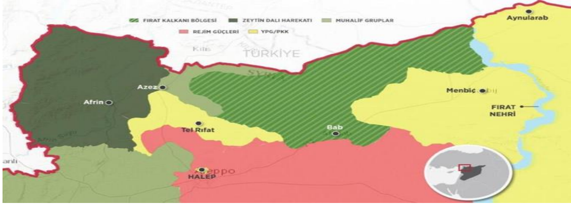
Şekil 3: ZDH Sonucu Suriye'nin Kuzeyini Gösteren Harita (Dünya, 2018).

militanların kontrolündeki Halep'in Nubul ve Zehra bölgelerine kaçmışlardır. Bu esnada teröristler kendilerine verilen çok sayıda araç, silah ve mühimmatı da bölgede bırakmıştır (Özçelik ve Acun, 2018: 29-30).