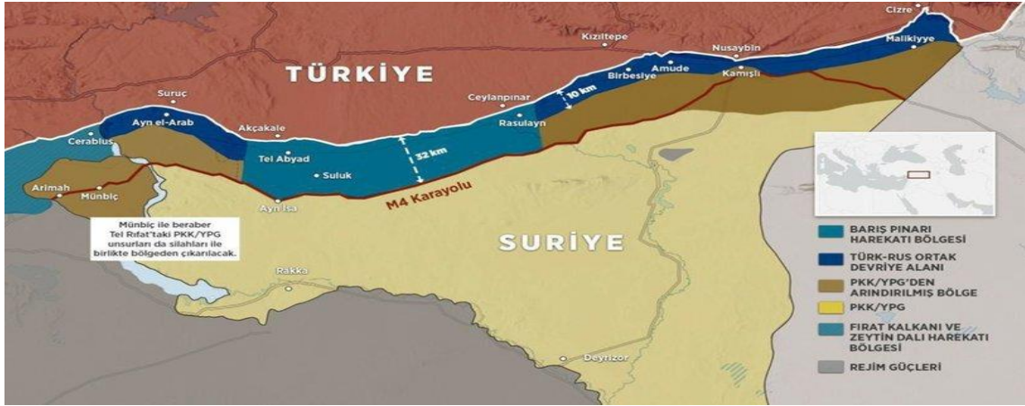
Şekil 5: Barış Pınarı Harekâtı Sonucu Oluşan Harita (Haberturk, 2019).

Fırat'ın doğusunda kalan PYD/YPG-PKK terör örgütü elindeki 444 km uzunluk ve 32 km derinlikteki tüm alana düzenlenmesi planlanan harekât bu anlaşmalar neticesinde Tel Abyad- Resulayn arasındaki 120 km uzunlukta ve M4 otoyolunun da dâhil olduğu yaklaşık 32 km derinlikteki alanın kontrol edilmesi ile son bulmuştur.