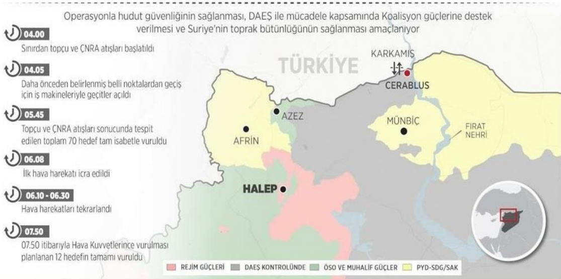
Şekil 1: FKH Öncesi Suriye'de Fırat'ın Batısını Gösteren Harita (Yeni Şafak, 2017).

Azez-Cerablus arasındaki yaklaşık 100 km uzunluğundaki sınır hattını elinde bulunduran DEAŞ terör örgütünün özellikle 2016 yılının başından itibaren Kilis başta olmak üzere Türkiye'nin sınır illerine roket ve füzelerle saldırması ile Türkiye'de gerçekleştirdiği eylemler sonucunda çok sayıda Türkiye Cumhuriyeti vatandaşı ve yabancı hayatını kaybetmiş ve yaralanmıştır. DEAŞ'ın Türkiye'de gerçekleştirdiği saldırılar ve sonuçları tablo1'de gösterilmiştir (Türkiye Cumhuriyeti İçişleri Bakanlığı, 2017: 34-45).