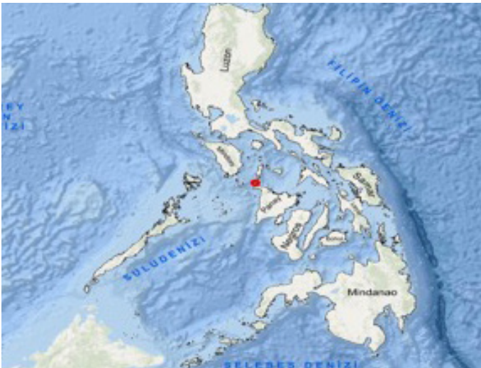
Harita 2: Boracay Adası Lokasyon Haritası

Boracay adasında nemli tropikal iklim egemendir ve yıllık ortalama sıcaklık değerleri 26-28 °C arasında değişmektedir. Yaz aylarında sıcaklık ortalamaları 28-30 °C arasında oysa kış aylarında sıcaklık ortalamaları 25-27 °C arasında değişmektedir. Boracay adasında bütün yıl boyunca aylık gündüz sıcaklık ortalamaları 32 ile 36 °C arasında değişmektedir (Tablo 2). Hem günlük sıcaklık ortalamaları arasında hem de yıl içindeki aylık sıcaklık ortalamaları arasında çok küçük sıcaklık farkları görülmektedir. Yıl boyunca ada kıyılarındaki deniz suyu sıcaklığı da pek değişmemekte ve 12 ay boyunca 26 ile 28 °C arasında kalmaktadır. Bir başka deyişle yıl boyunca deniz suyu sıcaklığı 25 °C'nin altına düşmediğinden dolayı Boracay 12 ay boyunca deniz turizmüne müsait ortam sunmaktadır (Tablo 2).