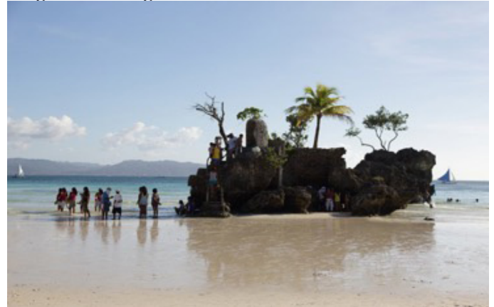
Foto 3: Boracay kıyılarında yer alan ünlü "Timsah Adası" (Crocodile Island)

"Yarasa Mağarası", "Willy's Rock Kayalığı", "Kelebekler Bahçesi", "Friday's Rock Kayalığı" ve "Timsah Adası" Boracay adasının diğer ilgi çeken doğal turizm merkezleridir. Boracay adasının kuzeydoğu köşesinde yer alan "Yarasa Mağarası" (Bat Cave) adanın en ilginç doğal turizm çekiciliklerin başında gelir. Sarkıt ve diktleriyle meşhur olan "Yarasa Mağarası" yüzlerce yarasa barındırır, içinde ilginç bir doğal göle sahiptir ve her yıl binlerce turist tarafından ziyaret edilir. Yarasa Mağarasını ziyaret edenler hemen yakınında yer alan Crystal Mağarasını da görebilirler.