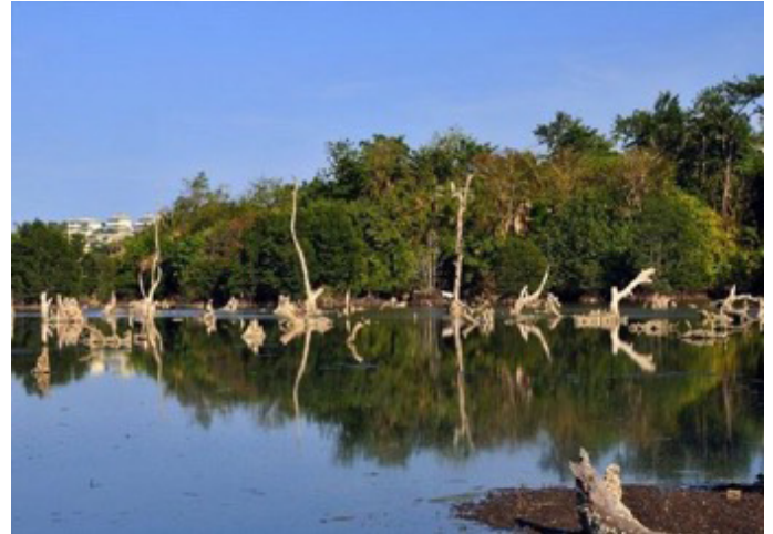
Foto 1: Boracay adası'nda yer alan ünlü "Ölüm Ormanı" (Dead Forest)

yaşamak isteyenlerin oluşturdukları birinci grup, en kalabalık bölümü oluşturmaktadır. Egzotik deniz tatil deneyimi veya macera - adrenalin arayışlarında olanlar ikinci grubu oluştururlar. Filipin kadınlarıyla evlenip aile kuranlar ve Filipinlerde yerleşip sürekli yaşayanlar üçüncü grubu oluştururlar. Kısa süreli huzurlu, ekonomik ve romantik tropikal tatil arayışlarında olanlar dördüncü grubu oluştururlar. Boracay'daki huzurlu ortamdan ve adanın doğal güzelliklerinden etkilenerek buraya yatırım yapanlar, zaman içinde de bar, restoran veya otel sahibi olup zengin iş adamı grubuna girmeyi başaranlar da beşinci grubu oluştururlar. Zengin Almanlar, İtalyanlar, İsveçliler, Hollandalılar, Fransızlar ve İsviçreliler bu adayı istila eden ilk yabancılarıdır. Daha sonraki yıllarda bunlara Avustralyalılar, Ruslar, Araplar, Japonlar, Güney Koreliler ve Çinliler de katılmışlardır. Bugün adada yaklaşık 60 farklı ülkeden insan yaşamaktadır ve kozmopolit kültürel görünüm ile heterojen demografi yapı bu şirin adada egemenliğini çoktan sağlamıştır.