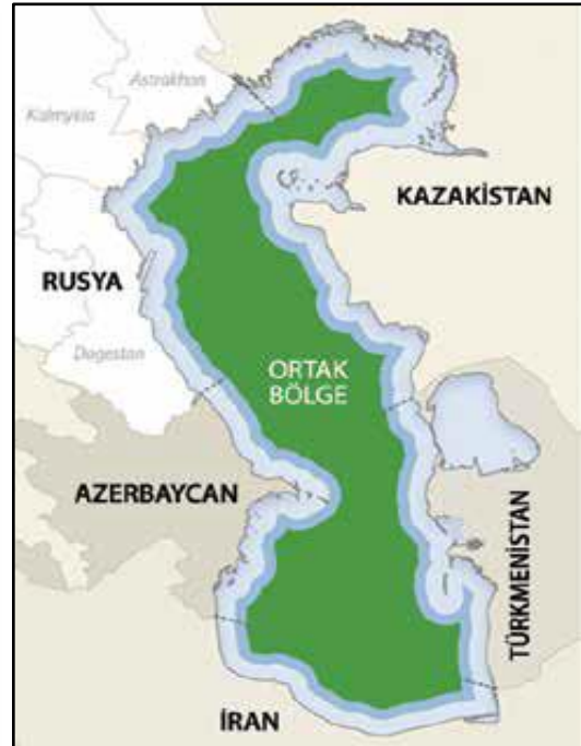
Şekil.2: Ortak Kullanım Senaryosu (Coffey, 2015: 16)