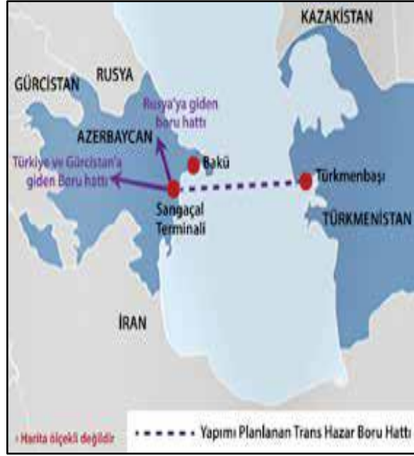
Şekil.3: GGK'na Türkmenistan'ın Dahil Edilmesi Planı (Karagöl vd., 2016: 25)