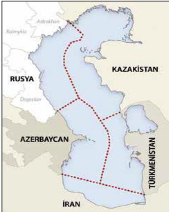
Şekil.1: Sınır Gölü Senaryosu (Coffey, 2015: 16).

Azerbaycan ve Kazakistan'ın savunduğu sınır gölü senaryosuna göre, sınırların belirlenmesi için orta hat yöntemi kullanılacaktır. Bu orta hat, her ülkenin kendi kara sınırlarından uzatılacak sınırlarla Hazar'ı beş bölgeye ayıracaktır (Şekil.1). Bu senaryoda ülkelerin her biri kendi egemenlik alanları olan ulusal sektörlere sahip olacaktır. Bu doğrultuda ülkeler kıyı şeritleri uzunluğuna göre bölgede eşit haklara sahip olacak ve özellikle kıyıdaş açıkta olan alanlardaki petrol ve doğalgaz sahalarının kullanımında özerk hareket etme imkânı elde edeceklerdir. Bunun sonucunda ülkelerin enerji sahaları üzerinde hak iddia etme sorunu çözülmüş olacaktır.