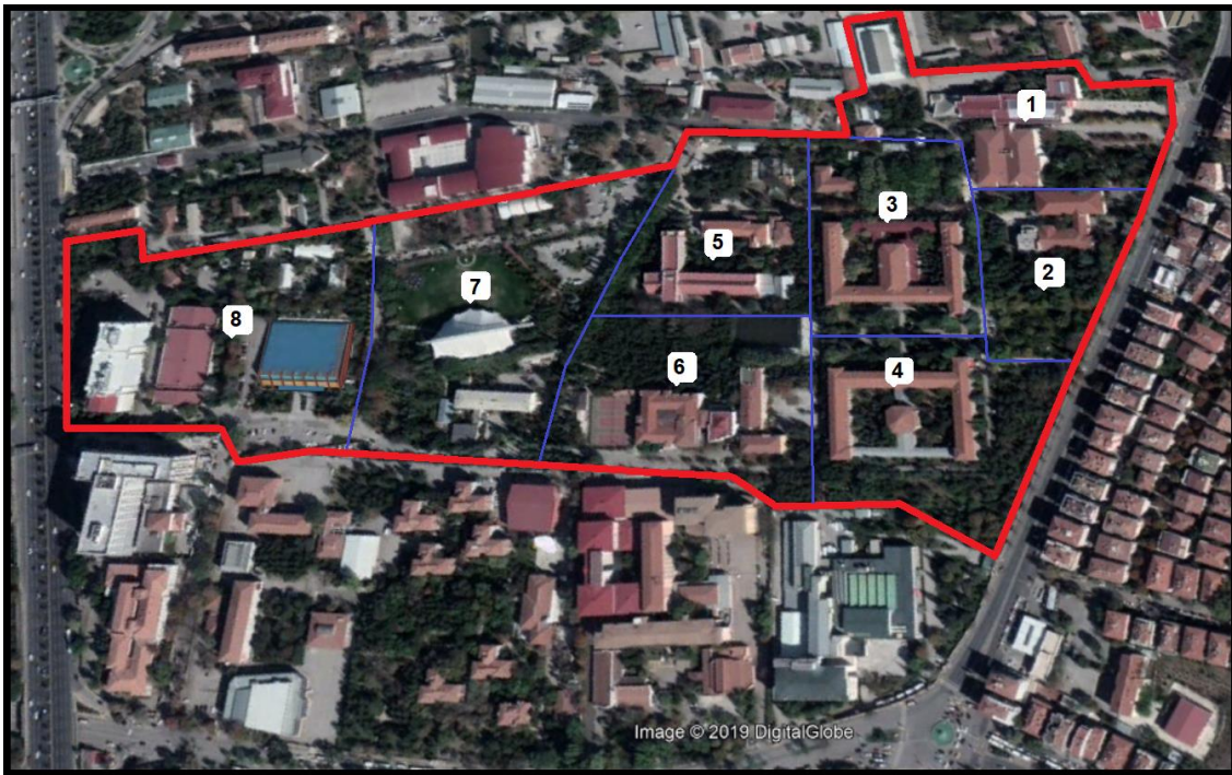
Şekil 1. Kampüs alanının uydu fotoğrafı ve parseller (— kampüs alanı sınırı, — parsel sınırları)

Ankara Üniversitesi 10. Yıl (Tandoğan) Yerleşkesi Ankara ili Çankaya ilçesi sınırları içerisinde ve coğrafik olarak güneyde 39.936800° K ve kuzeyde 39.937350° K paralelleri ile batıda 32.826330° D ve doğuda 32.835720° D meridyenleri arasında yer almaktadır. Kampüs çevresinde Anıtkabir, Makine Kimya Endüstrisi Kurumu, Tarihi Ankara Garı, Gazi Üniversitesi gibi çok önemli yerleşkeler bulunmaktadır. Onuncu yıl yerleşkesi yaklaşık 195.000 m 2 lik bir alana sahip olup yerleşke içinde Eczacılık ve Fen Fakültelerinin yanı sıra Rektörlük, spor kompleksi ve farklı yönetim binaları bulunmaktadır. Grid kareleme sistemine göre de B4 karesi içerisinde yer almaktadır (Şekil 1).