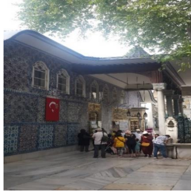
Görsel 7 ve 8. Ebu Eyyub El- Ensari Türbe Ziyaretleri

Zevi'nin aktarımına göre, "bir mekân, birlik, simetri, vurgu, zıtlık, oran ve ölçü içerse bile, yaşam ifadeden yoksunsa ve 'bir sey söylemiyorsa' hiçbir zaman yaşayan bir varlık olamamaktadır." (Zevi, 1990: 82). Bu bilinirlikten hareketle meydana yüklenen anlamlar mekândaki yaşantılar ve davranış pratikleri ile doğru orantılıdır. Göstergibilim çerçevesinden değerlendirildiğinde İstanbul Eyüp Sultan Meydanı algılanan fiziksel doku-