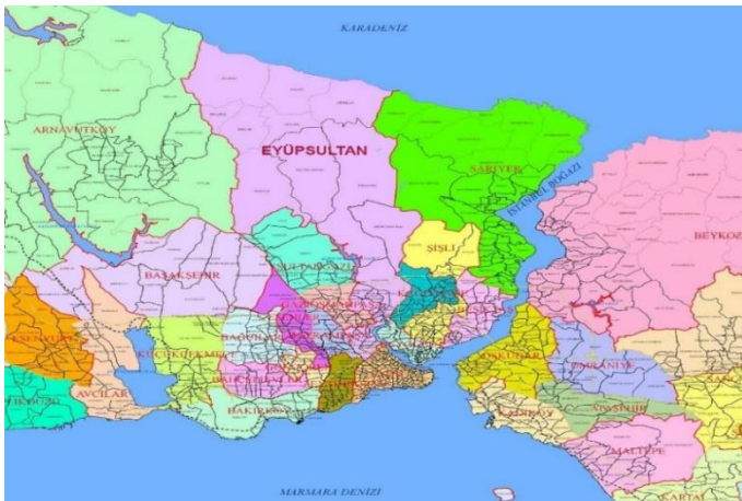
Görsel 1. Eyüp Sultan İlçe Haritası (URL-1).

Türk-İslam medeniyetinin simge mekânı olan Eyüp Sultan tarihsel kökleri Bizans dönemine dek uzanan bir semttir. Bu husus semte verilen adlara yansımış ve semt farklılaşan isimlendirmelere tâbi olmuştur. Semt “Bizans döneminde Kosmidion adıyla tanınmıştır. Hristiyan azizlerden, hekim asıllı olduğu kabul edilen Aziz Kosmas ve Aziz Damianos adına büyük bir manastır kurulmuş olduğundan yerin onun adına izafeten Kosmidion olduğu söylenmektedir.” (Eyice, 2006: 21). Semtin coğrafi sınırlarını “Kuzeydoğudan Sarıyer, doğudan Kâğıthane ve Şişli, güneyden Fatih, Bayrampaşa, Esenler, batıdan Gaziosmanpaşa, kuzeybatıdan Çatalca ilçeleri ve güneyden de Karadeniz oluşturmaktadır.” (Artan, 1995: 1).