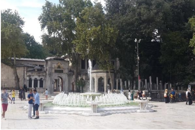
Görsel 3. Eyüp Sultan Tarihi Merkez

ğil eserlerin imgeleriyle varlığını sürdürmektedir. “Algılanan ve iletilen anlam, her toplumun kendi kültürüyle yoğrulmuş değerlere ve bireysel yaşam öğretilerine bağlıdır. Mimari ürünün birincil anlamı değil, simgesel değerleri taşıyan ikincil anlamlardır.” (Aydınlı, 1993: 29). Mekânı okumak, anlamlandırmak göstergebilim yaklaşımının disiplinler arası bir araştırma yöntemine dönüşmesini sağlamaktadır.