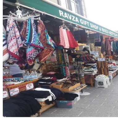
Görsel 5 ve 6. Meydanda Yer Alan İşletmelerin Satış Ürünleri (Yazar Arşivi)

Meydanda yer alan birçok işletme tarihsel köklere atıfla isimlendirilmekte ve bu minvalde işletmeler düz anlamın sunduğu işlevsel boyutlara ek olarak yan anlamı destekleyen yapıyı da beslemektedir. Eyüp Sultan Meydanı kamusal bir mekân olarak işlevsel boyutlar sunmasının yanı sıra yan anlamı destekleyen olgular ile de mühim bir göstergebilim sahası sunmaktadır. Alıcılar/kullanıcılar salt işlevsel yanlarını düşünerek meydanda yer almamakta yahut belirli ürünleri edinmemekte aynı zamanda kutsal bir mekânda bulunmanın içsel dinamiklerini de yaşamakta ve bu durumu davranış pratiklerine türbe ve cami ziyaretleri ile yansıtmaktadır.