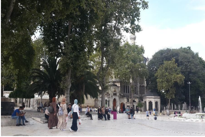
Görsel 4. Eyüp Sultan Meydanı Kullanım Biçimleri (Yazar Arşivi)

riyle iletişime geçtiği alanlardır. “Görmek ve görülmek ötekiyle/başkasıyla ilişkinin temelinde yer almaktadır.” (Bourse, 2009: 166). Başkasıyla kurulan ilişkinin en yoğun olduğu olanlardan biri olarak karşımıza çıkan kamusal mekânlar göstergebilim çalışmaları için mühim bir saha oluşturmaktadır.