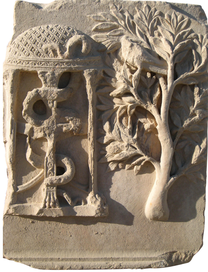
Resim 7: 2 no.lu Apollon altarı kabartması; yılan dolanmış uçayak, omphalos ve dalında kuzgun olan defne ağacı