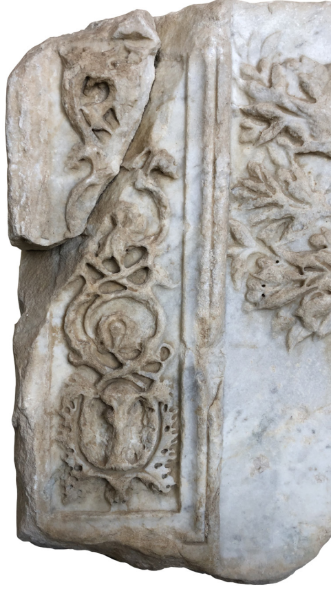
Resim 6: 1 no.lu Apollon altarı kabartmasından panel içinde yer alan akantus ve ranke süslemesi detayı

Apollon kehanetin, biliciliğin ve güzel sanatların, müziğin tanrısıdır. Tanrı Hera tarafından gönderilen ve tüm ekinleri yok eden, hayvanları telef eden, insanlara kan kusturan Python denilen dev canavarı (ejderha) öldürerek 12 , öldürdüğü yerde Pytho (sonra Delphoi adını alır) kehanet ve bilicilik merkezini kurar. Delphoi Tapınağı'nda dünyanın göbeği sayılan (omphalos) bir çukurun üstüne üçayaklı sehpa yerleştirilip, tanrının bilici kadını Pythia bu üçayak üstüne oturarak ve çukurdan yükselen gazlarla kendinden geçerek insan kaderiyle ilgili bilgiler vermiş 13 . Pytho (Delphoi)'daki tapınak için MÖ 8.-7. yy'da yaşayan Smyrnalı (İzmir) ozan Homeros İlyada'da (IX. 404-405) "...canın yerini hiçbir şey tutmaz dünyada, ne bakımlı İlyon'un, Akhalardan önceki zenginliği, ne de okçu tanrı Apollon'un, taşlı Pytho'da mermer tapınağında saklı hazineler...üçayakları, kızıl yeleli atları satın alırsın..." şeklinde bilgi vermiştir. Daha sonra tanrı Apollon bu kehanet merkezinden üçayağı çalmaya çalışan kardeşi Herakles ile de mücadele etmiş ve üçayağı, dolayısıyla bilicilik merkezini korumuştur 14 . Bu nedenle tanrı Apollon'un kült, kehanet ve bilicilikle ilgili olarak en önemli unsurları arasında defne ağacı, yılan, kuzgun, omphalos ve üçayak gelmektedir 15 . İki kardeş olan Apollon ve Herakles arasında yapılan üçayak mücadelesi Klasik sanatta vazo resimleri ve kabartmalarda sevilerek kullanılmıştır 16 .