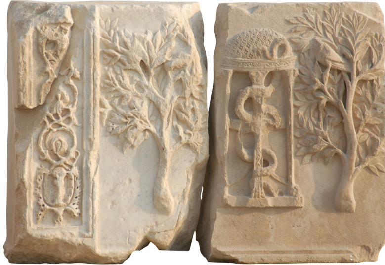
Resim 3: 1 ve 2 no.lu Apollon altarı kabartmalarının cephe, üst ve yan görünüşleri