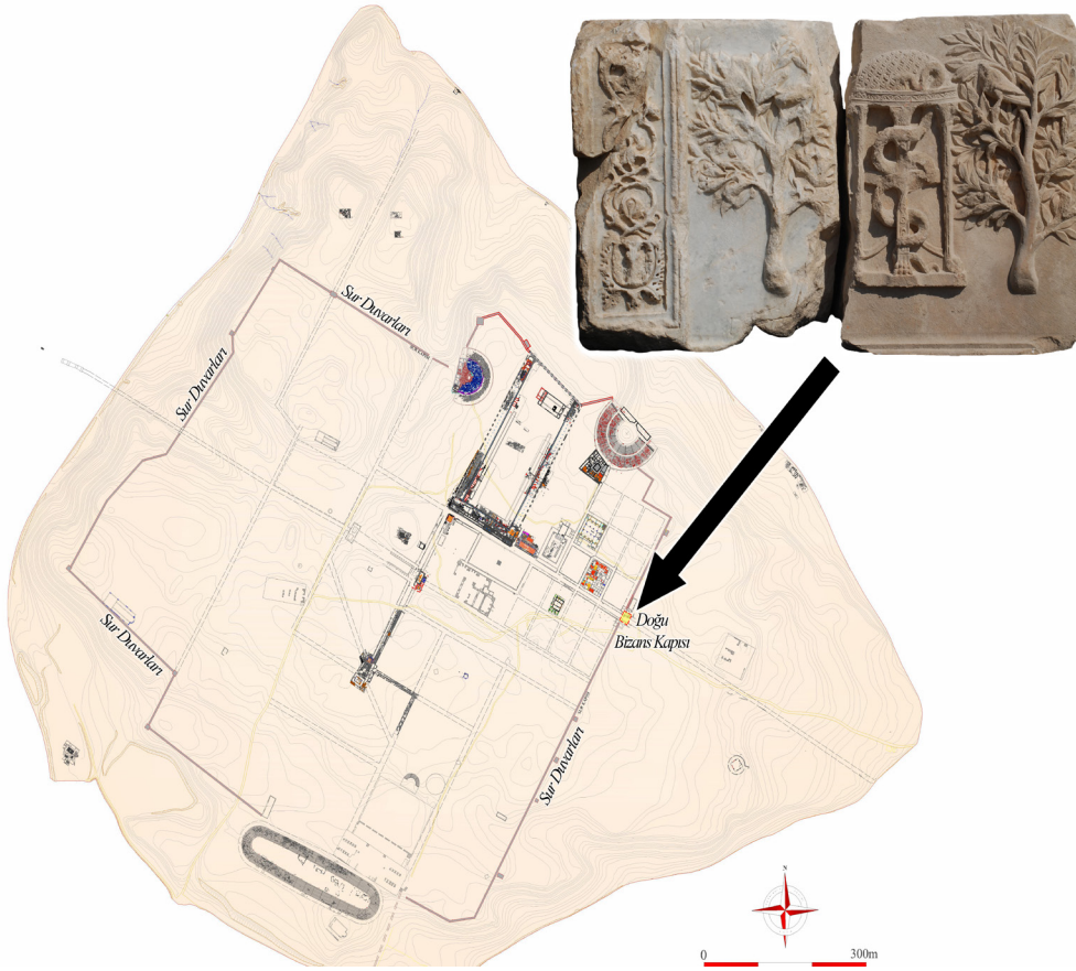
Resim 1: Laodikeia kent planı üzerinde Apollon altarı kabartmalarının buluntu konumu