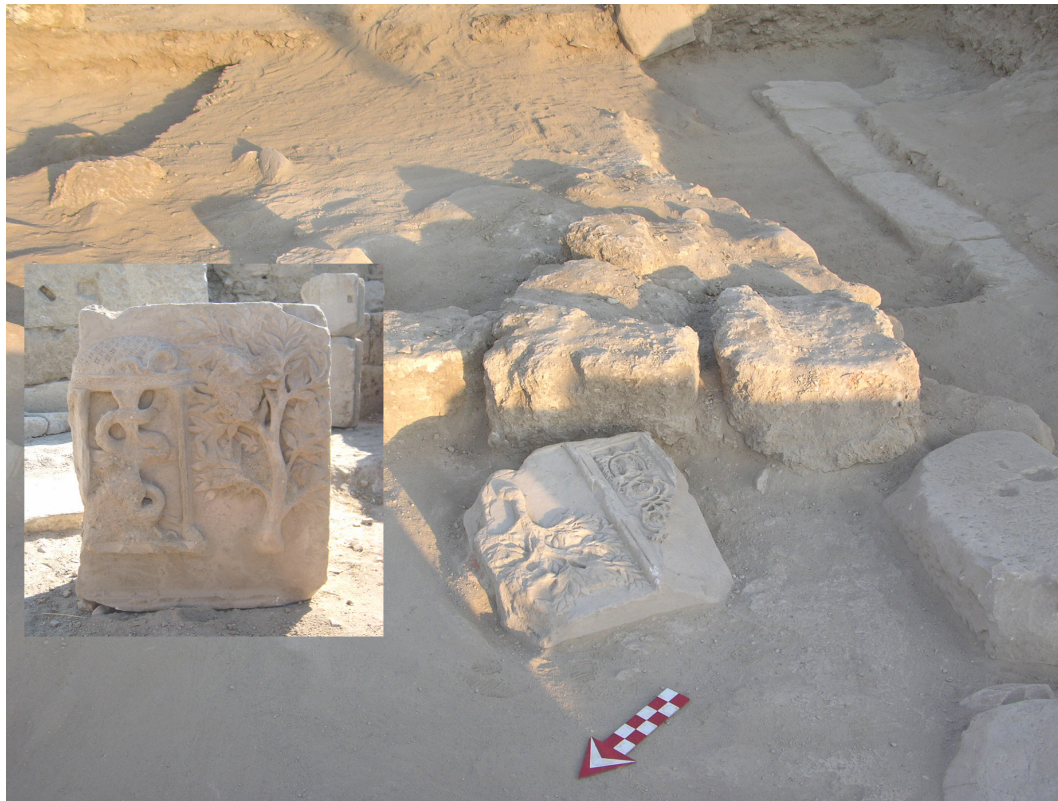
Resim 2: 1 ve 2 no.lu Apollon altarı kabartmalarının kazılar sonucu buluntu durumu