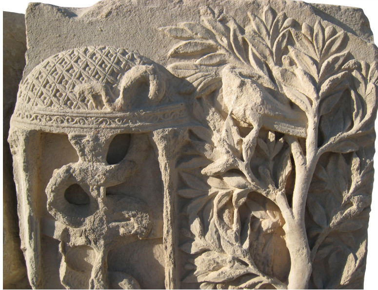
Resim 8: 2 no.lu Apollon altarı kabartması; yılan dolanmış uçayak, omphalos ve dalında kuzgun olan defne ağacı detayı