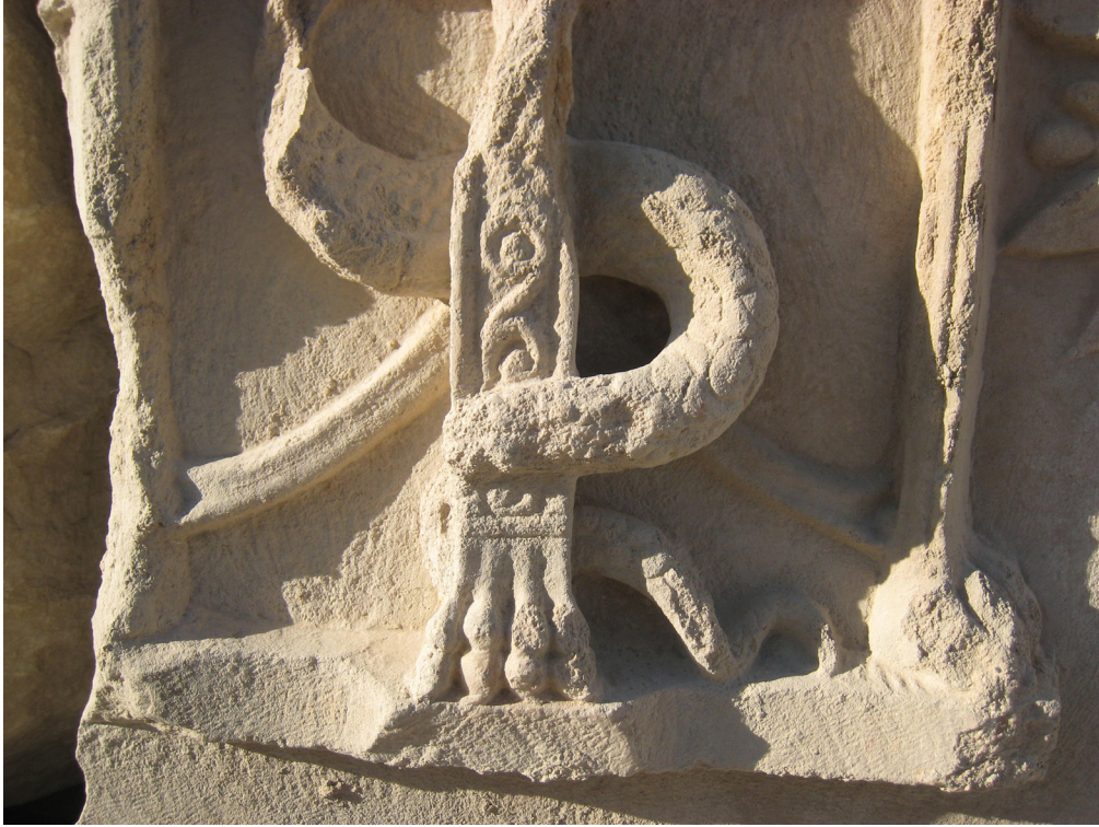
Resim 9: 2 no.lu Apollon altarı kabartmasından yılan dolanmış üçayak detayı