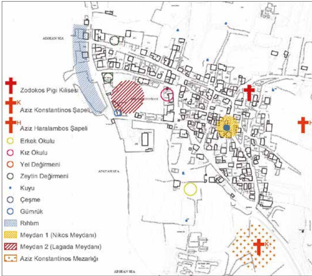
Şekil 4: Ildırı köyü içindeki 19. yüzyıla ait röper yapılar ve açık alanlar (2015 yılında üretilen halihazır harita üzerine işlenmiştir). / Important buildings and public spaces in Ildırı

birlikte köyün içine ilişkin bilgi vermemektedir. Bu durumda köy içini anlayabilmenin tek kaynağı günümüze gelebilen izlerle mübadillerin anlatıdır. Rum döneminde inşa edilen konut dışındaki yapıları, bir kısmının günümüze yıkıntı olarak da olsa ulaşmış olması ve gerek Türk gerekse Rum mübadillerin anlatılarında sıklıkla yer almaları sebebiyle deşifre etmek görece kolaydır. Özellikle bellekte yer etmiş yapılar, daha çok ve daha detaylı bahsedilmiş olmalarından ötürü kolaylıkla konumlandırılabilir. Ancak bellekte yer edememiş yapıları, eğer yıkılmışlarsa, konumlandırabilmek son derece zordur. Örneğin bir gümrük binasının varlığını başka bir yapı tariflenirken bahsi geçmesinden öğrenebiliyoruz 16 . Bu yapı, Rumların anlatılarında önemli görülen diğer yapılara referansla bahsedildiği için bulmacada yerine oturtulabilmektedir. Ancak anlatılarda geçen Kız Okulu için yeterli ipucunu bulunamamıştır. Burada ilginç olan, görece daha büyük ve gösterişli olan Erkek Okulu'nun hem Weber Haritasında gösterilmesi ve hem de yapı günümüze ulaşamamış olsa da Türk mübadiller tarafından yıkıntılarında hatırlanarak doğru konum bilgisiyyle aktarılmasıdır. Dikkat çekmeyen ve mütevazı bir yapı olduğunu Rumların anlatılarından anladığımız Kız