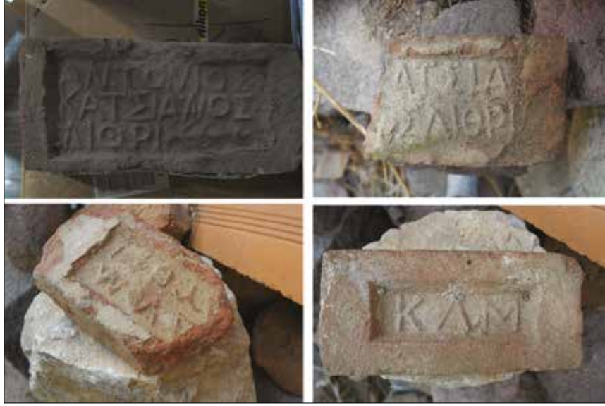
Levha 3. Farklı üreticilerin damgalarını içeren tuğlalar / Bricks that have stamps of different manufacturers

kişilerdi ki yanbaşılarında İzmir, karşılarında Sakız gibi büyük şehirler olduğu halde en basit ihtiyaçlarını Avrupa'dan temin ediyorlar, devrin modasını günü gününe takip ediyorlardı” şeklinde yansımaktadır (Bayburtluoğlu 2015: 16). Rumların Ildırı'daki 100 yıllık yaşamı, İmparatorluğun çöküşünün getirdiği iç karışıklık ve Balkan Savaşları ile kuvvetlenen siyasi çözülme süreciyle son bulmuştur. Her ne kadar bu dönemde Çeşme Kaymakamlığı yapan Hilmi Uran anılarında Rumların olası tepkilerden korktukları için adalara kaçtıklarını söylese de (2008: 63) Rumların anlatıları oldukça farklı bir gidiş hikayesinden bahsetmektedir. Bu anlatıya göre Almanlar Türklere Hristiyan nüfusu Osmanlı saflarında savaşmaya ikna etmek için ya askere gitmelerini ya da köylerini terk etmelerini istemelerini öğütlemişlerdi. Böylece Hristiyan nüfusun yerleşimlerini terk etmemek için askere gitmeyi kabul edecekleri beklenmekteydi. Ancak bu beklenti gerçekleşmedi. Bunun üzerine Ildırı'nın liderine 28 Mayıs tarihinde açılması emredilen bir mektup gönderildi. Mektup açıldığında Rumlar, o gün köyü terk etmeye mecbur olduklarını öğrendiler ve 29 Mayıs 1914 da eşyalarını toplayarak karşı adalara geçtiler (Borias 1956). Yunan işgali döneminde bir bölümü geri dönse de Kurtuluş Savaşından sonra tekrar ve son kez Ildırı'dan ayrıldılar.