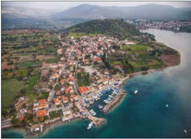
Fotoğraf 2: Batı yönden Ildırı hava fotoğrafı. / Aerial view of Ildırı from westwards

bahsi geçen kahvehanelerden hiçbiri günümüze ulaşmadığı ve bu meydan başka röper yapılarla ile ilişkilendirilmediği için konumlandırmak zordur. Anlatılardan denize yakın olduğunu ve etrafında birçok su kuyusu olduğunu öğrendiğimiz Lagada Meydanı için en olası konum, günümüzde otopark olarak kullanılan boş parsel olmalıdır (Şek. 4).