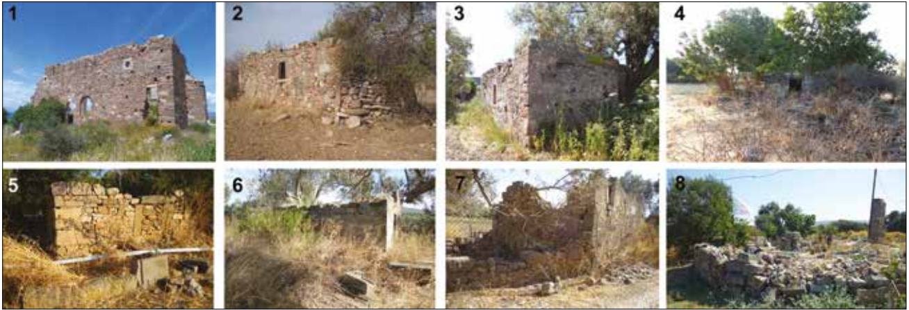
Levha 2. Ildırı ve çevresindeki kilise ve şapeller / Churches and chapels around Ildırı; 1: Aziz Matrona Kilisesi, 2: Aziz Nikola Şapeli, 3: Aziz Haralambos Şapeli, 4: 144 numaralı adada yer alan şapel (Erythrai Kazısı Arşivi), 5: 141/1 ada-parselde yer alan şapel (Erythrai Kazısı Arşivi), 6: 143/4 ada-parselde yer alan şapel (Erythrai Kazısı Arşivi), 6: 144/8 ada-parselde yer alan şapel (Erythrai Kazısı Arşivi), 6: 133/15 ada-parselde yer alan şapel (Erythrai Kazısı Arşivi)

Akropol'ün doğu eteklerinde yer alırken bağlar sur içerisindeki tarım arazilerinin doğusunda ve sur duvarlarının kuzey-doğu ve batı duvarlarının dışında yer almaktadır (Şek. 2). Bu bağlardan ve zeytinliklerden elde edilen ürün fazlası öncelikli olarak Alaçatı ve Çeşme'ye ve sonrasında çevre yerleşimlere satılmaktadır (Drimpedis 1961). Ildırı, Sakız, Çeşme ve İzmir ile aktif bir deniz ticareti ilişkisine sahiptir ve limandan giriş çıkış yapan mallar gümrükte kayıt altına alınmaktadır 21 . Köy içine dağılmış her türlü ürünün bulunabildiği beş adet bakkal, bir adet manifaturacı dükkanı ve bir ayakkabı tamircisi vardır 22 . Bu dükkanlara mallar