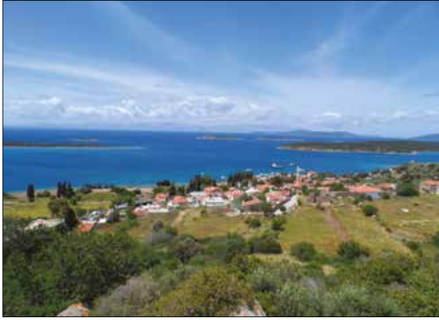
Fotoğraf 1: Akropol Tepesinin doğu yamacından Ildırı koyu manzarası / Vista of Ildırı Cove from the east skirt of Acropolis Hill