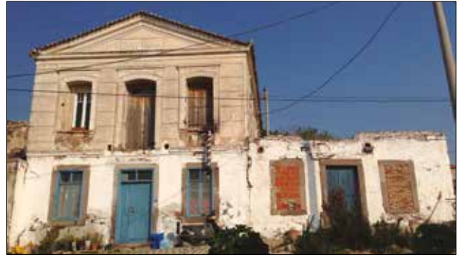
Fotoğraf 4: Ildırı'nın ekonomik açıdan iyi olduğunu ortaya koyan konutlardan biri / A dwelling reflecting welfare condition of Ildırı