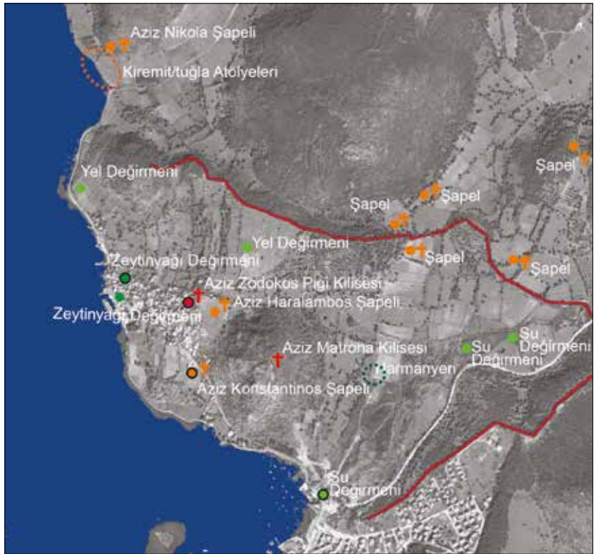
Şekil 3: Ildırı çevresinde artık var olmayan ya da yıkıntı durumunda olan yapılar (Günümüze ulaşamayan yapılar siyah çerçeve ile ayrıştırılmıştır) (Erythrai Kazısı arşivinden elde edilen hava fotoğrafı üzerine işlenmiştir). / Nonexistent or ruined buildings around Ildırı (Nonexistent buildings are highlighted with black frame code)