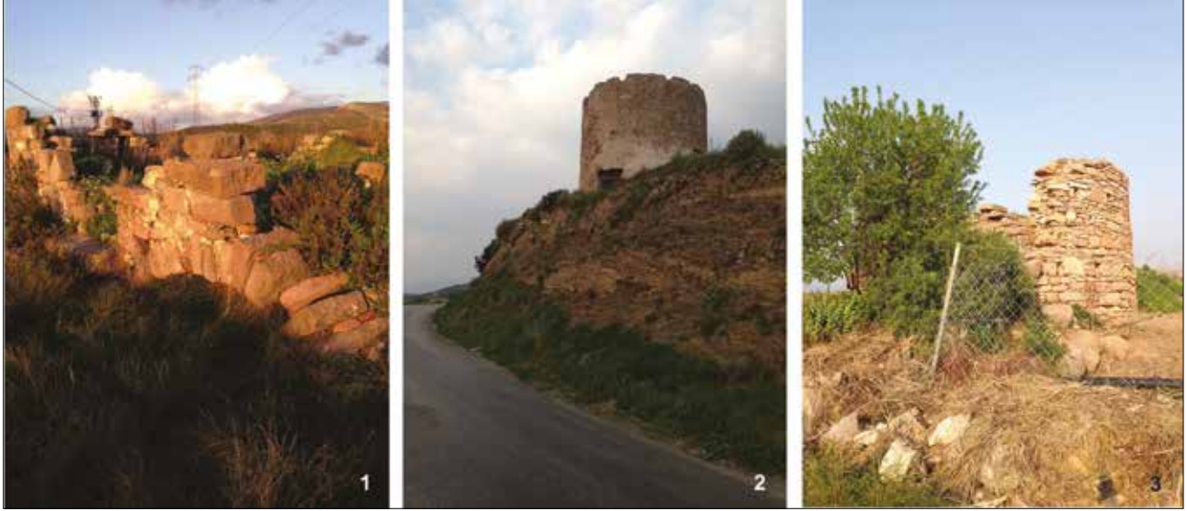
Levha 1: Ildırı çevresindeki su ve yel değirmenleri /Water and wind mills around Ildırı; 1: Azmak (Aleon) Dersi üzerindeki su değirmenlerinden biri , 2: denize yakın yel değirmeni, 3: köyün kuzey doğusunda yer alan su değirmeni