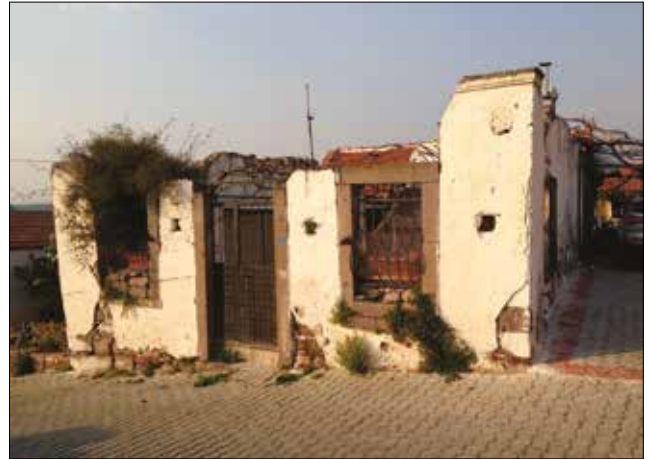
Fotoğraf 5: Ildırı'nın ekonomik açıdan iyi olduğunu ortaya koyan konutlardan birinin yıkıntısı / A ruined dwelling having traces of welfare condition of Ildırı in the past.

Tarım, Ildırı ekonomisinin temel kaynaklarından biridir. Öncelikli tarım ürünleri zeytin ve üzüm olmakla birlikte pamuk, buğday, tütün, susam, incir de ticareti yapılan ürünler arasındadır (Borias 1956). Weber haritasından anlaşıldığı üzere tarım arazileri sadece sur içerisinde,