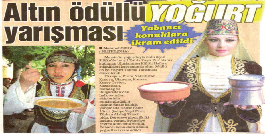
Fotoğraf 11. Festivalin 32. yılı olan “yoğurt yılı”nda düzenlenen yoğurt yarışması

“Toplumsal yeniden üretim/tüketim ilişkilerinin yapılandığı ve dağıldığı” (Erdoğan, 2011, s. 80) festival kapsamında batırık, sıkma, keşkek, yahni, yoğurt, ayran, çökelek gibi yöresel yiyecekler Göksu Irmağı boyunca köy derneklerince kurulan Yörük çadırlarında çoğu zaman saz ve söz eşliğinde halkın hizmetine sunulmaktadır. Beverly J. Stoeltje (2009, s. 337) “Festival” adlı çalışmasında festival yemeklerini gruba kimliğini cisimleştirme fırsatı sunan unsurlar olarak tanımlar ve yemekler daima belli olur der. Silifke festivalinde de bu yemekler, vazgeçilmez ve değişmez unsurlar olarak sıkma 8 , keşkek, yahni, batırık, tantuni ve yayık ayranından oluşmakta; grup kimliğinin doğrulanmasına olanak vermektedir. Ayrıca festivalin düzenlendiği ilk yıllardan beri pek çok kez düzenlenen batırık ve yoğurt yapma yarışması da bu geleneğin sürdürülme sürecinin etkili yöntemlerinden biri olarak değerlendirilebilir.