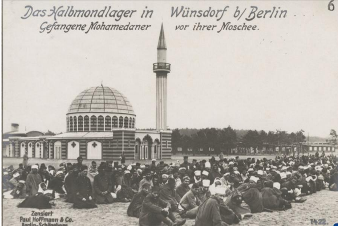
Ek 1: I. Dünya Savaşı esnasında Almanlar tarafından Müslüman savaş esirlerine İslam propagandasının yapıldığı cami.

BArch PH 9-XXIV/42 Feldzeugmeisterei der Preußischen Armee.- Fotoalbum "Aus großer Zeit" (1914-1918) Wünsdorf'da bulunan Müslüman savaş esirleri kampı camii.