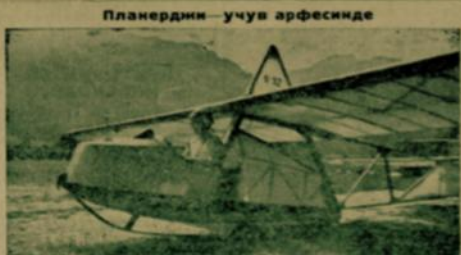
Планердин учув арфесинде