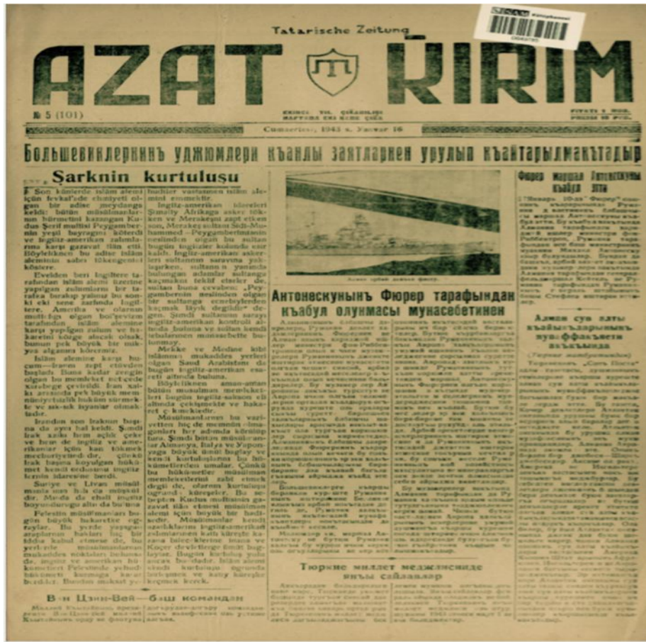
ЕК 2: Anonim, “Şark’ın Kurtuluşu”, Azat Kırm, 16 Ocak 1943. Erişim Tarihi: 20.08.2020.