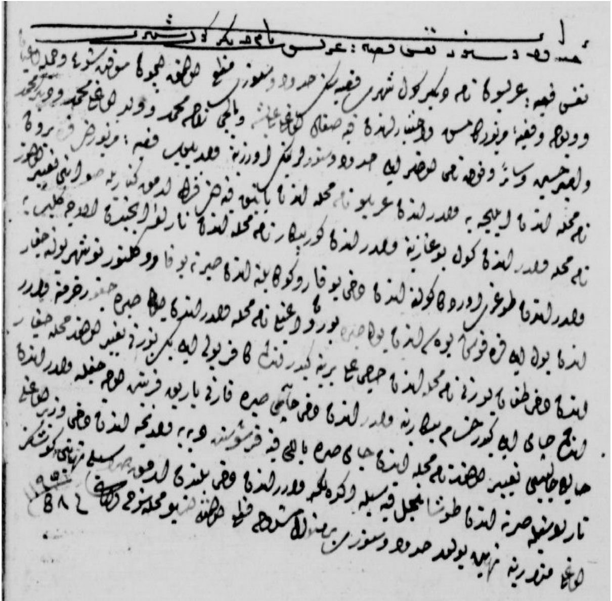
Ek 1: Gülşehri kaza merkezinin sınırlarına dair belge ve transkripsiyonu 136