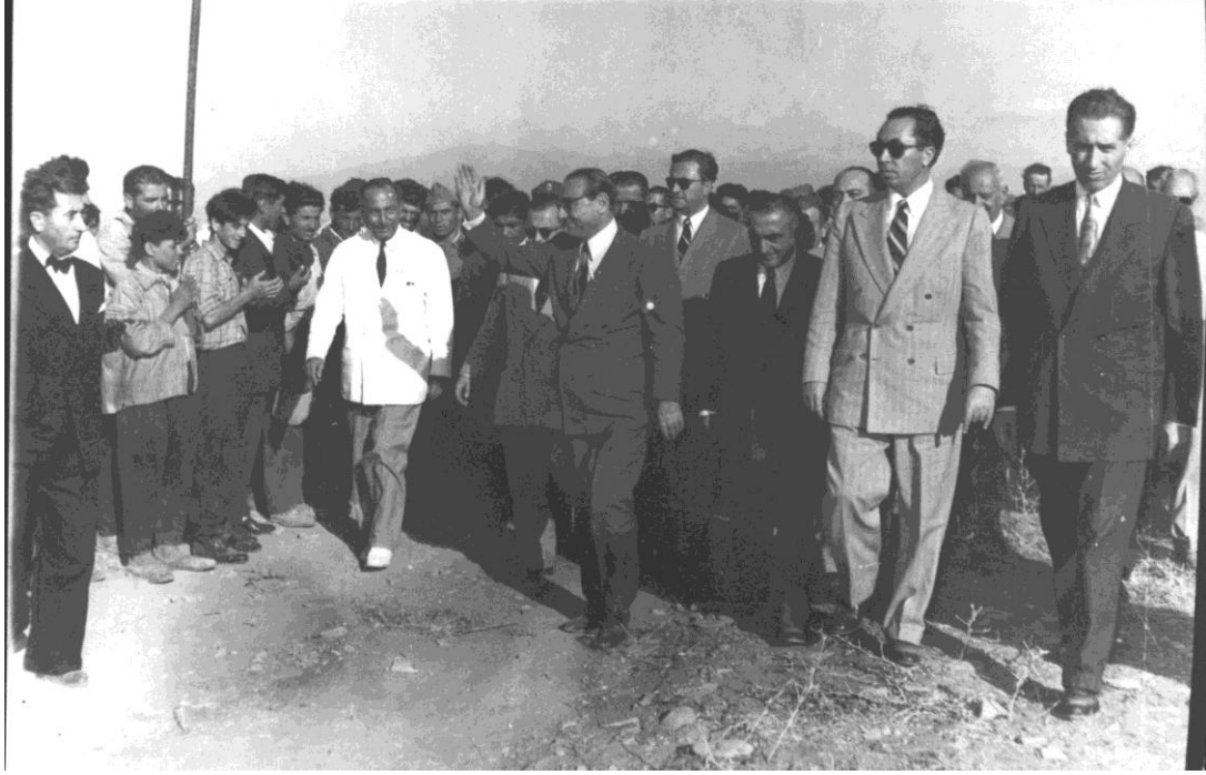
Fotoğraf 1. Yurt gezisinde Adnan Menderes, Samet Ağaoğlu ve Namık Gedik.

Kaynak: BCA, Başbakanlık Özel Kalem Müdürlüğü (030.1.0.0). Yer: 2.16.21. Sayfa: 20.