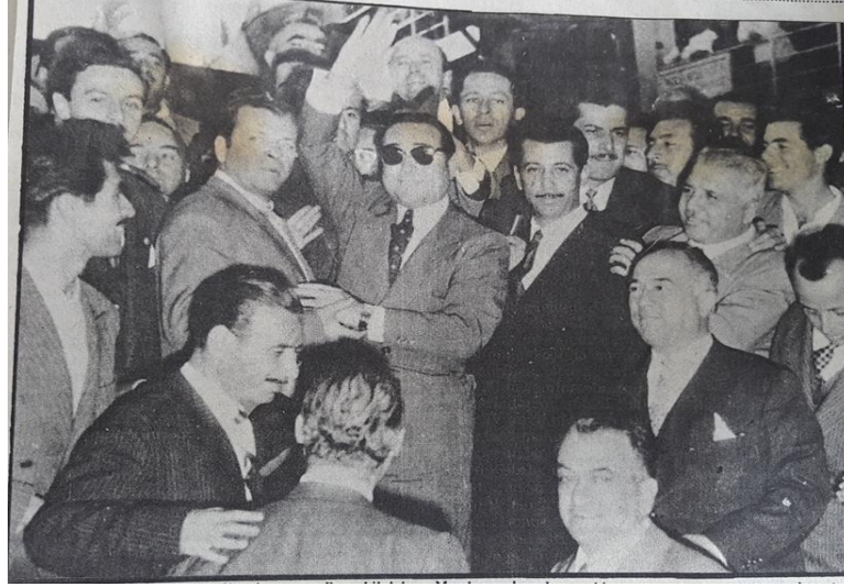
Kaynak: Tekin Erer, “27 Mayıs’ın İlk Günü”, Son Havadis, 3 Haziran 1980.