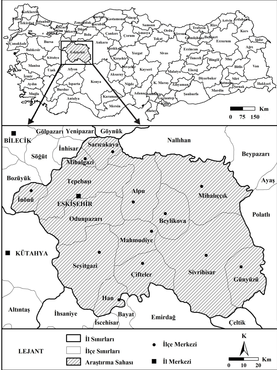
Harita 1. Eskişehir İlının; Konumu, Sınırları ve İdari Haritası

Nüfusun devamlı yaşama bölgelerini birey, aile ya da gruplar halinde terk ederek geçici ya da kalıcı olarak yerleşmek amacıyla bir başka yere gitmesi hareketi, göç olarak tanımlanmaktadır (Doğanay ve Orhan, 2016: 193). Bu yer değiştirme hareketine bağlı olarak göç veren yerin nüfusu azalırken, göç alan yerin nüfusu artar. Bundan başka söz konusu yer değiştirme hareketi; ülkeler arasında meydana geliyorsa, dış göç; bir ülkenin sınırları dâhilinde gerçekleşiyorsa da iç göç olarak nitelendirilir. Türkiye'deki iç göç olaylarından en çok etkilenen illerden birisi de Eskişehir'dir.