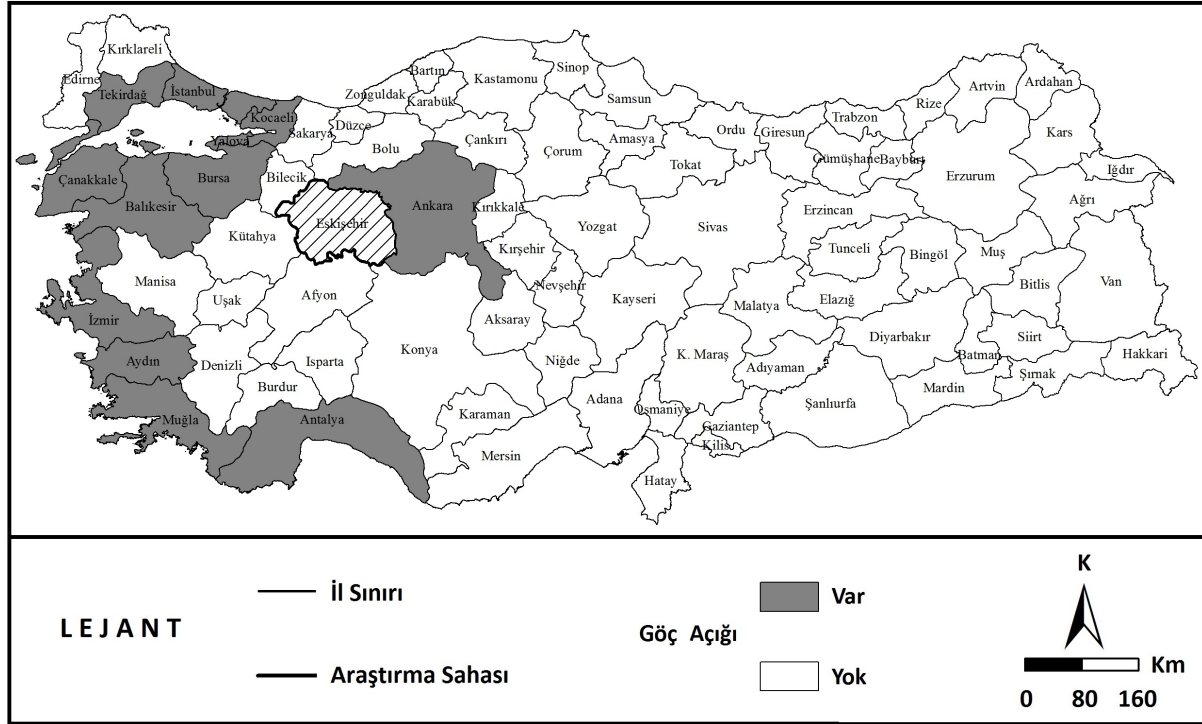
Harita 4. Sahada İkamet Edip Başka Bir İlin Nüfusuna Kayıtlı Olanlardan, Saha Nüfusuna Kayıtlı Olup Başka İllerde Yaşayan Nüfusun Çıkarılmasıyla Oluşturulan Eskişehir İlinin Göç Açığı ve Fazlası Durumunu Gösterir Harita (2019)

Araştırma sahasına; iş bulma umuduyla göç edenlere, öğrenim görmek üzere gelen öğrencilere ve yazları veya emekli olunca gelen gurbetçilere bağlı olarak özellikle Eskişehir kentinde ortaya çıkan konut ihtiyacı, pek çok sektörü doğrudan ya da dolaylı olarak etkileyen inşaat sektöründe canlanmaya sebep olmaktadır. İnşaat sektörünün ihtiyaç duyduğu işgücü de yine iş bulmak maksadıyla sahaya göç edenlerden karşılanmaktadır.