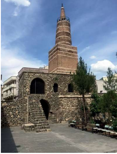
Görsel 8: Cizre Ulu Camii Minaresi Günümtüzdeki Durumu.