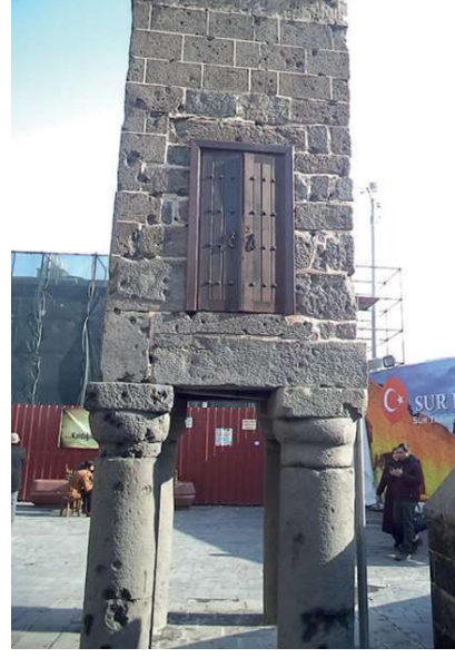
Görsel 17: Şeyh Mutahhar Camii Minare, Dört Ayak Şeklindeki Kaidesi. (Foto Ebru ELPE).