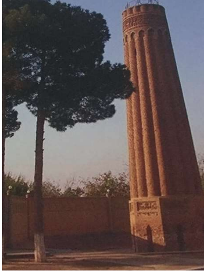
Görsel 2: Çarkurgan Minaresi. Eravşar, vd, s. 84