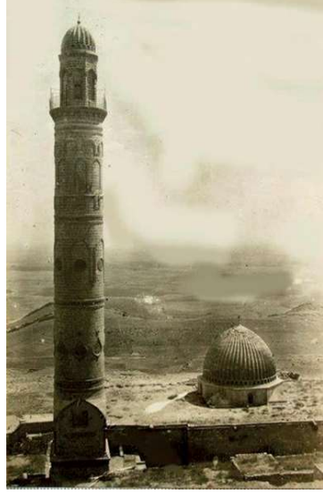
Görsel 9: Mardin Ulu Camii ve minaresinin 1910lardaki görünümü.