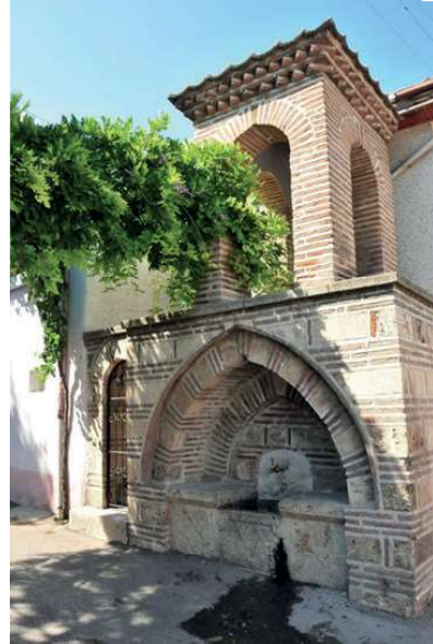
Görsel 15: Bursa Veled-i Yaniç Mina- resı (Erişim Tarihi: 01—09-2020)