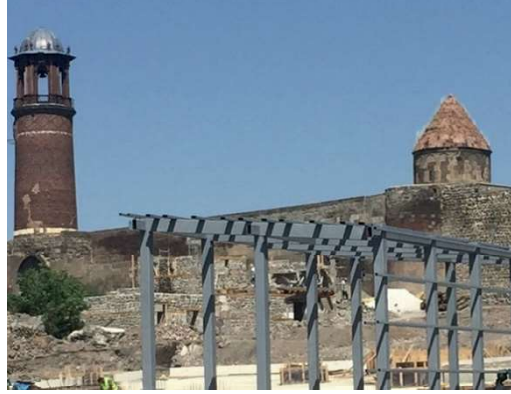
Görsel 5: Erzurum Kale Mescidi Minaresi.