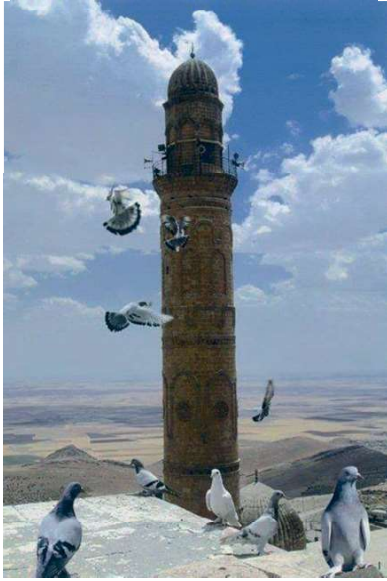
Görsel 10: Mardin Ulu Camii Minaresi.