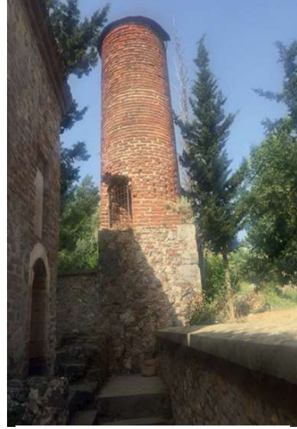
Görsel 13: Alanya Akşebe Mescidi Mi- naresi . (Foto Ebru ELPE).