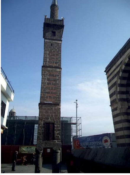
Görsel 16: Diyarbakır Şeyh Mutahhar Camii Minaresi.