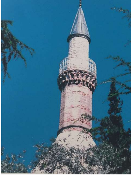
Görsel 14. Bilecik, Orhan Camii , Asıl Mi- naresi . Aslanapa,,2004 :7)