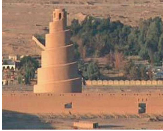
Görsel 1: Samarra Ulu Cami Minaresi. https://www.islamdusunceatfasi.org/detail/event183