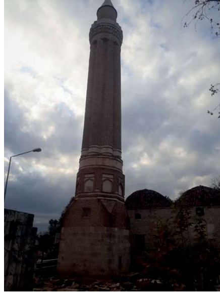
Görsel 11: Antalya Yivli Minare Genel Görünüm.