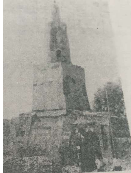
Görsel 7: Cizre Ulu Camii Minaresinin Eski Bir Fotoğrafi. Tuncer, 1981: s. 116, foto 21)