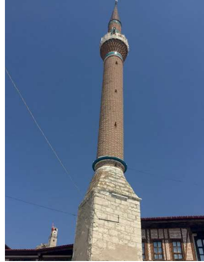
Görsel 19: Eskişehir, Sivrihisar, Kılıç Mes-cidi Minaresi.