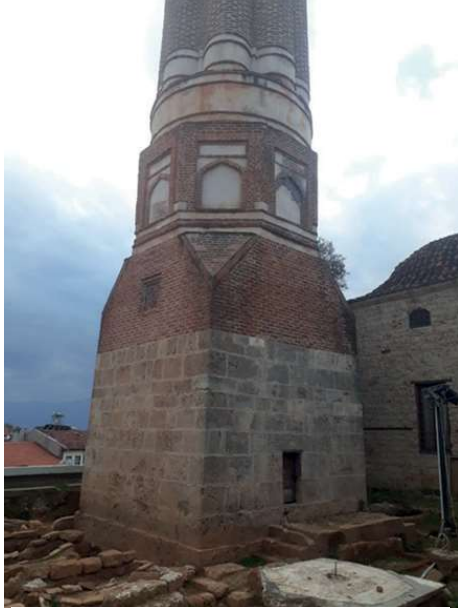
Görsel 12: Yivli Minare, Kaide, Küp ve Gövdenin Alt Kısmı.(Foto Ebru ELPE).