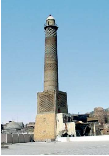
Görsel 4. Musul Ulu Camii Minaresi (Çobanoğlu, 2013;s. 273).