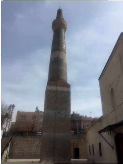
Görsel 6: Siirt Ulu Camii Minaresi.