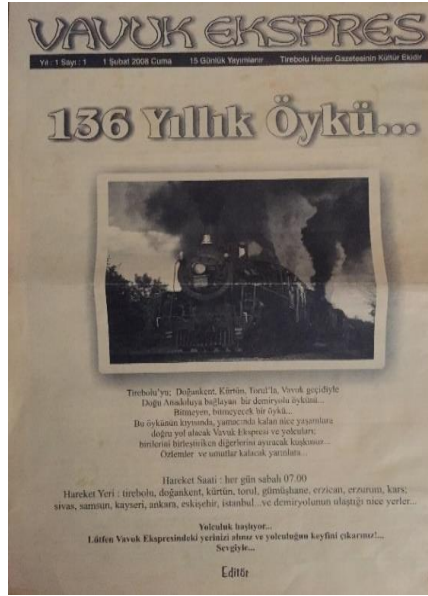
Görsel 1. Derginin İlk Sayısı 1