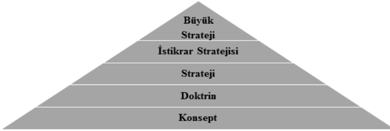
Şekil 1: Büyük Strateji’nin Konumu *

genişliği ve platform çeşitliliğindeki esneklik Kennedy döneminde “Esnek Karşılık” konseptine ( Flexible Response ) evrilmiştir. 27 Nitekim NSC 68’ye ilham veren ve NSC 162/2’de evrimleşen “Çevreleme” kuramından taviz verilmemiştir. Vaka üzerinden değerlendirdiğimizde ise 1954 yılında nükleer doktrin kapsamında inşa edilen İncirlik Üssü’nün açılmasıyla 1962 yılında Güney Vietnam’a “eğit-donat” kapsamında gönderilen 16 bin Amerikan askerinin ya da TPAJAX Operasyonu ile Latin Amerika’daki ülkelere “ Peace Corps ” altında iktisadî yardım hamlesi arasında “Büyük Strateji” nazarında hiçbir fark yoktur. Başka bir deyişle uygulamada çevreleme ile ifade bulan büyük strateji, doktriner anlamda küçük değişikliklere uğramış olmasına rağmen yedi Amerikan başkanın yönetimi altında dikkat çekici bir şekilde istikrarını korumuştur. 28 Bu noktada Büyük Strateji’nin bulunduğu konumu ve Amerikan Büyük Stratejisi’ni bir şema ile şöyle ifade etmek mümkündür: