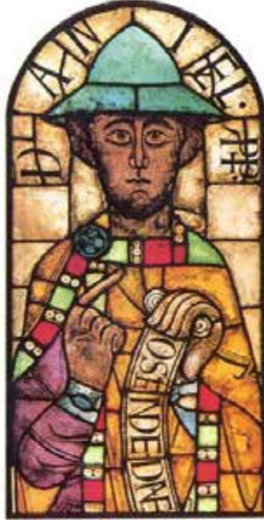
Görsel 7: Sanatçısı bilinmiyor, Aziz Daniel, vitray tekniği, (Roman dönemi) Bayern, Almanya.

Portre konusuna daha erken dönemlerde rastlansa bile portrenin yaygın kullanımı şüphesiz Rönesans'la tarihlendirilebilir. Rönesans Dönemi; farklı ülkelerdeki gelişimi sayesinde, konu çeşitliliğin artmasına ve özellikle de portre konusunun Rönesans sanatçıları tarafından incelenmesine neden olmuştur. Bu popülerlik boyutu ve kullanımı portreyi etkilemiş ve çeşitli tarzlarda (ekoller) çalışma imkânı sağlamıştır. Rönesans sanatçılarının yapmış oldukları portrelerde, sanatçıların çizimlerine katkı sağlayan modellerin idealize edilmiş yüz formları dikkat çekmektedir. Sanatçılar, betimlemiş oldukları eserlerde bireysel kimliğin yansıtılması çabası içinde olmuşlardır. Sanatçıların bu çabası da portrelerde “eşsiz bireysel kimlik düşüncesinin” ortaya çıkmasına sebep olmuştur. Bu yüzyılda portre konusunu inceleyen pek çok sanatçı, kendi bireysel çalışmalarını yapmıştır ( Görsel 9-10).