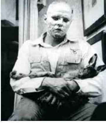
Görsel 21: Joseph Beuys, Ölü Bir Tavşana Yapıtlar Nasıl Anlatılır, 1965, Yaklaşık 120 dk. Süren Performans Çalışma, Schmela Galeri, Almanya.

tedir (Hodge, 2014: 184). Bu performans sanatı tekrarlanmadığı için ya fotoğraflanmakta ya da videoya çekilerek kayıt altına alınmaktadır. Performans gösterisi; iki veya üç eşya parçası, az bir dekor ve gösterime uygun olan bir kostümle bir mekân içinde veya dışında yapılmaktadır. Bu performans gösterisinde sanatçı, gösterinin ana oyuncusu ve gösterinin merkezinde yer almaktadır (Carlson, 2013: 27).