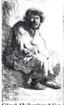
Görsel 13: Rembrandt Van Rijn, Dilenci Olarak Kendi Portresi, 1630, Gravür, 7x11,6 Rijks Müzesi, Amsterdam, Hollanda.

On yüzyılda portre sanatçıları daha çok psikolojik gerçeğe önem vermeye başladılar. Bu yüzyılda, barok dönemde portre anlayışı dönemin sanatsal gelişimi içinde değerlendirilir. Barok dönemdeki resim anlayışında gerçeklikten çok düş gücünün önem kazandığı, abartılı duyguların üzerinde durulduğu ve teatral özelliklerin figürlere (portrelere) yansıdığı biçimdedir. Bu sanatçılar idealleştirme ve dekoratifleştirmenin yanı sıra bireysel özellikleri de betimlemeye çalıştılar ( Görsel 13 ).