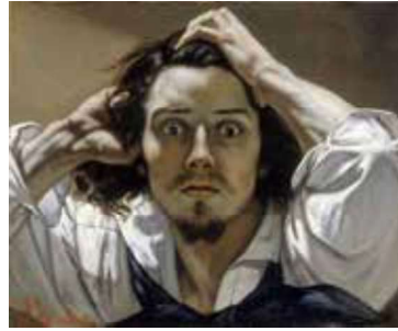
GörSEL 17: Gustave Courbet, Otoportre, 1844 Tuval Üzerine Yağlıboya, 45 x 55 cm, Özel Koleksiyon.

Romantizmin duygusal ve coşkucu yönüne tepki olarak doğan akım realizmdir. Bu sanat akımında gerçekçi tarzda portre vb. konuların işlendiği görülmektedir. Bu akımın içinde