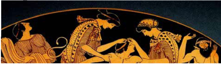
Görsel 3: Kırmızı figürlü Yunan vazo resminden bir detay, “Pentheus’un Ölümü”, MÖ,420.

Mısır uygarlığında bu sanatsal gelişim sürecinde devam eden diğer bir uygarlık da Yunan’dır. Yunan uygarlığı sanatı üç dönemde incelenmektedir: Arkaik Dönem, Klasik Dönem ve Helenistik Dönem. Sanatsal oluşum bu üç dönemde gelişim göstererek devam etmiştir. Yunan uygarlığında portre iki şekilde tasvir edilmiştir. İlki, antik vazoların üzerine yapılan resimlerde ve ikincisine de Antik Yunan heykellerinde rastlanmaktadır. Antik vazo resimlerinde anlatımcı stilize edilmiştir ve insan figürleri/portreleri dikkat çekmektedir (Görsel 3).