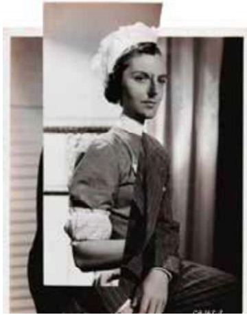
Görsel 26: John Stezaker, İhanet / Film Portreleri Serisi) Kolaj Çalışması, 21,6 x 26,6 cm, 2007-08.

yüzlerini göstermektedir. Yapılan bu çalışma proje kapsamında ele alınmış ve neticesinde kamusal alana taşınmıştır. Kamusal alanda gerçekleştirilmiş olan bu çalışma ile suçlu insanların 3D baskıları yoluyla kimliklerinin ifşa edilmesi ve sınıflandırılması olasılığını gündeme getirmiştir. Sanatçının yapmış olduğu DNA portreler çalışmalarından sonra özel bir şirket saç, göz, deri rengi, yüz morfolojisi, cinsiyet ve genetik ataları tanımlayan “ snapshot ” isimli bir yazılım geliştirmiş ve bu yazılımda hukuki uygulamalara hizmet vermeye başlamıştır (Yılmaz, 2018: 234-235).