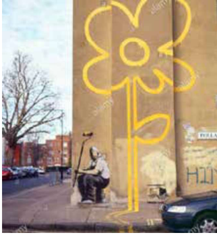
Görsel 27: Banksy, Sarı Çizgili Çiçe, 2008, Yaklaşık 250 cm Yüksekliğinde, Duvar Üzerine Graffiti Tekniği, Bethnal Green, Londra, İngiltere.

Daha önce ifade edildiği gibi post-modern sanat, farklı malzeme kullanımı çeşitli sanatsal tekniklerin ortaya çıkışını veya gelişimini sağlamıştır. Özellikle 1980'lerden itibaren bu gelişim açıkça fark edilmektedir. Bu gelişimi sürdüren sanat biçimi sokak sanatıdır. Sokak sanatının ilk oluşumuna bakıldığında grafiti tekniğiyle başladığı görülür. 1960'larda görülen bu grafiti tekniği, kamusal alanlara yazılan kalın harfli yazılar olarak ortaya çıkmıştır. Bu gelişim süreci içinde grafitinin; özellikle sprej boyanın kullanımıyla, çok renkli ve karmaşık kaligrafik tasvirlerle dönüştüğü görülür. Bu tasvirler, toplu ulaşım araçlarına ve şehirlerin metrolarına çizilmişlerdir. Bu ilk grafiti çizimlerde popüler kültürden ve animasyon