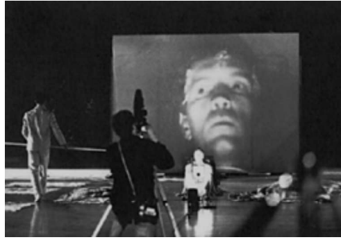
Görsel 20: EAT, Robert Rauschenberg, Open Score, 9. Akşam, Tiyatro ve Mühendislik Ortak Çalışması, 1966.

harmanladığı yeni bir ürün olarak ortaya çıkmıştır. Farklı disiplinlerdeki çok seslilik diğer sanatçıların ilgisini çekmiş ve farklı alandaki insanlarla ortak çalışmalar yapma fikrinin önemi artmıştır. Örneğin; 9. Akşam adlı yapıt, görsel sanatçıların, dansçıların ve müzisyenlerin farklı meslekteki insanların ortak çabaları sonucunda oluşturulmuştur (Görsel 20).