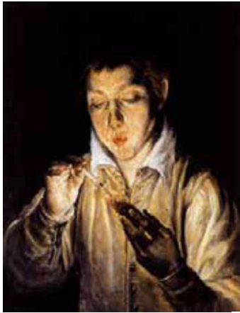
Görsel 11: El Greco, Alev Üfleyen Çocuk, Ahşap Üzerine Yağlı boya Özel Koleksiyon .