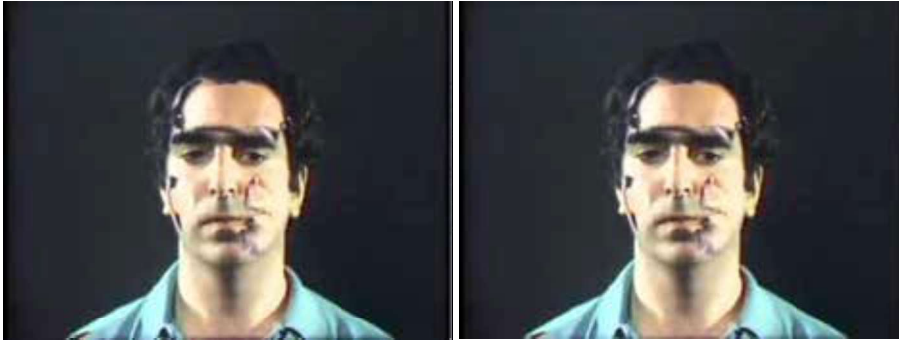
Görsel 22: Peter Campus, “Üç Geçiş (Three Transition)”, video kamera, 1973.

Görüldüğü gibi bu sanat biçimi de farklı malzeme, araç-gereç, internet, bilgisayar, fotoğraf ve teknoloji gibi farklı disiplinlerden yararlandığı göze çarpmaktadır. Bir önceki konuda da video gibi teknolojik gelişme başka bir sanat eğiliminin ortaya çıkışını sağlamıştır. Bu sanat biçimi de video sanatıdır. Video sanatı, çok yeni olan bir teknolojik gelişmedir ve bu gelişme 1960'lı yıllarda ortaya çıkmış ve 1980'lerin ortalarında da önemini yitirerek etkisini kaybetmiştir. Video bu dönemde hem kitle iletişim aracı hem de filmlerde, tiyatro oyunlarında, gösterilerde ve birçok sanatsal etkinliklerde kullanılmıştır.