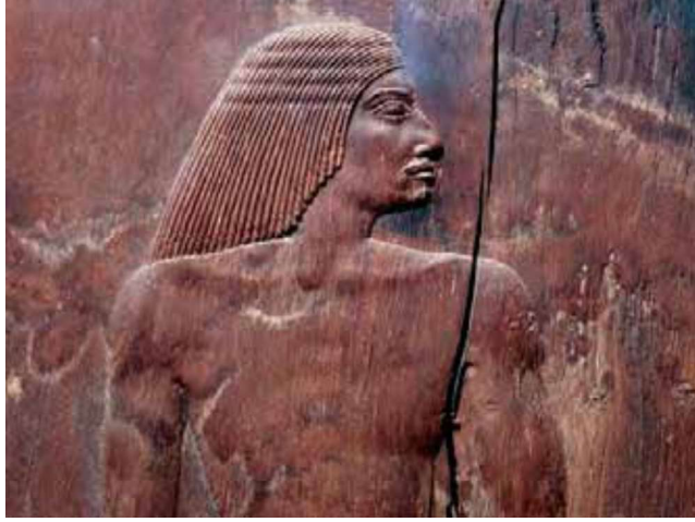
Görsel 2: “Hesire’nin Portresi”, gömütün tahta kapısının bir bölümü. İÖ, 2700, Kahire Müzesi, Mısır.

Mısır uygarlığında bu sanatsal gelişim sürecinde devam eden diğer bir uygarlık da Yunan’dır. Yunan uygarlığı sanatı üç dönemde incelenmektedir: Arkaik Dönem, Klasik Dönem ve Helenistik Dönem. Sanatsal oluşum bu üç dönemde gelişim göstererek devam etmiştir. Yunan uygarlığında portre iki şekilde tasvir edilmiştir. İlki, antik vazoların üzerine yapılan resimlerde ve ikincisine de Antik Yunan heykellerinde rastlanmaktadır. Antik vazo resimlerinde anlatımcı stilize edilmiştir ve insan figürleri/portreleri dikkat çekmektedir (Görsel 3).