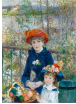
Görsel 18: Pierre- August Renoir, İki Kız Kardeş, 1881, Tuval Üzerine Yağlı boya 80.9 x 100.4 cm, Chicago Sanatlar Enstitüsü, ABD.

sanatsal gelişmeler doğrultusunda olduğu anlaşılmıştır. 20.yüzyıla gelindiğinde ise birden fazla sanat akımlarının / üsluplarının portre konusuna yeni kullanım alanları yarattığı görülmüştür.