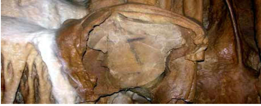
Görsel 1: "İlk Portre Örneği ", Vilhaneur Mağarası, Angouleme, Fransa.

Portre; bir insanın desen, resim, fotoğraf ve benzeri yollarla tasviri olarak öne çıkmaktadır. Portre konusu, insanın farklı teknikler arayıcılığıyla kendini veya bir başka kişiyi görselleştirmesidir. Portre veya otoportre; İlk Çağ'dan günümüze kadar farklı tekniklerde, üsluplarda değişim geçirerek gelişimini sürdürmüş ve resim sanatının her zaman önemli konuları arasında yer almıştır. Tarihte bilinen en eski portre, 2006 yılında Fransa'nın Angouleme şehri yakınındaki Vilhaneur Mağarası içinde bulunan ve 27.000 yıllık geçmişe sahip olduğu tespit edilen bir duvar resmidir ( Görsel 1 ).