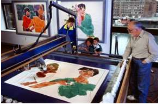
Görsel 28: Harold Cohen, Bilgisayar Çizimi Resim Yapımı, 1995, Bilgisayar Müzesi, Boston Amerika.

geliştirilmesiyle renkli baskılar yapılmaya başlanmıştır. Öncelikle bu çizimler basit şekillerden oluşmuştur. Daha sonra, programın yenilenmesiyle insan, bitki, obje ve iç mekân gibi suluboyayı andıran resimsel görüntüler elde edilmiştir (Görsel 28-29). Bu program sayesinde oluşturulan eserlerin yapay zekâ