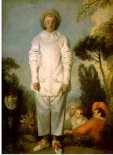
Görsel 14: Antoine Watteau. "Gilles" 1718-19, tuval üzerine yağlı boya, 149x184cm, Louvre Müzesi, Fransa.

Sanat alanındaki gelişim, beraberinde yeni yaklaşımların doğuşuna sebep olmakta ve bu oluşumlar da sanat alanında farklı dönem ve tarzların görülmesiyle sonuçlanmaktadır. Neoklasisizm, akıl ve dünyanın akıl yoluyla kavranmasını öncelik olarak gören aydınlanma görüşüyle ortaya çıkar ( Görsel 15 ).