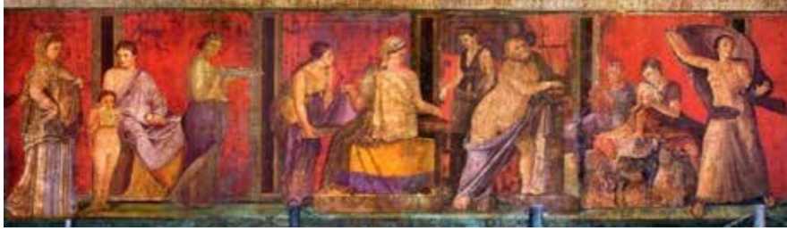
Görsel 4: Sanatçısı bilinmiyor, “Yemek Odası”, duvar freski (ayrıntı), MÖ, 60-50, 162 cm, Pompei, İtalya.

resimlerde Roma-Helenistik karışımı bir kompozisyon şekli göze çarpmaktadır (Turani, 1999: 199).