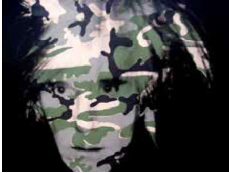
Görsel 19: Andy Warhol, “Kamuflej Otoportre”, tuval üstüne serigrafik mürekkebi ve sentetik polimer boya, 1970, 208,3x208,3 cm. Metropolitan Müzesi, New York, ABD.

Disiplinler arası doğrultusunda 20. yüzyılda özellikle 1960’ların sonunda, tüketimi çekici hâle getirmek için; reklamlar, renkli afişler, hatta resimli dergiler ve romanlar kullanılmaya başlanmıştır. Buna benzer malzeme kullanımını pop sanatının, dada sanatının benzer yönlerini/yöntemlerini kullanmasında görülmüştür. Bu dönemde kolaj ve asamblaj tekniği tekrardan gündeme gelmiş ve pop art sanatçıları tarafından kullanılmıştır. Kitle kültürü özelliklerine göre biçimlenen bu sanat akımı, geniş kitlelere ulaşabilmek için hem medyayı hem de farklı sanat güçlerini de bir arada kullanmıştır. Bu bira adalık disiplinler arası kullanımıyla gerçekleşmiştir. “Pop sanatta, klasik sanat di-