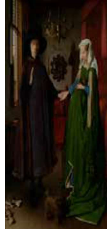
Görsel 10: Jan Van Eyck, Arnolfini'nin Evlenmesi, 1434 59,7 x 81,8 cm, Meşe Galerisi, İngiltere.