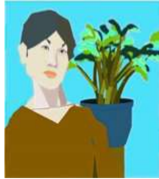
Görsel 29: Harold Cohen, AARON Tarafından Üretilen Resim, Plotter Baskı, Kağıt Üzerine Pigment Bilgisayar Görüntüsü, 2003 25 x 25 cm.

ile sanatın yaratıcılığın tasarım boyutunun uyumlu birlikteliği göze çarpmaktadır. Sanatçının yapmış olduğu çalışmalarla bu noktaları iyi özümlediği ve bu yolla da yeni bir sanatsal bakış geliştirdiği görülmektedir (Tuğal, 2018: 163-167).