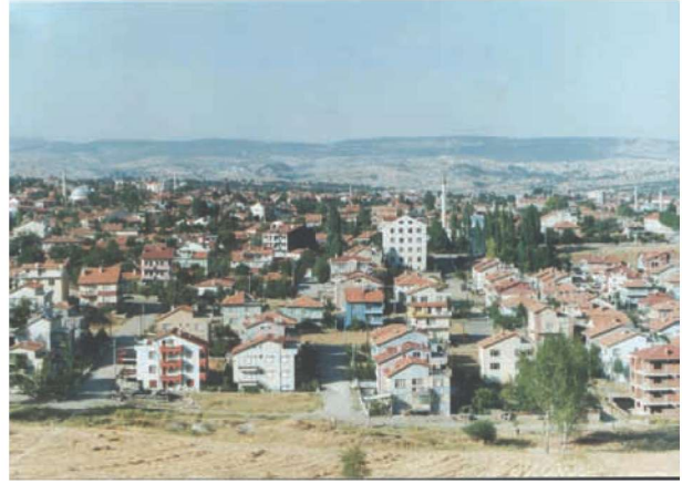
Res. 7. Yeni Gediz ilçe merkezinden bir görünüm.

Şek. 2. 1970 yılındaki taşınma kararından sonra yeni yerleşimin (Gediz ilçe merkezinin) konumu, Eskigediz'e uzaklığı ve mevcut fay hatları ile ilişkisi. (Ambraseys 1972 ve Eyidoğan 1991: 147'deki şekilden yeniden düzenlenmiştir.)