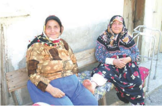
Res. 8. Depremden sonra Eskigediz'e göç etmiş olan Kurtuluş Mahallesi, Çukur Sokak sakinleri.