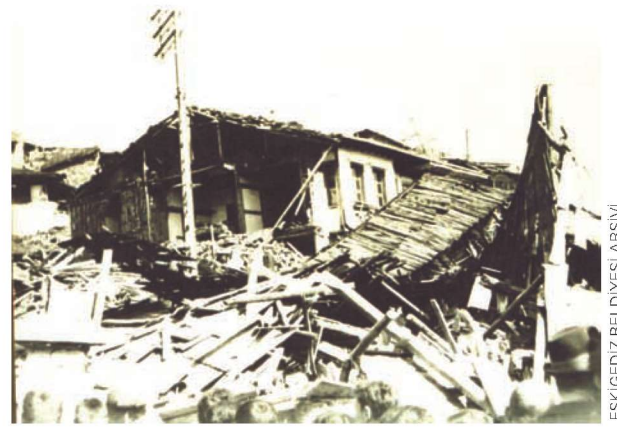
ESKİGEDİZ BELDİYESİ ARŞİVİ