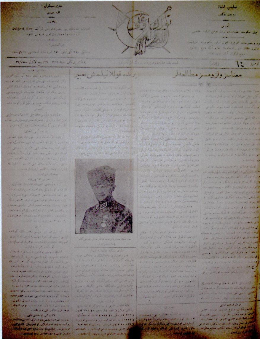
-Türkçüglü'nda "Halaskâr-ı Millet Başkumandanımız" sıfatıyla fotoğrafı yayımlanan Gazi Mustafa Kemal Paşa (Türkçüglü, 19 Kasım 1922).