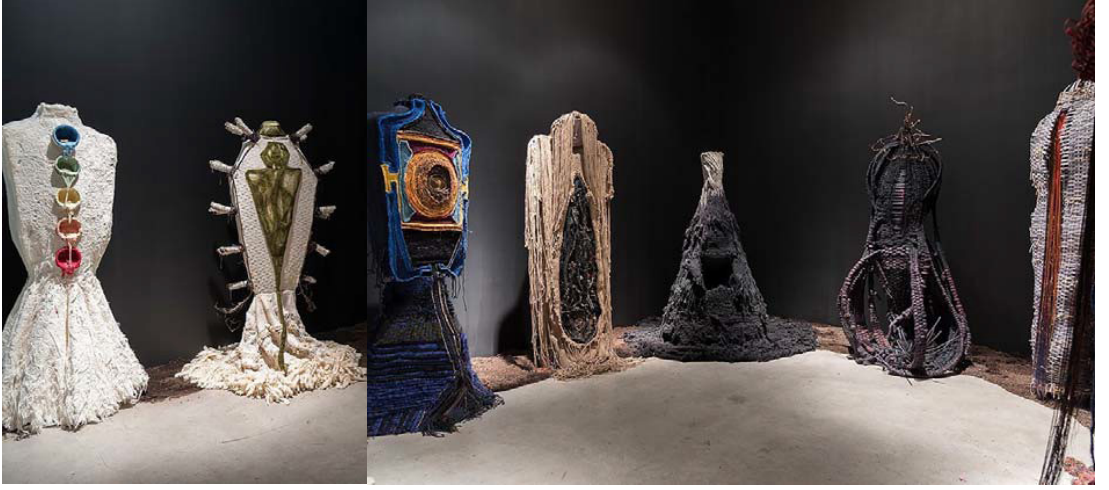
Şekil 7: Erik Bergrin, Shadowwork Serisi, 2015, Çuval bezi, Kemik, Diş, Kil, Çivi