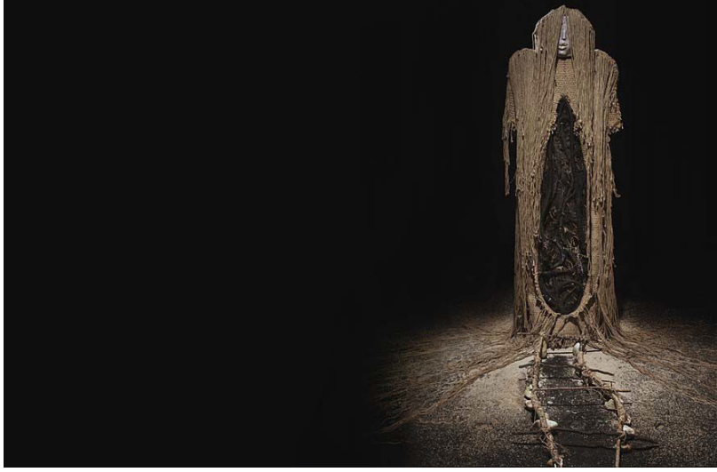
Şekil 6: Erik Bergrin, Juanita, 2015, Çuval bezi, Kemik, Diş, Kil, Çivi, 210.82 cm