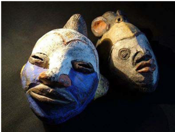
Şekil 3. Afrika'da kullanılan Ataları temsil eden maskeler en yaygın olarak bir insan kafatası şeklindedir.

Ortaçağ'da kilise, Paganizmden kalan inanışlara tepki olarak, paganist ayinler ve ritüeller yapanları cadılıkla suçlayıp engizisyon mahkemelerince idam etmiştir. Bu idamlar halka açık olarak bir şov gibi yapılmaktadır. Burada amaç Hristiyanlığa geçmeyen paganlara gözdağı vermektir. O tarihlerde paganlar ve doğal güçlere inanlar kendilerini toplumun baskılarına karşı korumaya almışlardır. Bazı tarihçilere göre, paganlar o dönem yapılan ritüelleri, büyü ya da tılsımları kiliseden saklamak amacıyla bir takım sanat eserlerine saklamışlardır. Tabi bu eserlerde sembolik anlatımlar söz konusudur. Bu durum da tek tanrılı dinlere inanmayan ve pagan kültürünü yaşatmaya çalışan bir takım gizli örgütsel yapılandırmayı mecburen ortaya çıkartmıştır.