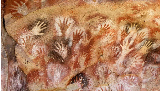
Şekil 1. Cueva de las Manos, M.Ö. 7300

Bu çalışmanın bütününde araştırma, bulguların derlenmesi ve uygulanması sırası ile gözetilmiştir. Araştırma sırasında çeşitli yazılı ve görsel kaynakların yanı sıra, internet veri tabanı ortamından da yararlanılmıştır. Bu çalışmanın materyalini çeşitli görsel kaynaklar ve literatür taraması sonucunda elde edilen veriler oluşturmaktadır. Müzeler, kataloglar, sergiler, kütüphaneler ve özel eserlerden yararlanılmıştır.