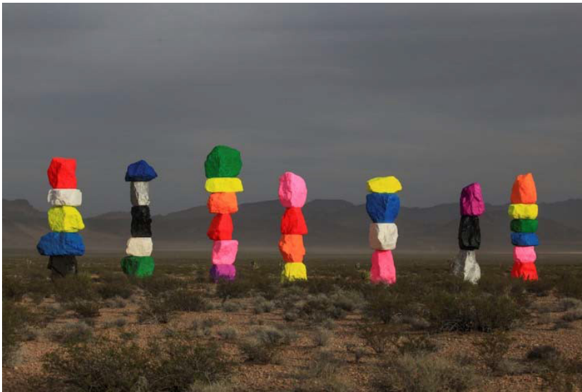
Şekil 9. Ugo Rondinone, Seven Magic Mountains, 2016, Kaya

Sanatçının en çok bilinen son dönem işlerinden biri, Seven Magic Mountains (Yedi Sihirli Dağ) isimli, yaklaşık 11 metre uzunluğunda olan enstalasyon çalışması olmuştur. Nevada çölünde sergilenen enstalasyon çalışmasını Ugo Rondinone şu cümlelerle açıklamaktadır: Seven Magic Mountains, insan-doğa ve yapay-doğal arasındaki süreklilikleri ve dayanışmayı ortaya çıkarmayı amaçlamaktadır (URL 6). Nevada çölündeki bu renkli primitif tabanlı totemler oldukça dikkat çekicidir. Pürüzlü taş ve parlak renk kombinasyonu, Seven Magic Mountains, Vegas Vadisi'ni oluşturan kaya oluşumları ile onun içinde yükselen parlayan, tektonik şehir arasındaki kayıp halka olarak görülebilir (URL 7).