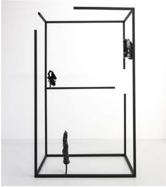
Şekil 4: Felix Kultura, Monster Energy, 2017, Metal, Boya, Enerji İçeceği ve Kutusu, 150 x 90 x 40 cm.