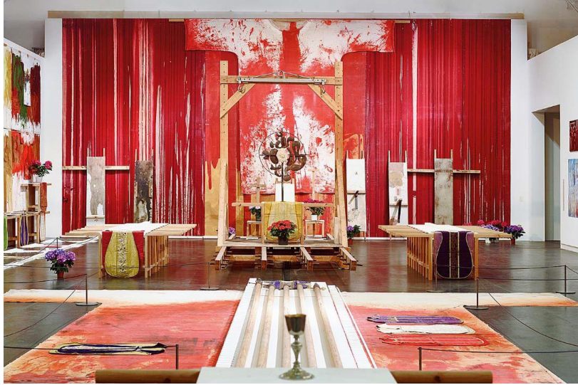
Şekil 15. Hermann Nitsch, Ritual, 2015, Enstalasyon