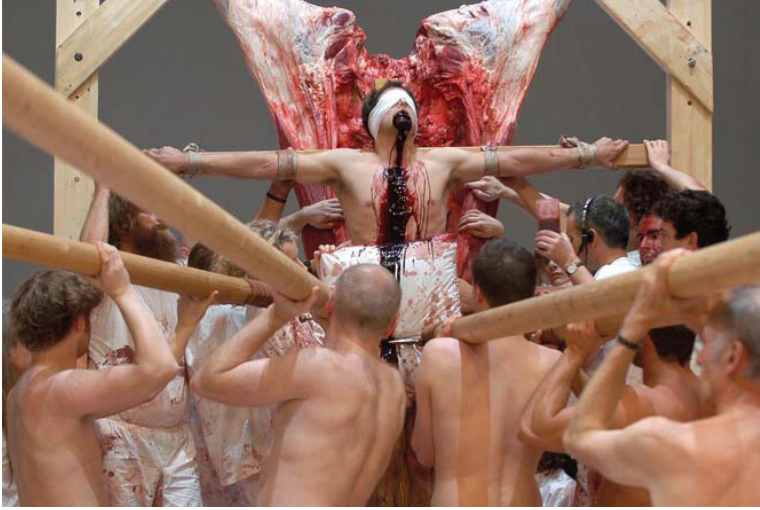
Şekil 14. Hermann Nitsch, Die erste heilige Kommunion, 2005, Performans

Hermann Nitsch, öğrencilik yıllarında geliştirdiği ve Orgien Mysterien Theater adını verdiği dini ayinleri andıran aksiyonlarında; geleneğe dönüşmüş, bir modern sanat ritüelini sürdürmüştür. Nitsch; bedeni kan, çıplaklık ve şiddet bağlamında bir yandan kutsarken, bir yandan da modernist beden politikalarına eleştirel bir yaklaşım getirmiştir. İlk çağ ritüellerini andıran performansları (URL 9) vardır. Nitsch kurguladığı ritüel performanslarında, yabanıl atalardan gelen kurban, kan, beden ve törenin değişen yapısını sorgular (Bkz. Şekil 14). Bu bağlamda yaptığı ritüellerde çağdaş insanın içinde barındırdığı vahşiliği göstermek ve dinsel ayinlerde alınan toplumsal hazza gönderme yapmaktadır.