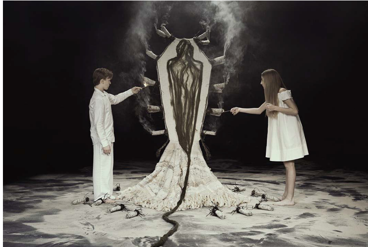
Şekil 8: Erik Bergrin, The Cleansing Piece 2 Shadowwork serisi, 2015, Adaçayı, At kılı, Bez, Kemik, Yün, Pamuk, 203.2 cm