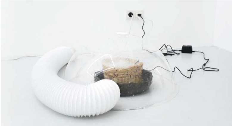
Şekil 5: Felix Kultura- Malte Zenses, Pay For Rituals, 2017, Seramik, Akrilik Cam, Sis, 60 x 60 cm