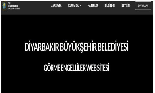
Görsel 3. Diyarbakır Büyükşehir Belediyesi Görme Engelliler Web Sitesi Görseli