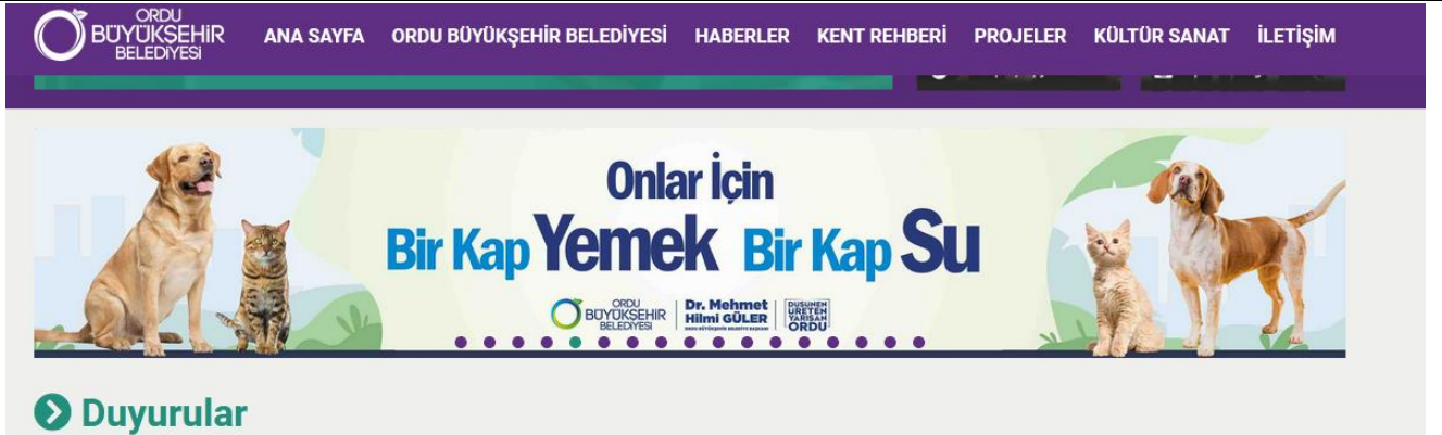
Görsel 8. Ordu Belediyesi Sosyal Sorumluluk Projesi Banner Örneği