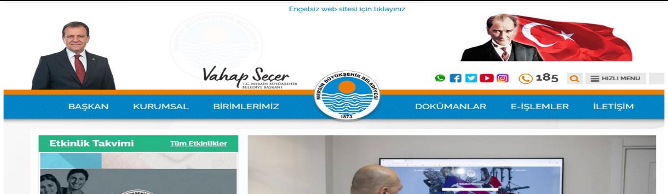
Görsel 7. Mersin Büyükşehir Belediyesi Engelsiz Web Sitesi Erişim Görseli

Mersin Büyükşehir Belediyesi web sitesinde sosyal hizmetler ana sayfadan kolay ulaşılabilir biçimde hizmette bulunmaktadır. Ayrıca Mersin Büyükşehir Belediyesinin Engelsiz web sitesi uygulaması diğer şehirlerin web sitelerinde görülmemesi nedeniyle dikkat çekmektedir. Ana sayfanın üzerinden direkt olarak Engelsiz Web Sitesine erişim sekmesi açılmıştır. Sayfanın görseli aşağıda yer almaktadır.