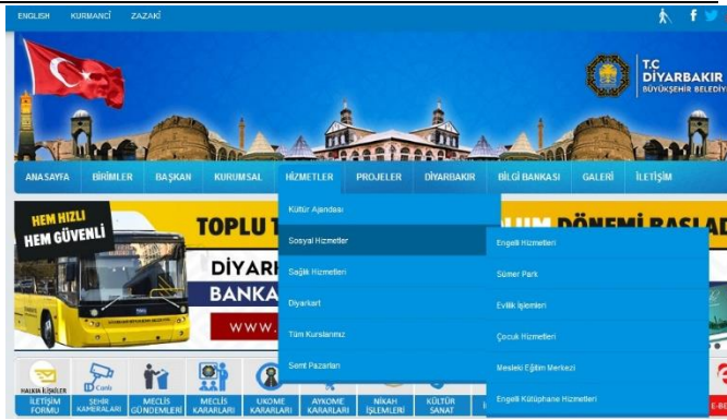
Görsel 12. Diyarbakır Büyükşehir Belediyesi Sosyal Hizmet ve Sosyal Sorumluluk Faaliyet Kategorileri Görseli

Diyarbakır Büyükşehir Belediyesi sosyal sorumluluk ve sosyal hizmetler kategorisinde kadın, yaşlı, psikolojik danışma, hayvan ve sağlık kategorilerinden herhangi bir veriye rastlanmamıştır. İlgili görsel aşağıdadır. Bu web sitesi diğerlerinden farklı olarak Kurmanci, Zazaki ve İngilizce dil seçeneklerinin ifadesi de aynı görselin sol üst kısmında yer almaktadır.