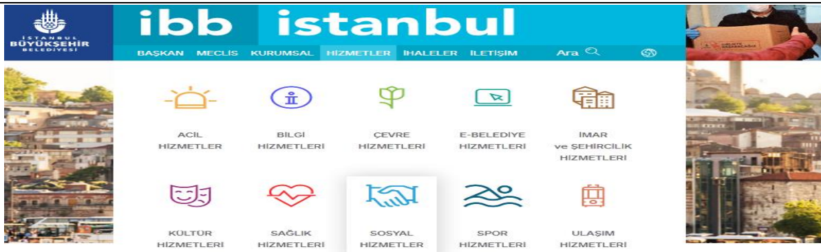
Görsel 5. İstanbul Büyükşehir Belediyesi Sosyal Hizmetler Tanıtım Materyallerine ulaşım Sekmesi Görseli

Gaziantep Belediyesi web sitesi kullanım haritası kolay kullanılabilir nitelikte değildir. Ulaşım istenen sosyal hizmet bilgilerine daire başkanlığı üzerinden ulaşmak söz konusu değildir. Başkanlıkların her biri içinde sekme açılmış ancak verilere ulaşımamaktadır. Örneğin “Kadın,