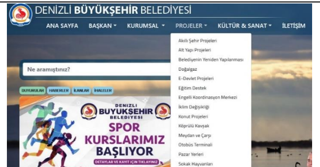
Görsel 2. Denizli Büyükşehir Belediyesi Sosyal Hizmet ve Sosyal Sorumluluk Tanıtım Materyalleri Sekmesi

https://balikesir.bel.tr/calismalar/sosyal-destek-ve-etkinlikler