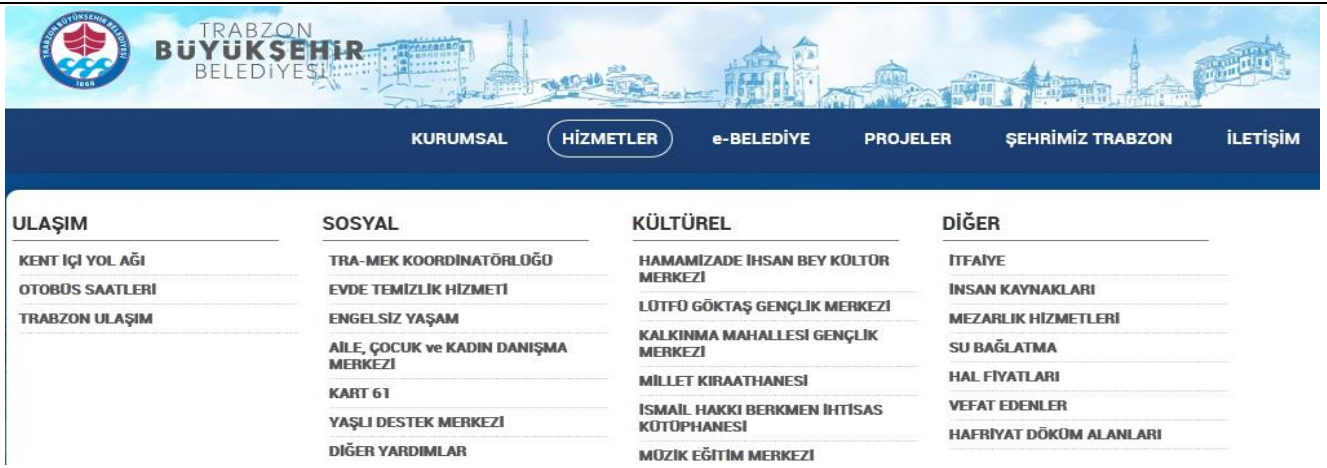
Görsel 9. Trabzon Büyükşehir Belediyesi Web Sitesi Sosyal Hizmetler Sekmesine Ulaşım Görseli

Trabzon Büyükşehir Belediyesi ana sayfadan Hizmetler sekmesi ile Engelsiz Yaşam, Evde Temizlik Hizmeti, Aile Çocuk Danışma Merkezi, Kart 61, Yaşlı Destek Merkezi ve Diğer Yardımlar alt sekmeleri ile sosyal hizmet ve sosyal sorumluluk projeleri tanıtım materyallerini sayfasında bulundurmaktadır. İlgili sayfanın görseli aşağıda Görsel 9’da yer almaktadır.