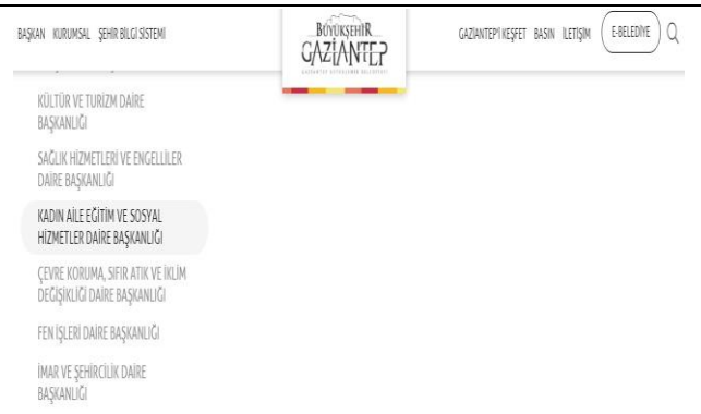
Görsel 4. Gaziantep Büyükşehir Belediyesi Web Sitesi Kadın, Aile, Eğitim ve Sosyal Hizmetler Daire Başkanlığı Sekmesi Görseli

Kaynak: https://gaziantep.bel.tr/tr/birimler/kadin-aile-egitim-ve-sosyal-hizmetler-daire-baskanligi