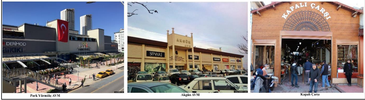
Fotoğraf 3: Alışveriş Merkezleri

kültürü ile ortaya çıkmış Alışveriş merkezleri Elazığ'da da katılımcıların en sık gösterdikleri yerlerdir. Elazığ'da 2 tane alışveriş merkezi bulunmaktadır. Bunlardan birincisi 2004 yılında açılan Akgün AVM, ikincisi ise 2014 yılında faaliyete geçen Park 23 AVM'dir. Akgün AVM kentin kuzeybatısında Keban yolu üzerinde bulunurken, Park 23 AVM ise Malatya yolu üzerinde Hazardağlı kavşağının batısında bulunmaktadır. AVM'lerin sık uğranan mekânlar olması geleneksel üretim alanlarının öneminin azalmasındaki en önemli etkenlerin başında gelmektedir.