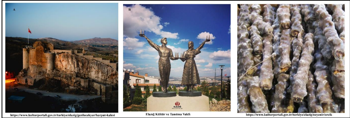
Fotoğraf 1: Kültürel İmgeler: A: Harput Kalesi, B: Çaydağra C: Orcik

Konuya yönelik yapılan görüşmelerde katılımcılara sorulan ilk soru, “Elazığ” denilince aklınıza gelen ilk çağrışım ne olmuştur sorusu sorulmuştur. Katılımcıların % 90’nı Orcik, Çaydağra, Harput ve memleket sevgisinin ön plana çıktığı bir kent cevabını vermişlerdir (Fotoğraf 1).