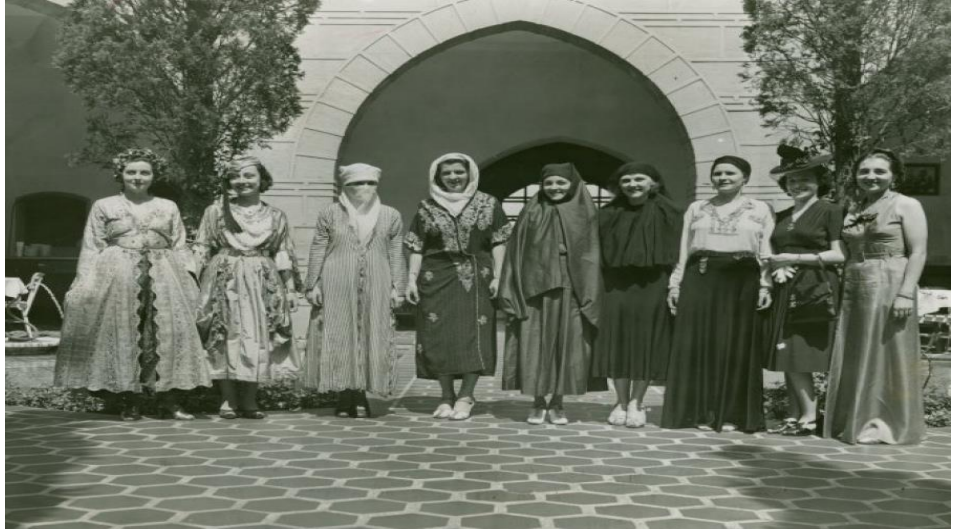
Fotoğraf 1: New York Sergisi'nde yer alan eskiden yeniye kadın kıyafetleri.