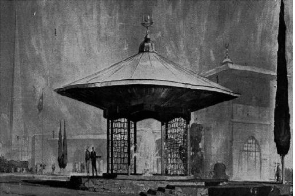
Fotoğraf 3: New York Sergisi'nde Türk Sitesi içinde bulunan Türk Çeşmesi (Eldem 1939)